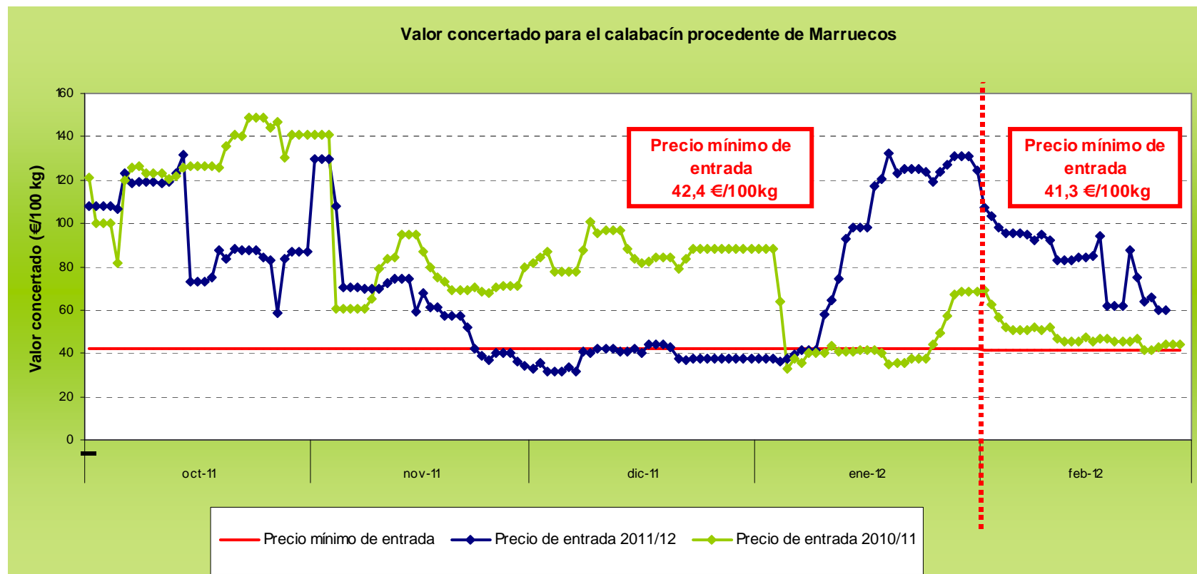
Gráfico 2 Evolución de las cotizaciones de calabacín procedente de Marruecos a lo largo de la campaña 2011/12.

Fuente: Elaboración propia a partir de información publicada por la Comisión Europea de volúmenes importados bajo contingente.