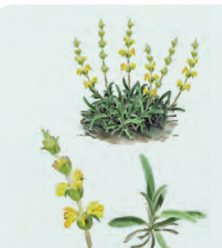
33 CANDILERA Phlomis lychnitis