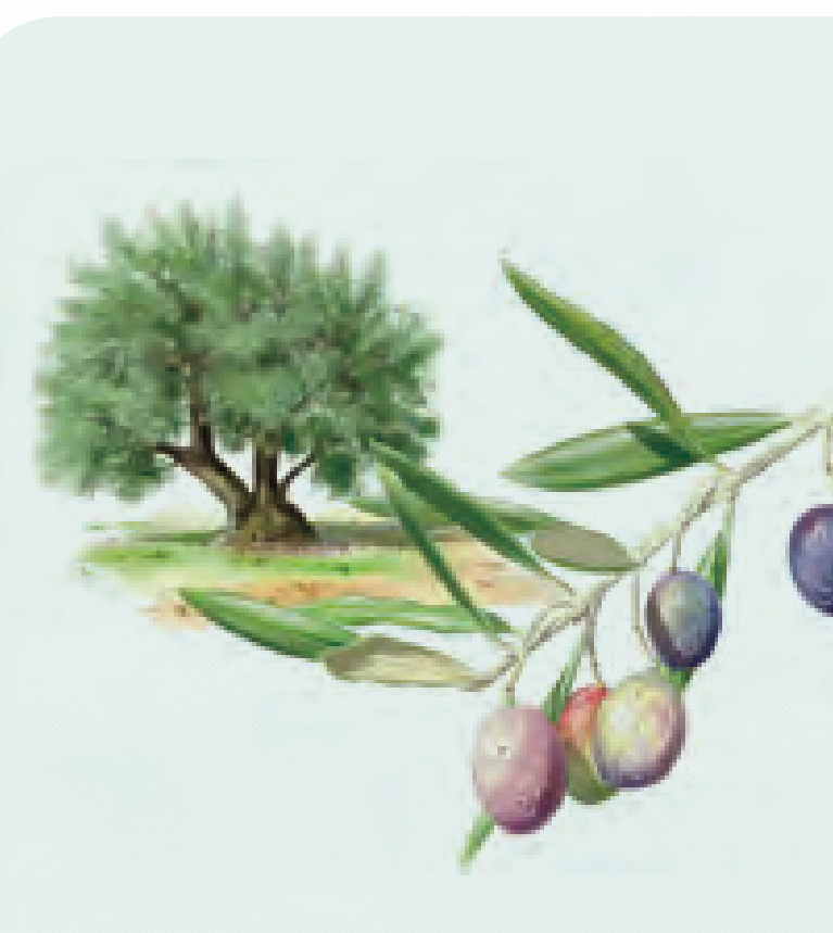
31 OLIVO Olea europaea