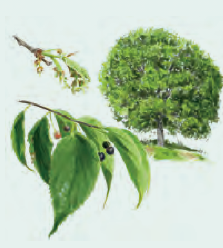
14 ALMEZ Celtis australis