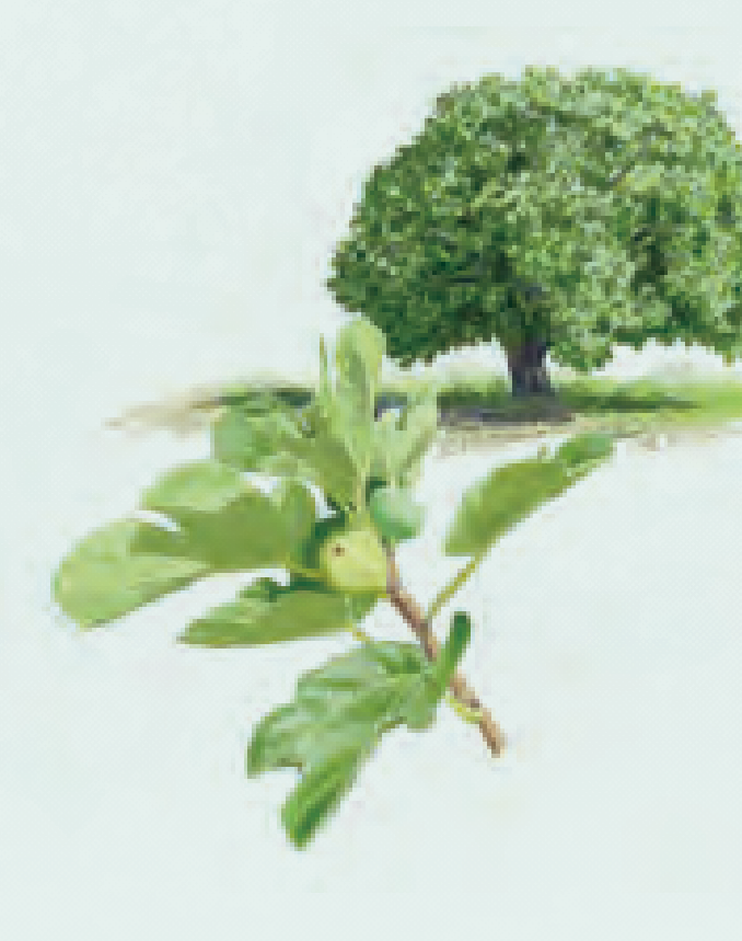
8 HIGUERA Ficus carica