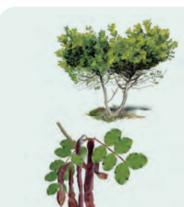
25 ALGARROBO Ceratonia siliqua