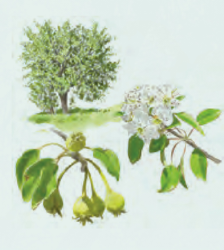
5 PERAL SILVESTRE O PIRIÚETANO Pyrus bourgaeana