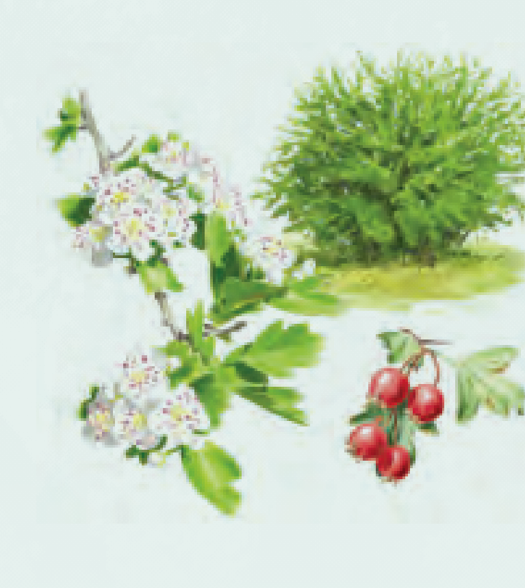
7 MAJUELO Crataegus monogyna