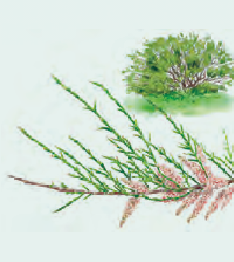
12 TARAJE Tamarix gallica