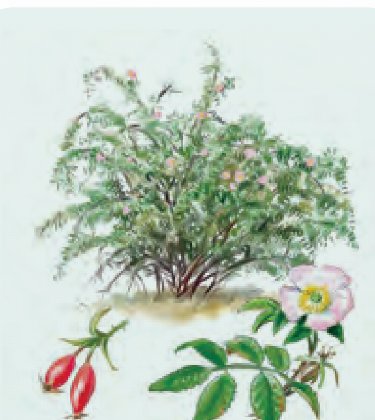
29 ROSAL Rosa micrantha