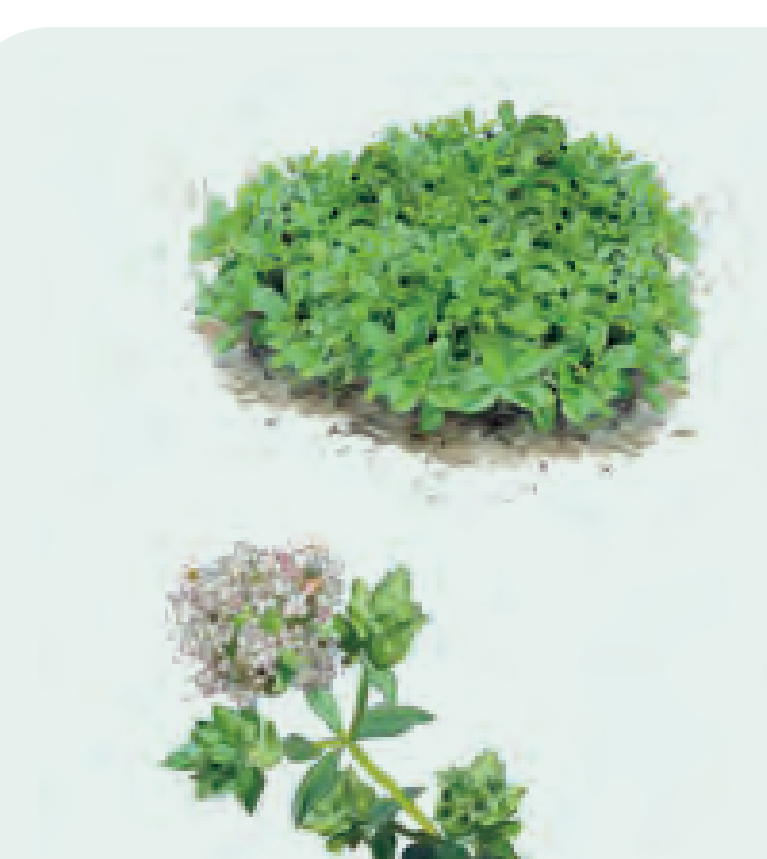
21 ORÉGANO Origanum vulgare