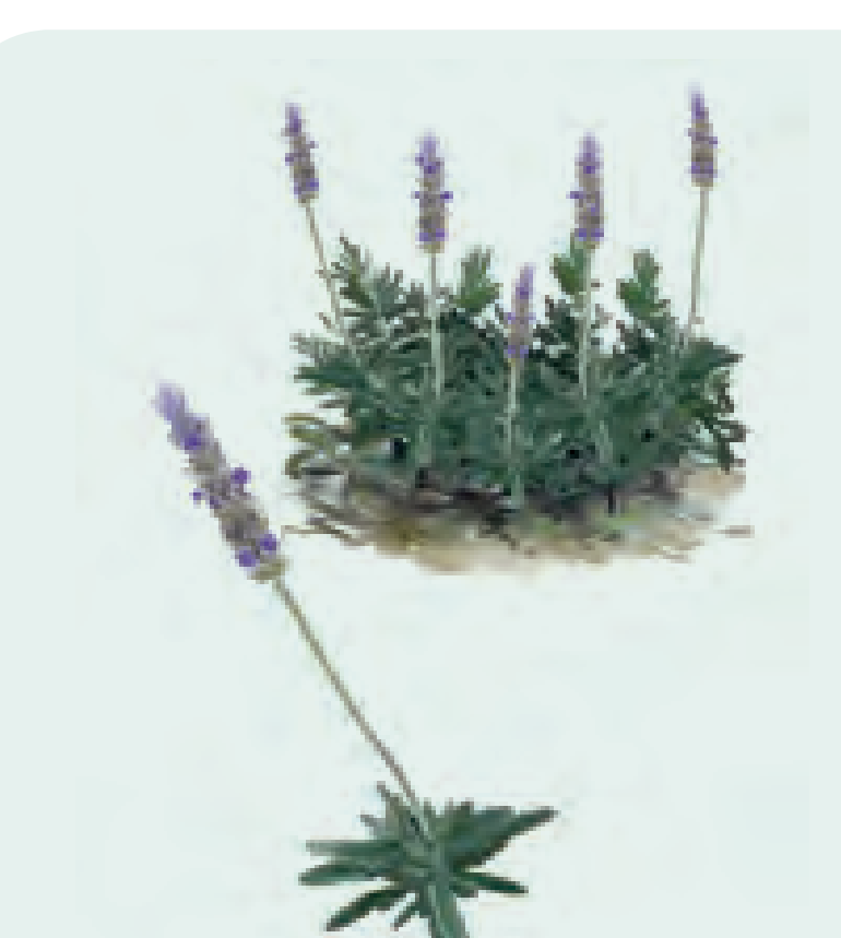
23 LAVANDA Lavanda dentata