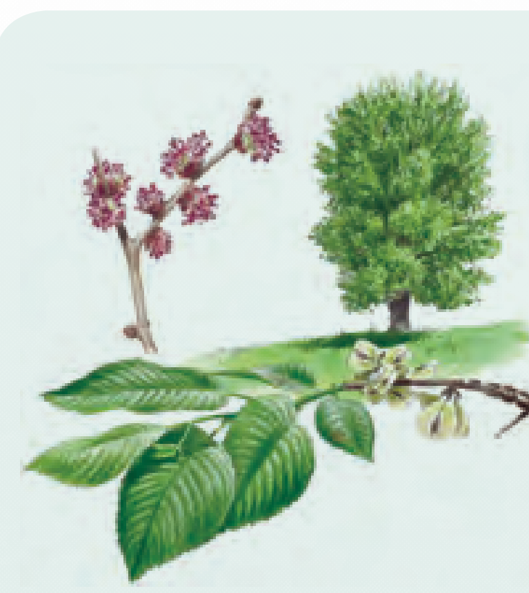
34 OLMO Ulmus minor