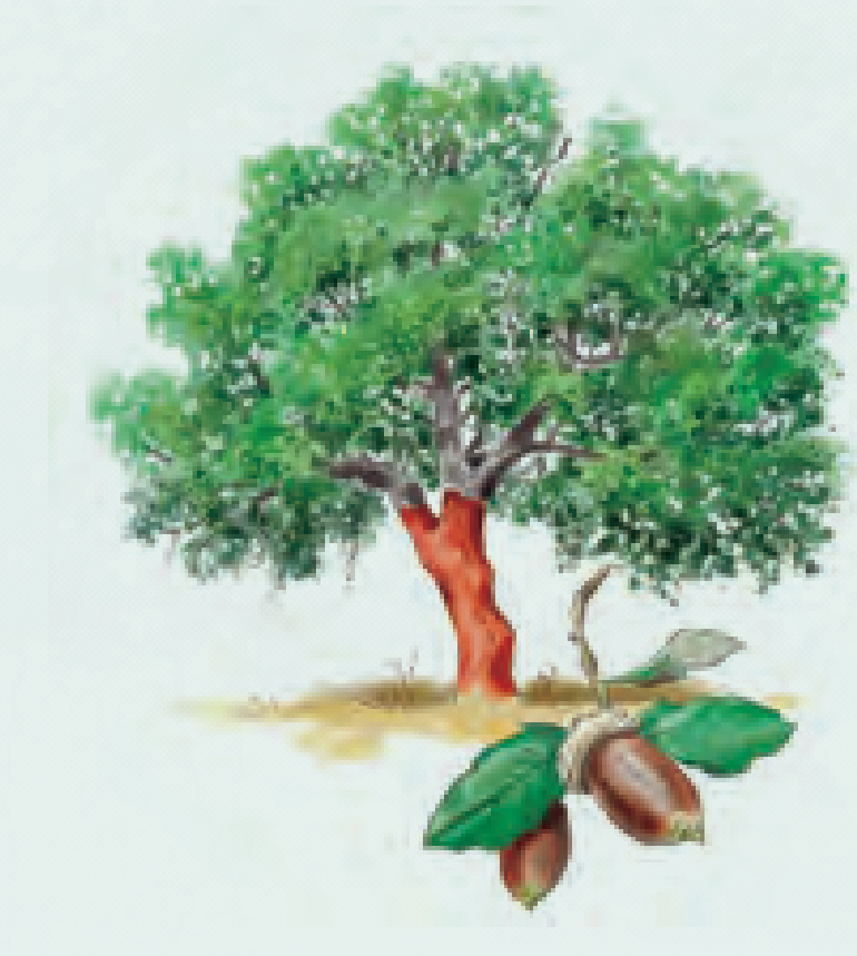
9 ALCORNOQUE Quercus suber