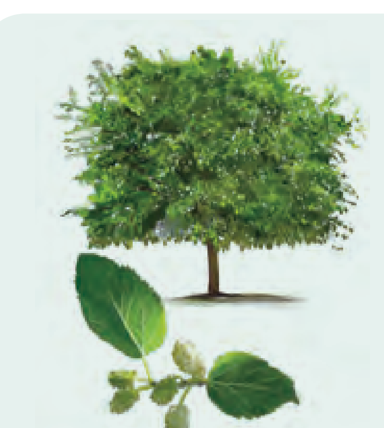
24 MORENA Morus alba