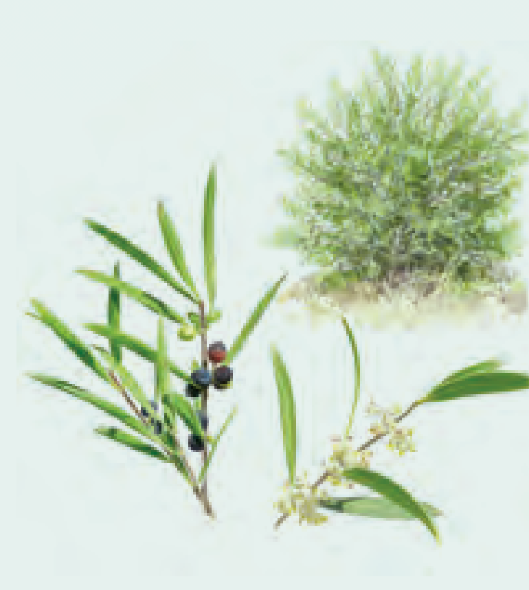
15 LABIÉRNAGO Phyllirea angustifolia