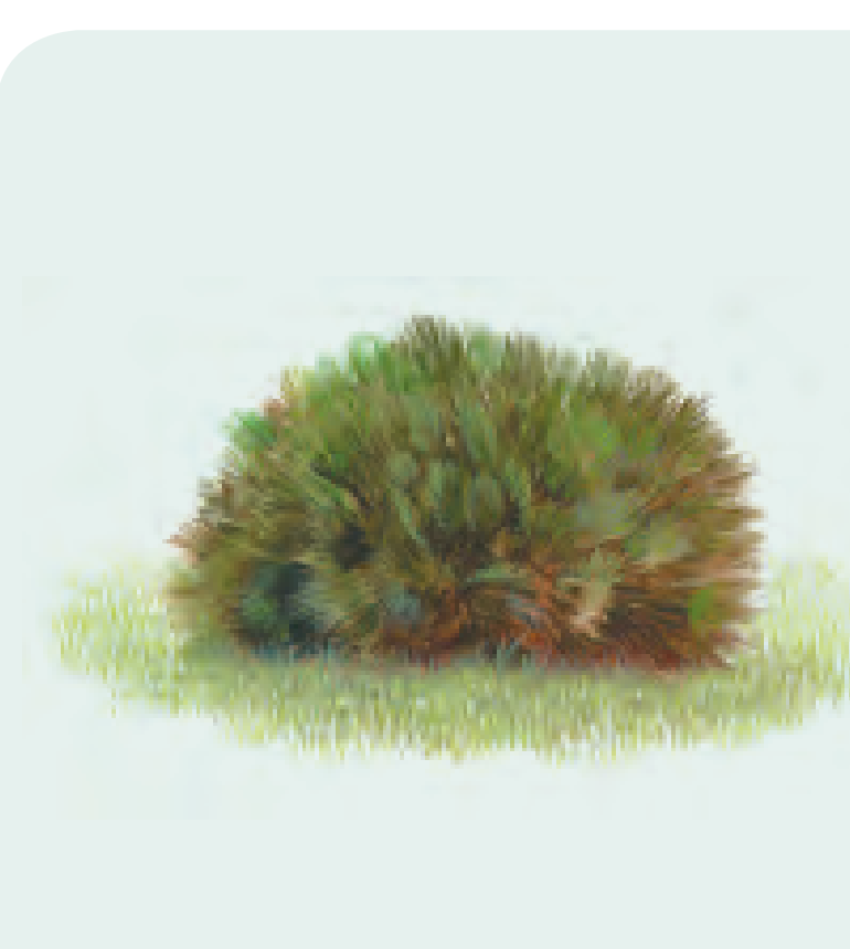
27 PALMITO Chamaerops humilis