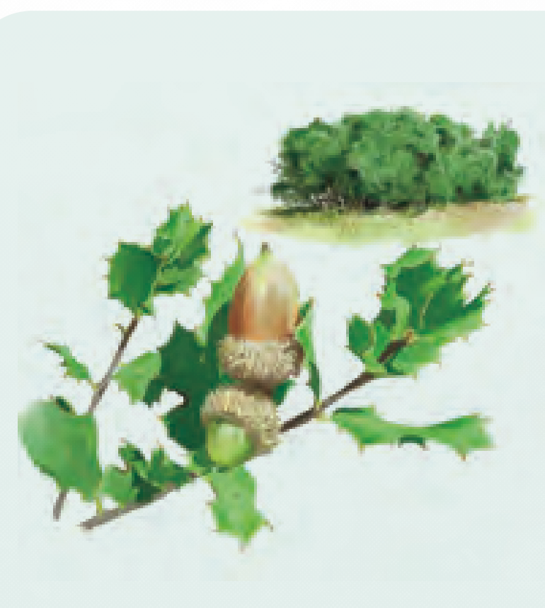
32 COSCOJA Quercus coccifera