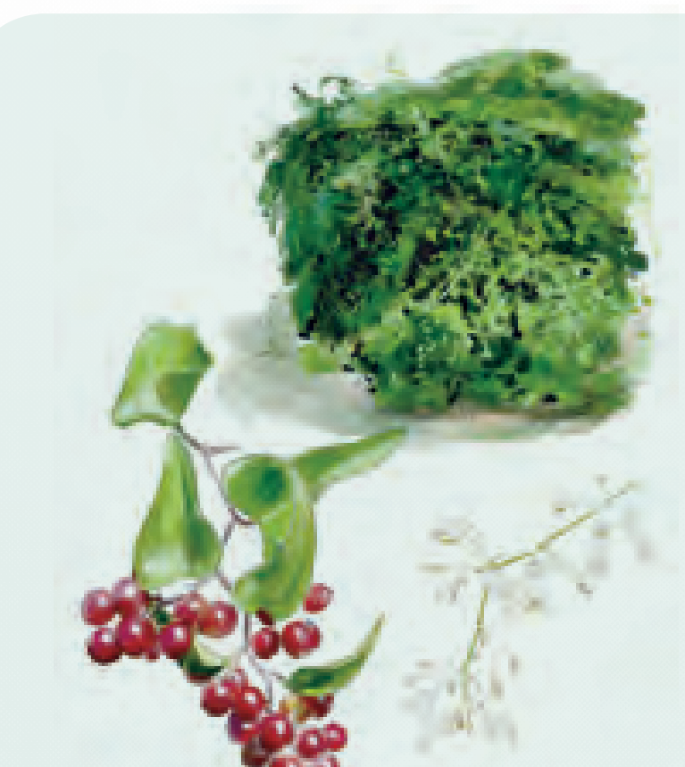
30 ZARZAPARRILLA Smilax aspera