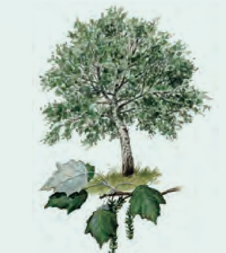
13 ÁLAMO BLANCO Populus alba