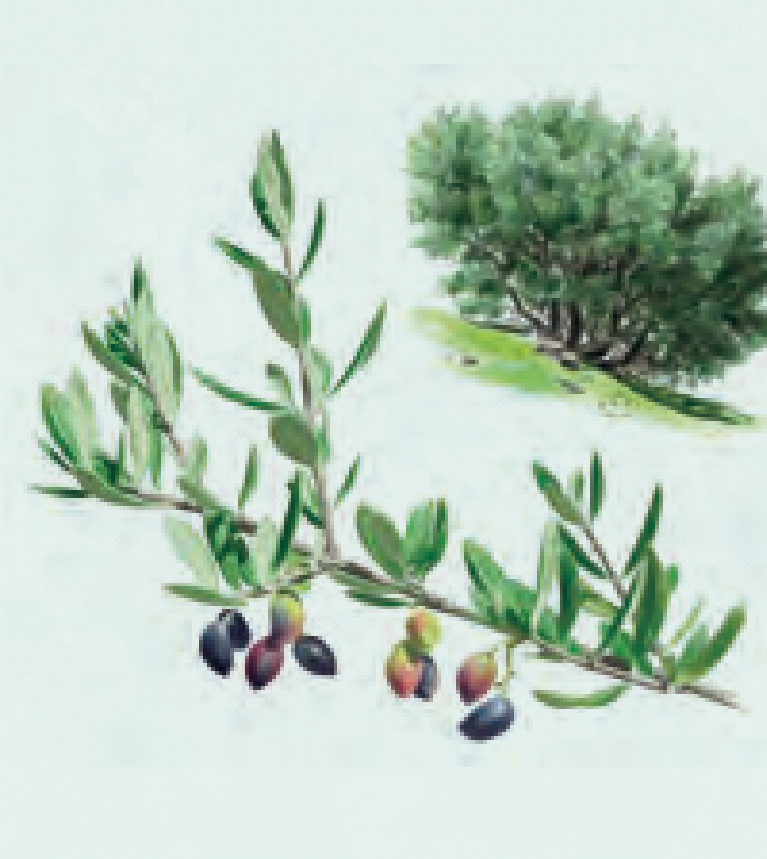
4 ACEBUCHE Olea europaea sylvestris