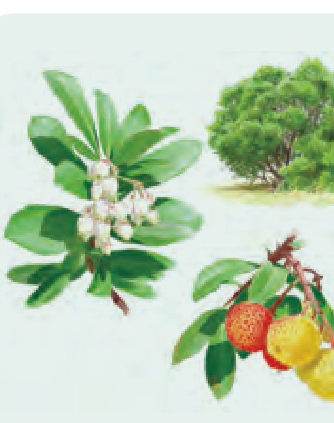
26 MADROÑO Arbutus unedo