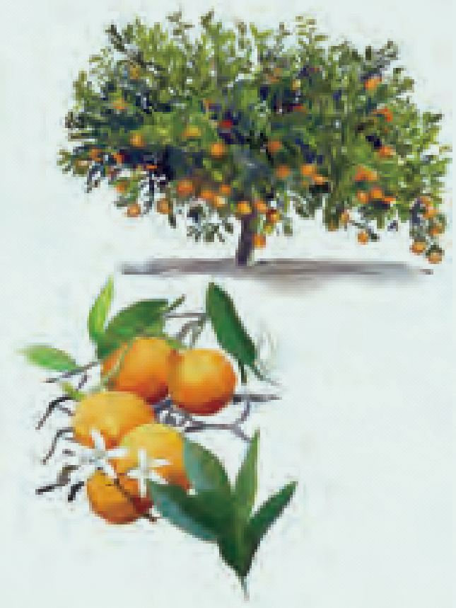
1 NARANJO DULCE Citrus sinensis