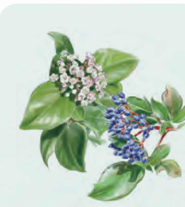
36 DURILLO Viburnum tinus