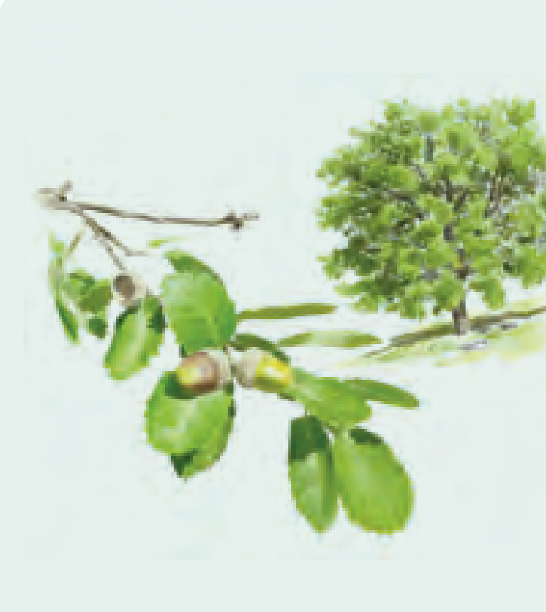
16 QUEJIGO Quercus faginea