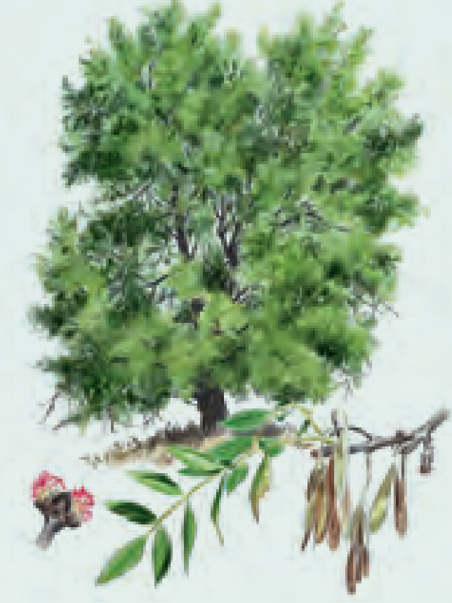
2 FRESNO Fraxinus angustifolia