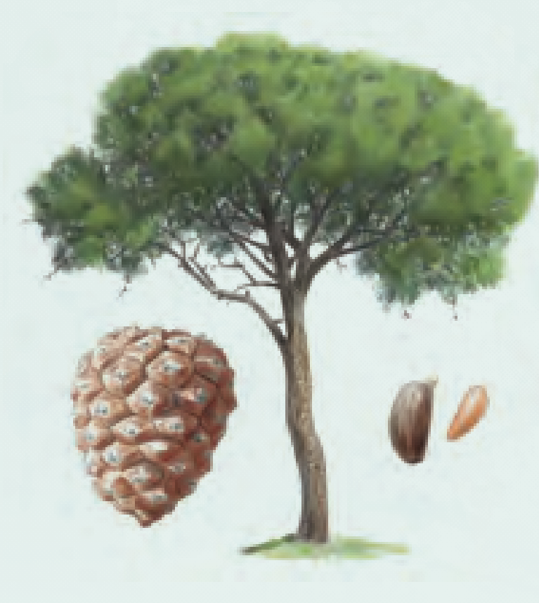
3 PINO PIÑONERO Pinus pinea