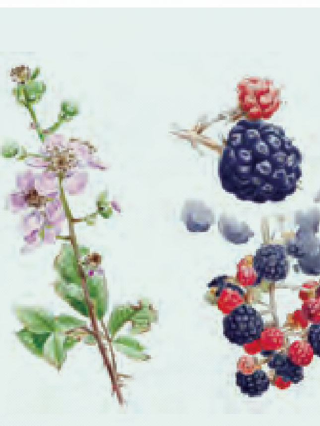
28 ZARZA Rubus ulmifolius