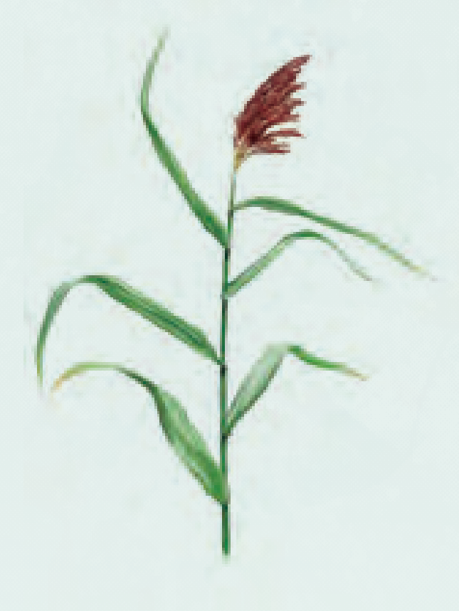
6 CARRIZO Phragmites asutralis