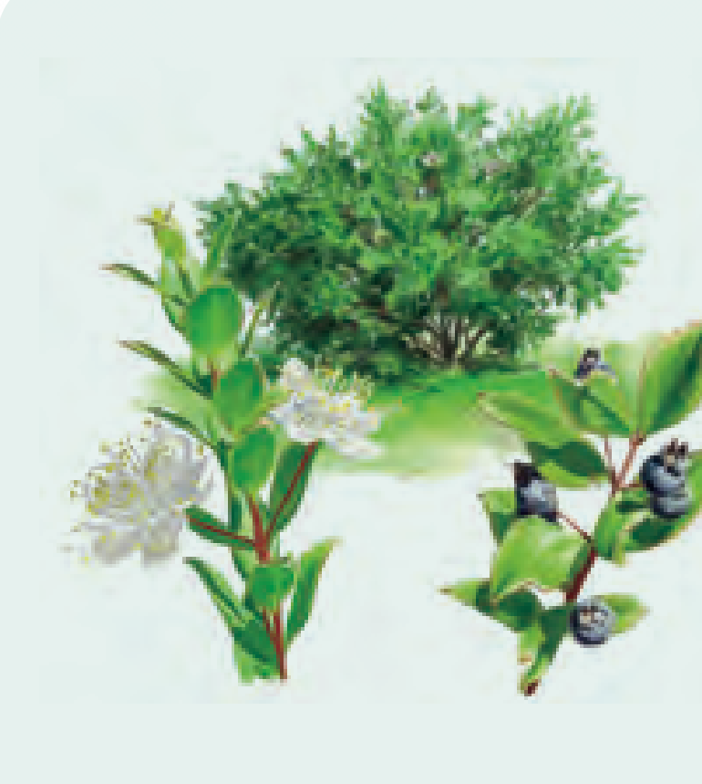
18 MIRTO Myrtus communis