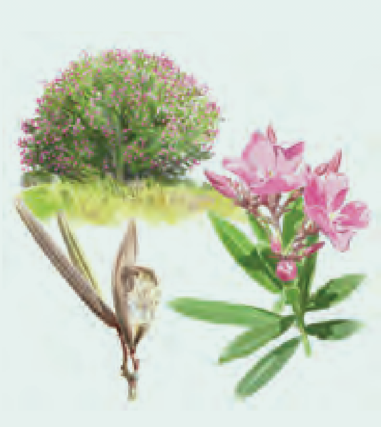
11 ADELFA Nerium oleander