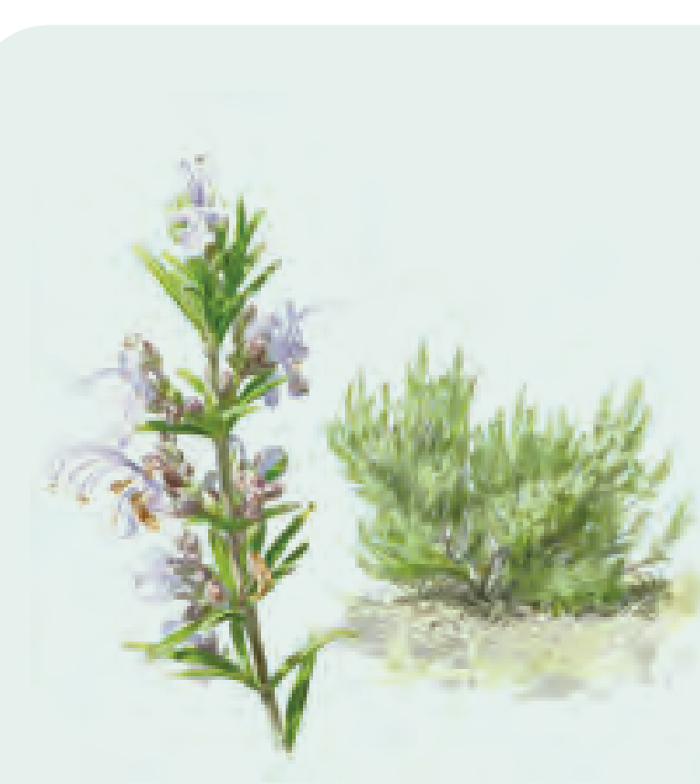
22 ROMERO Rosmarinus x lavandulaceus