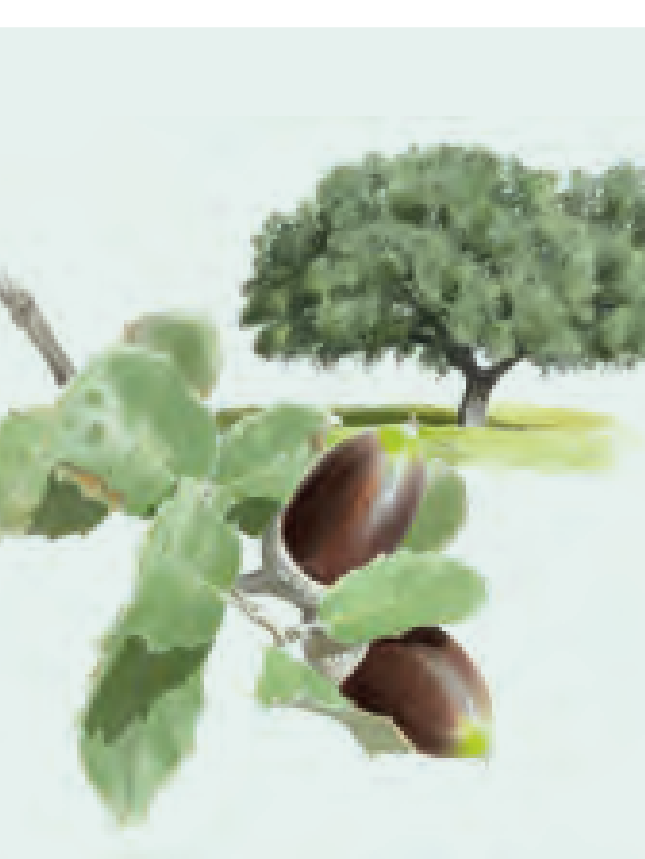
19 ENCINA Quercus ilex