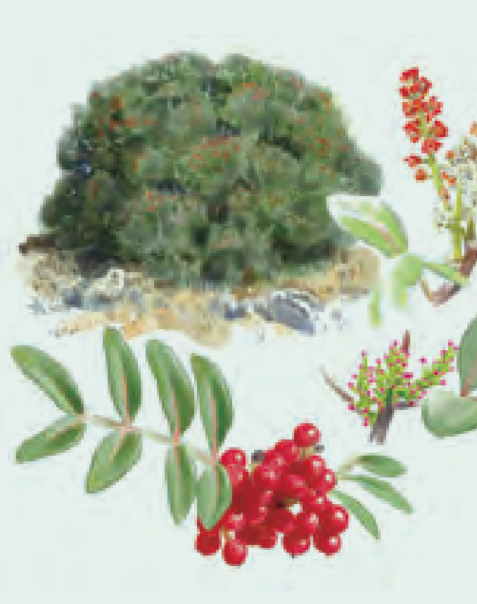
17 LENTISCO Pistacia lentiscus