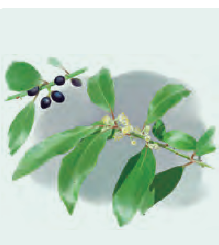
20 LAUREL Laurus nobilis