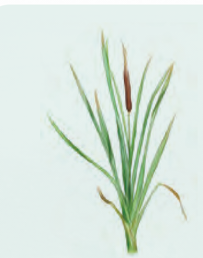
35 ENEA Typha dominguensis