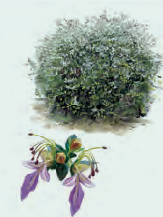
10 OLIVILLA Teucrium fruticans