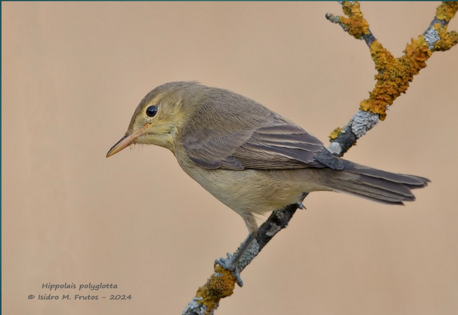
Hippolais polyglotta

Zarcero polígloa ( Hippolais polyglotta )