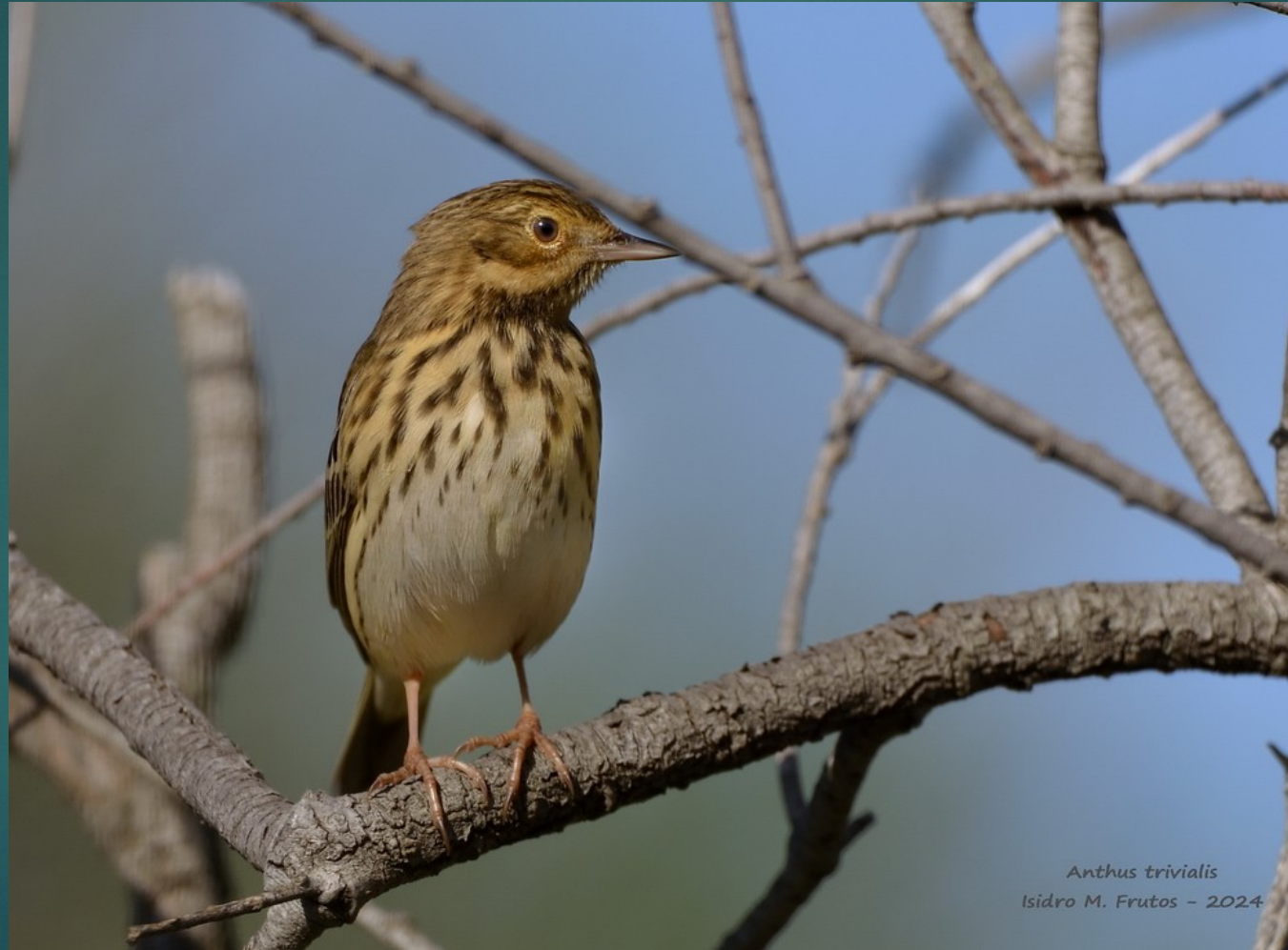
Anthus trivialis Isidro M. Frutos - 2024