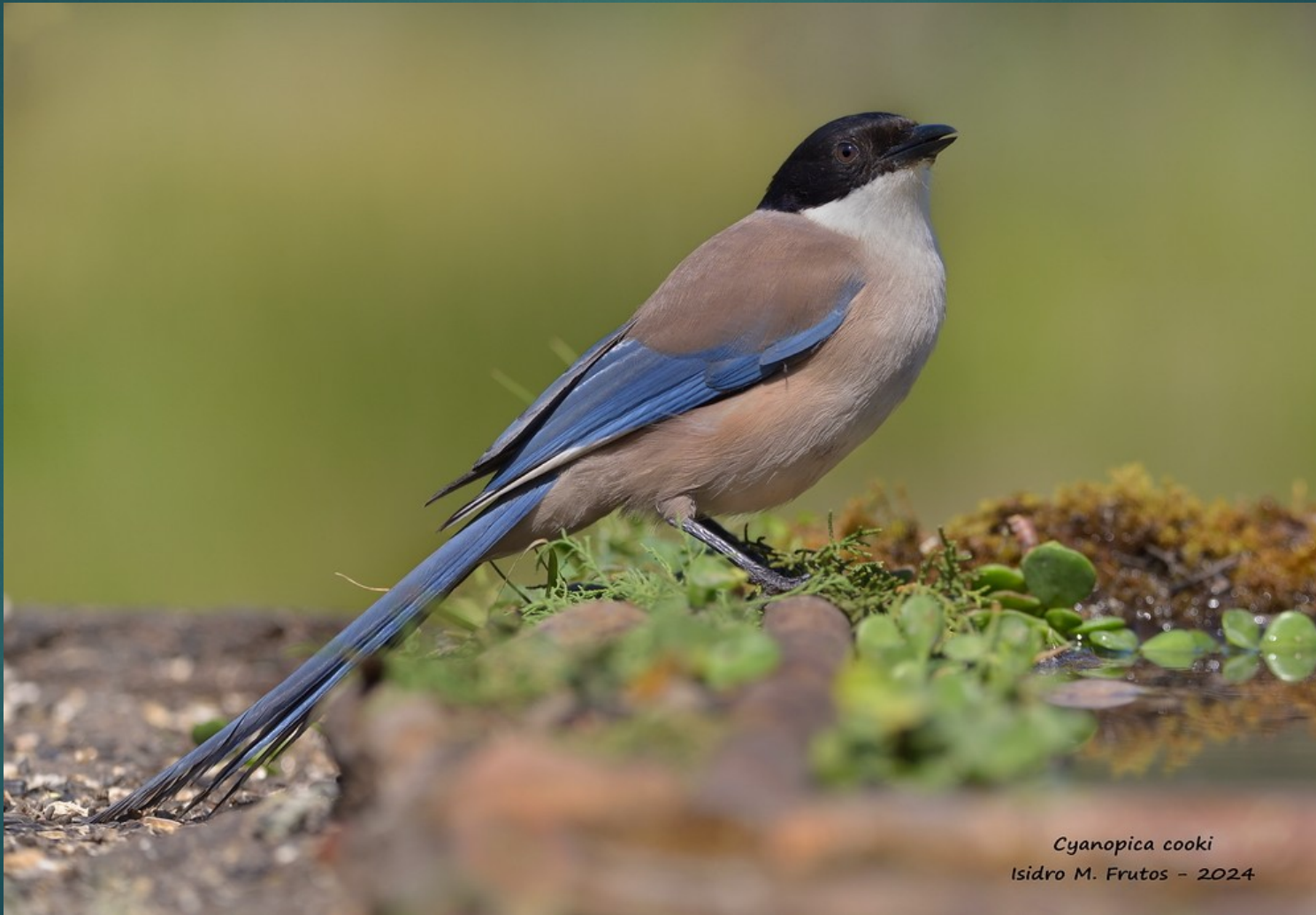
Cyanopica cooki Isidro M. Frutos - 2024