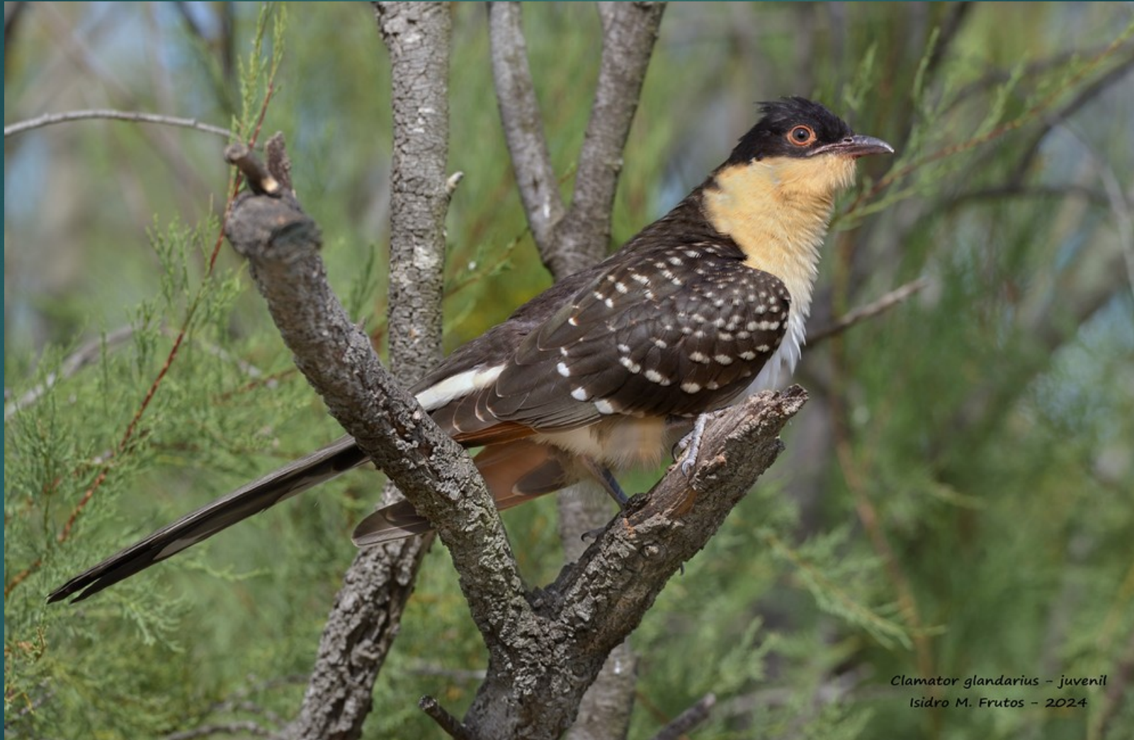
Clamator glandarius - juvenil Isidro M. Frutos - 2024