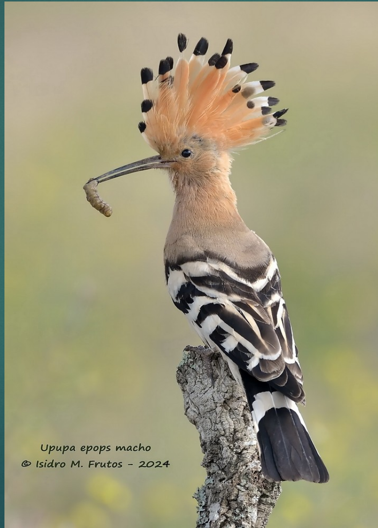
Upupa epops macho