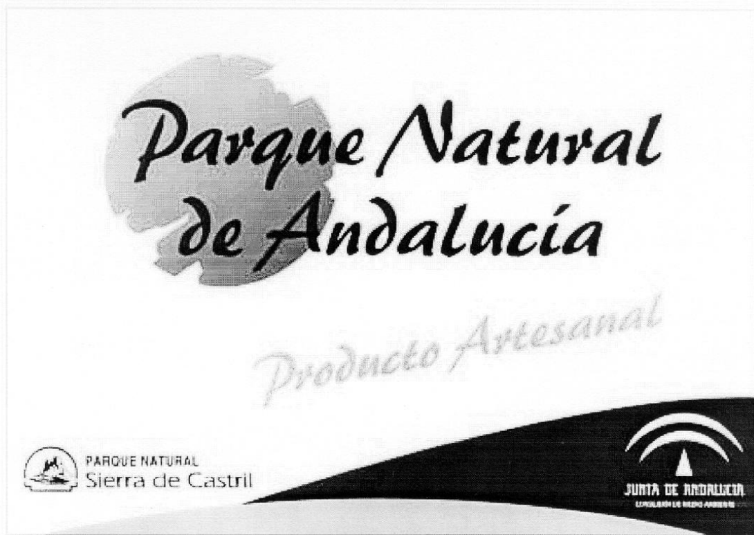
Placa de Establecimiento Producto Artesanal