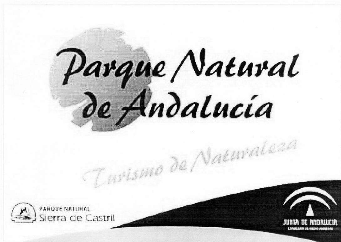
Placa de Establecimiento Turismo de Naturaleza