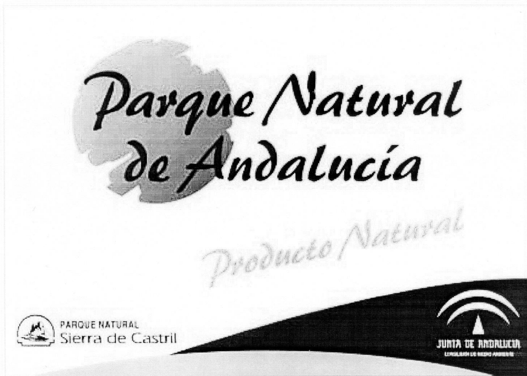
Placa de Establecimiento Producto Natural

El único elemento que puede ser reemplazado, en cualquiera de los tres modelos de plaza de establecimiento, es el logotipo del Parque Natural. Siempre respetando el tamaño y los colores aquí señalados.