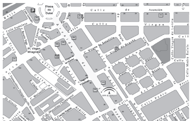
D.G. Inspección y Evaluación: Servicios y Unidades administrativas