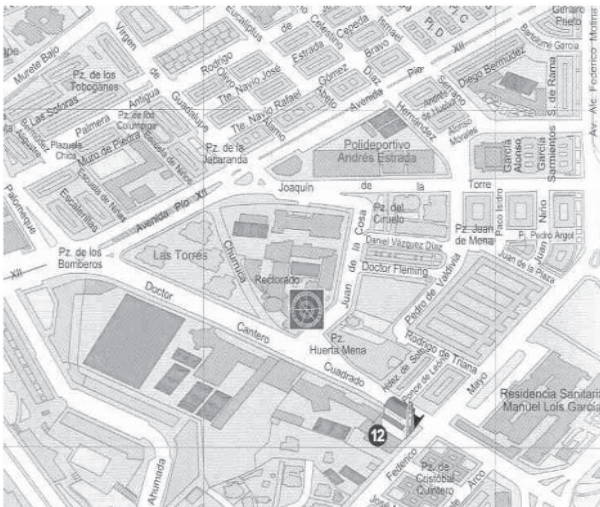
C/ Doctor Cantero Cuadrado