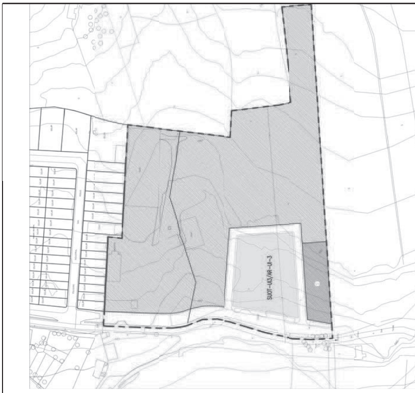
Situación y ordenación

Objetivos y determinaciones de ordenación detallada Ordenanzas: las determinadas en el Plan Parcial UI-3. Alineaciones y rasantes: las establecidas en el Plan Parcial UI-3. Altura y número de plantas: las expresadas en el Plan Parcial UI-3.