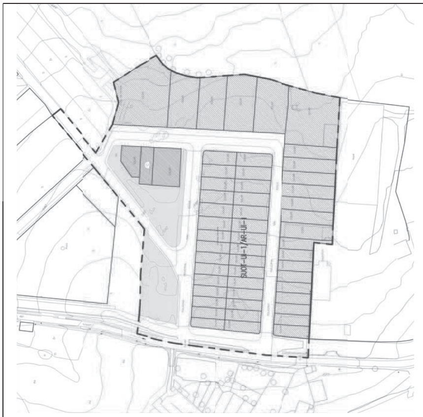
Situación y ordenación

Ordenanzas : las determinadas en el Plan Parcial UI-1. Alineaciones y rasantes : las establecidas en el Plan Parcial UI-1. Altura y número de plantas : las expresadas en el Plan Parcial UI-1.