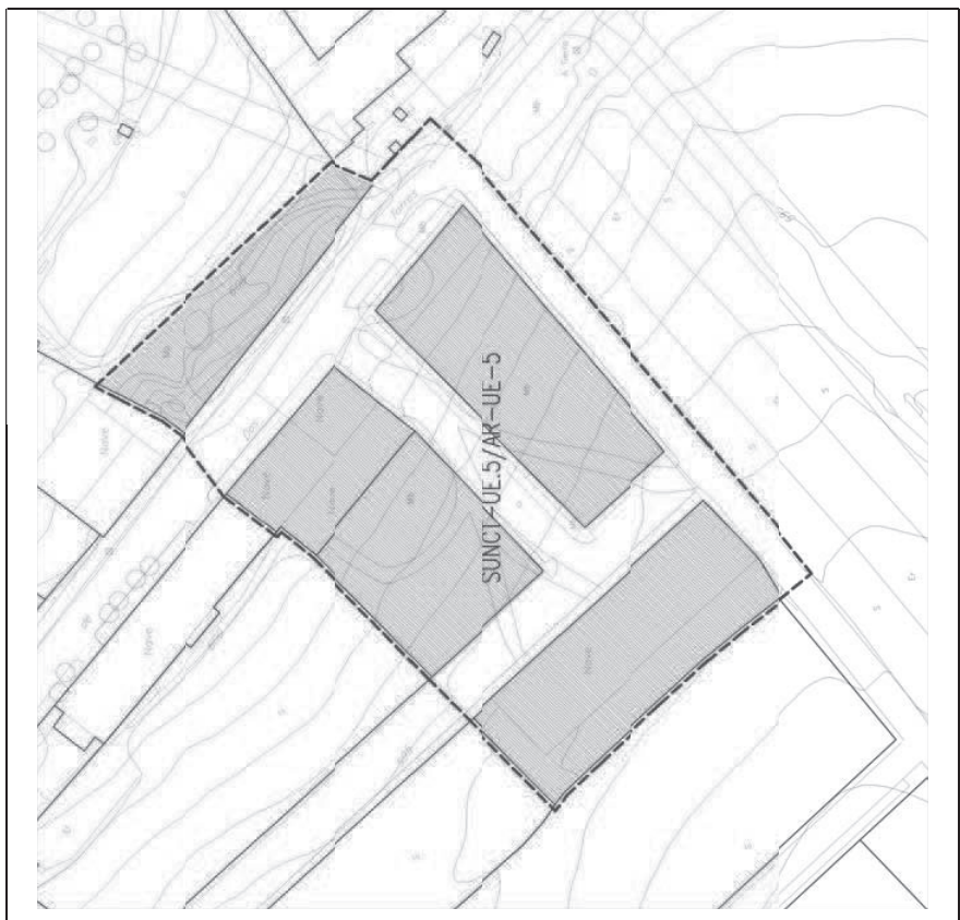
Situación y ordenación