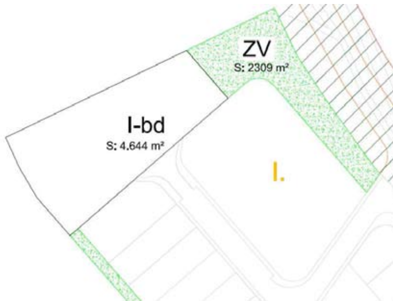
Esquema planimétrico sin escala