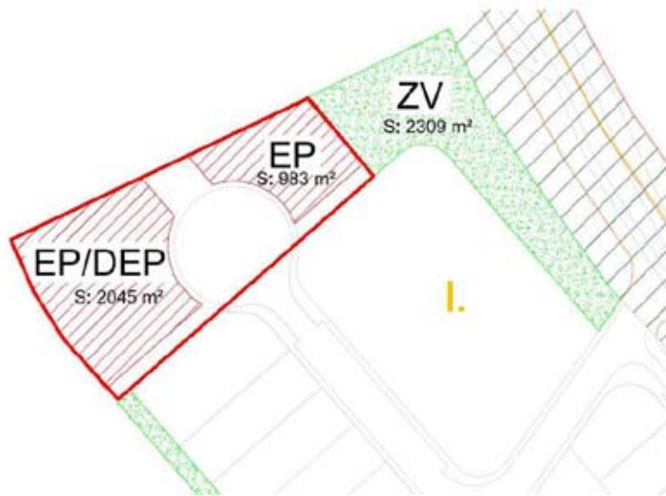
Esquema planimetrico sin escala