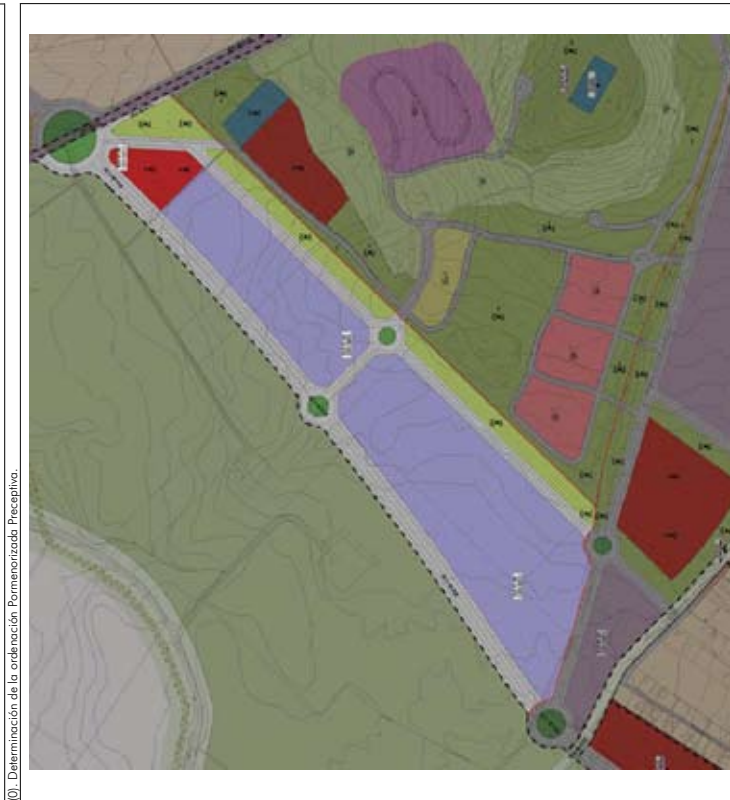
(1). Determinación de la ordenación Pormenorizada Preceptiva.