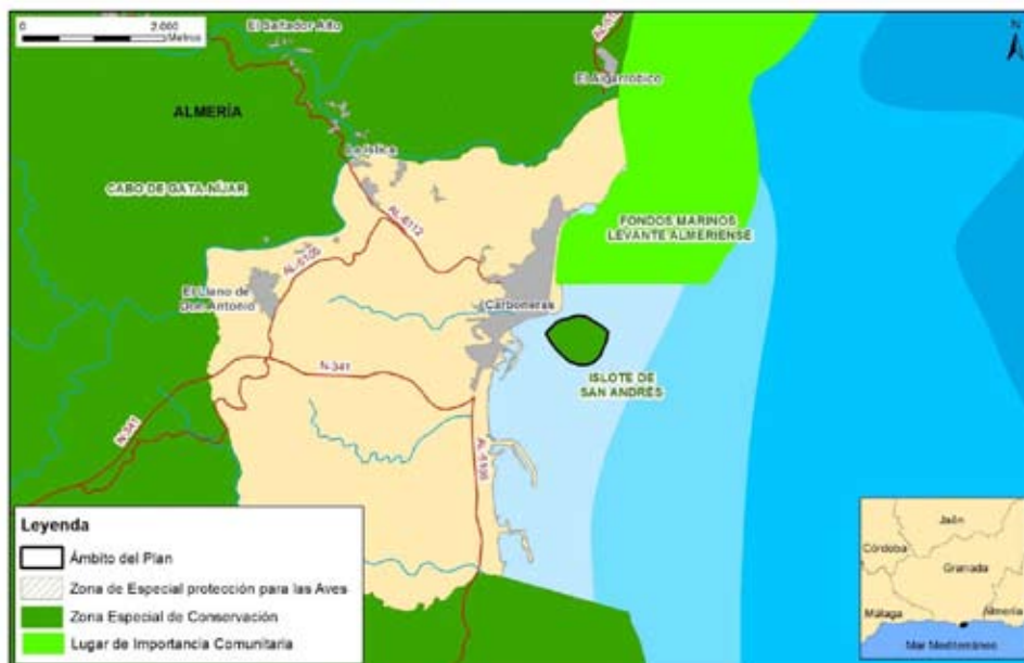
Figura 1. Localización

Aproximadamente el 3,6% de la superficie de la ZEC (1,26 ha) pertenece al término municipal de Carboneras (Sistema de Información Multiterritorial de Andalucía (SIMA). Instituto de Estadística y Cartografía de Andalucía. Consejería de Economía y Conocimiento, 2015).