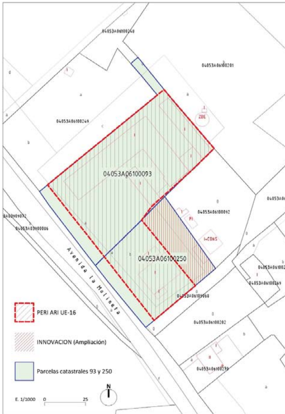
Plano catastral actualizado 2017. Parcelas catastrales 93 y 250 del polígono 61 de Huércal-Overa.

El terreno tiene una forma trapezoidal, está delimitado por los puntos georreferenciados en la Fig. 3 y una super-