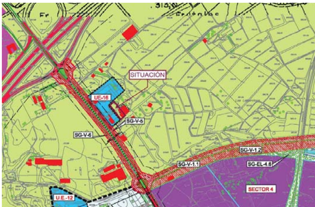
Fig. 1. Ordenación estructural del PGOU.

El ámbito de actuación esta modificación puntual del PGOU es un superficie de 975 m 2 de suelo no urbanizable situado junto a la Área de Reforma Interior UE 16, frente a la Carretera de Santa María de Nieva, en el acceso norte a Huércal-Overa, junto a la salida 553 de la Autovía del Mediterráneo.