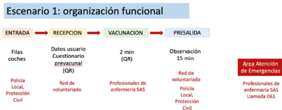
Figura 1. Organización funcional esquemática del Escenario 1