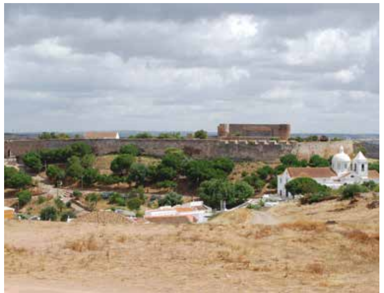
4. Castillo de Castro Marim