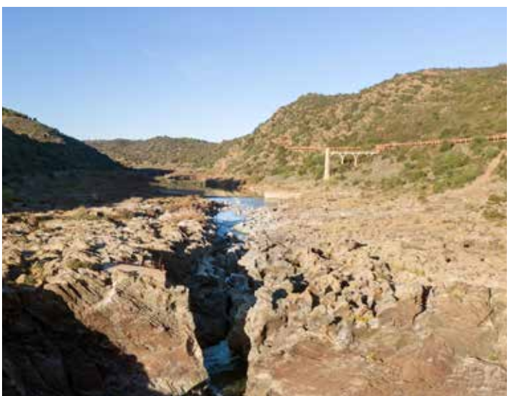
5. Pulo do Lobo