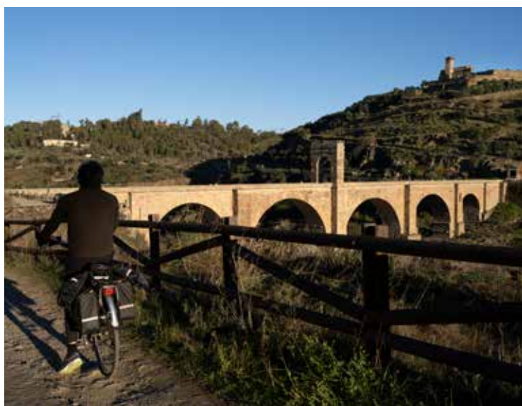
3. Puente de Alcántara