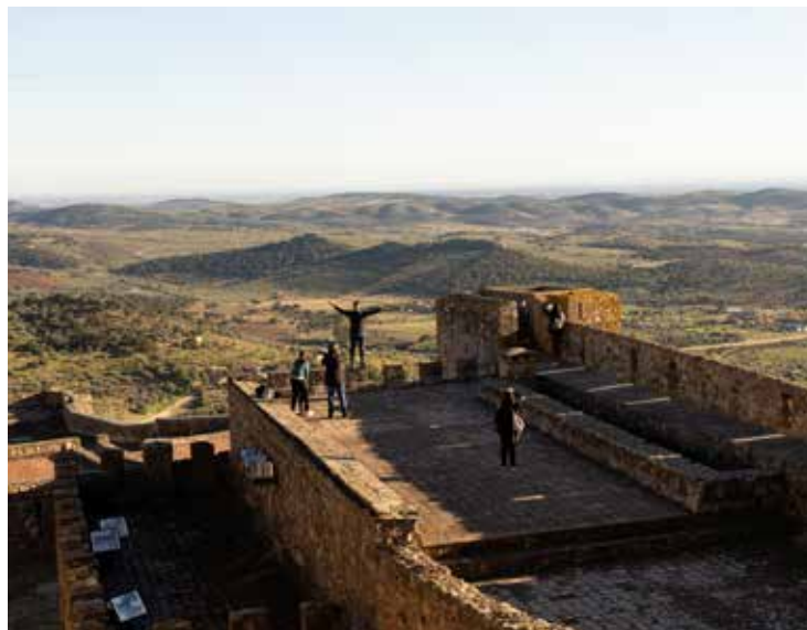
2. Castillo de Luna