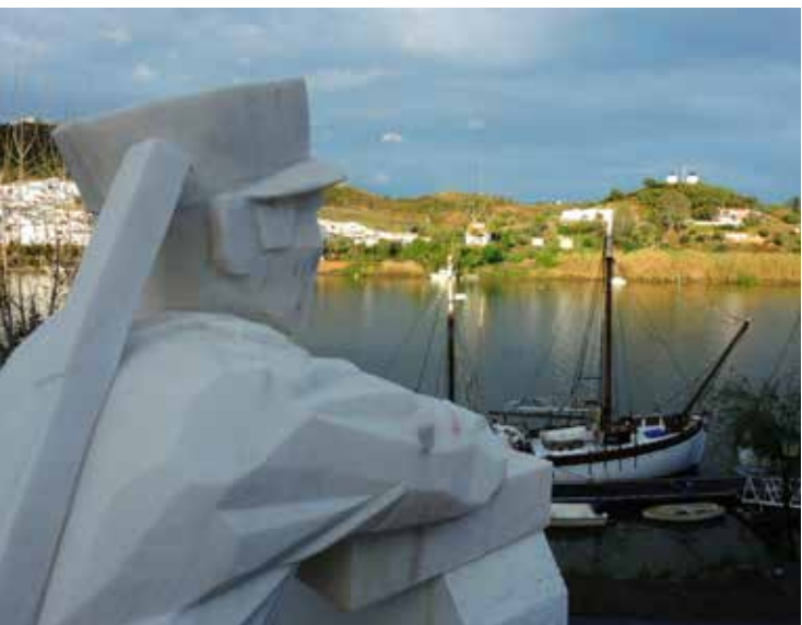
5. Villa Ribereña de Alcoutim