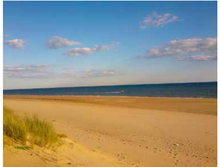
2. Paraje Natural Flecha y Marismas del Rompido