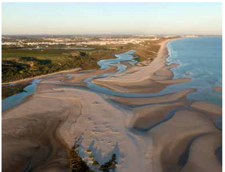
6. Núcleo Histórico de Cachelha Velha