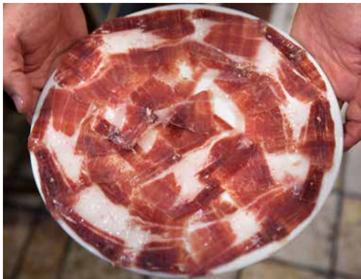
1. Ruta del Jamón Ibérico de Jabugo