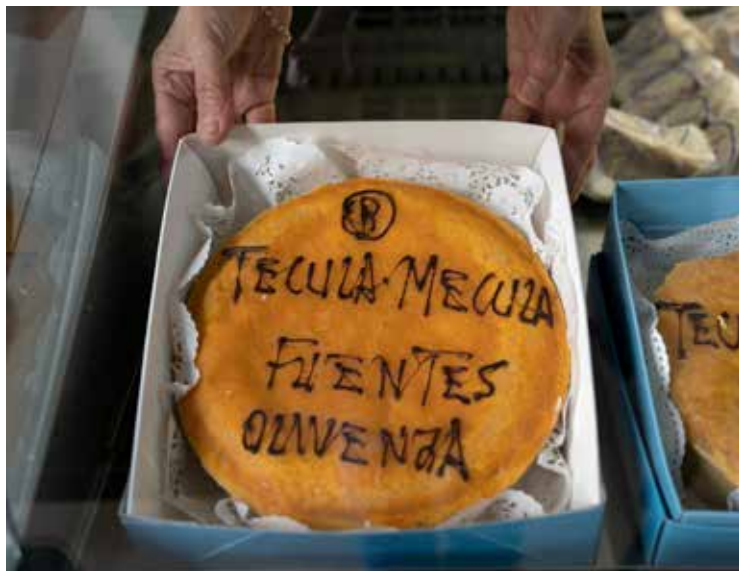
1. Técula Mécula