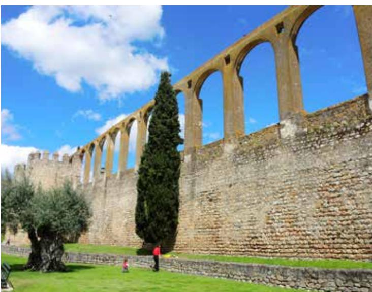
6. Villa de Serpa