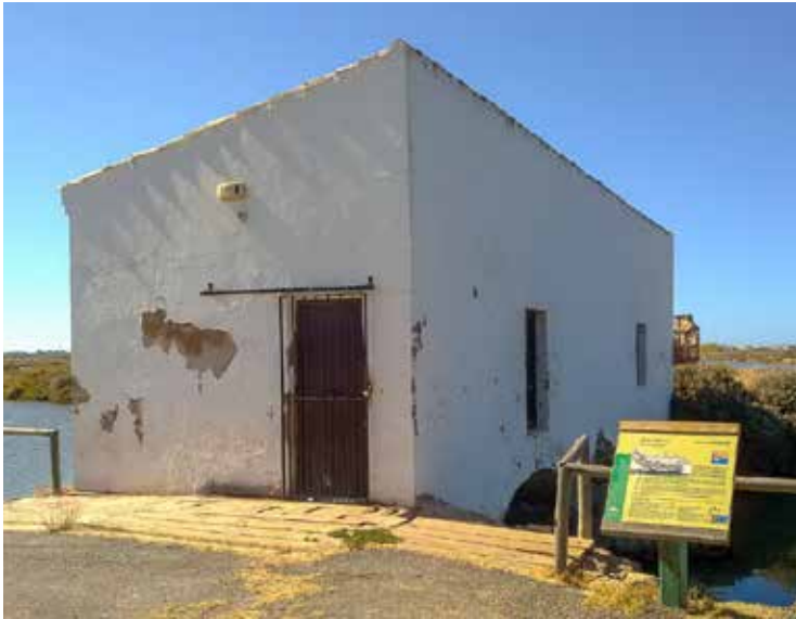
1. Ecomuseo Molino de Mareas El Pintado