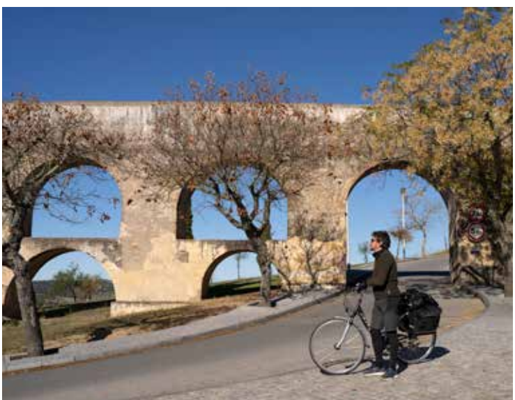
5. Acueducto de Amoreira