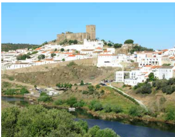
4. Campo Arqueológico de Mértola