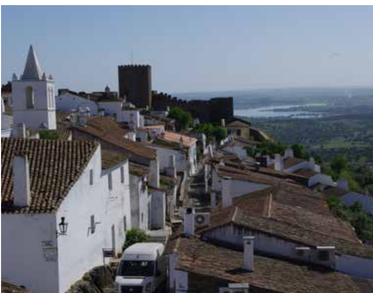
6. Villa Medieval de Monsaraz