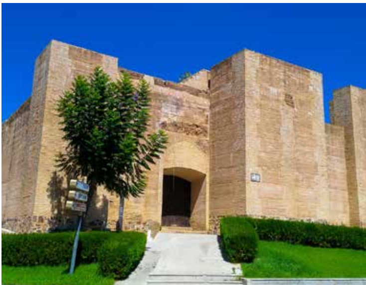
3. Castillo de los Zúñiga