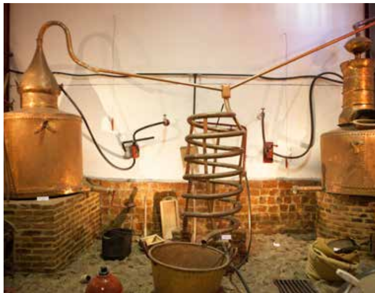
2. Anisados del Andévalo