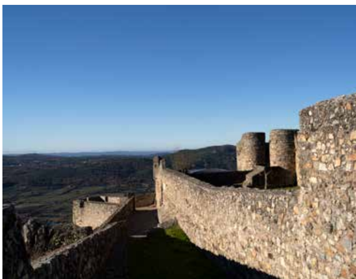
4. Villa de Marvão