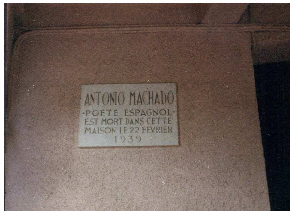
Fig. 3. Placa en recuerdo de Antonio Machado en Collioure (Francia). Dice: "ANTONIO MACHADO. Poeta español que falleció dentro de esta casa en Febrero de 1939." Archivo General de Andalucía. Consejería de Asuntos Sociales. Dirección General de Emigración. Signatura 2520.

Otra cuestión a dirimir fue la posible ubicación del futuro monumento. Se barajó que el lugar más idóneo debería estar relacionado con la infancia del poeta, como la plazuela del Palacio de las Dueñas. A la izquierda de dicho palacio se encuentra una zona sin puertas donde la colocación sería posible y el entorno plásticamente muy bello, alegaban los diseñadores del proyecto. Otros emplazamientos que se