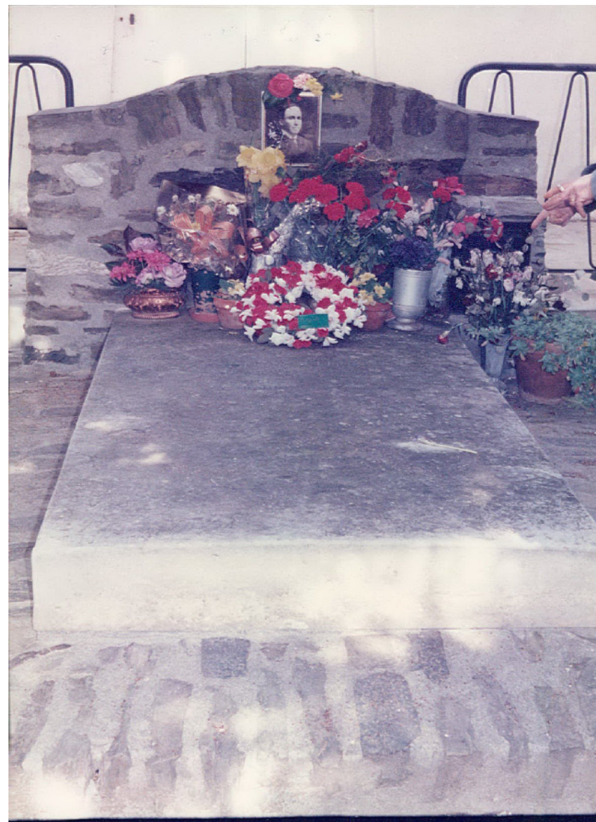
Fig. 2. Tumba de Antonio Machado en el pueblo de Collioure (Francia). Archivo General de Andalucía. Consejería de Asuntos Sociales. Dirección General de Emigración. Signatura 2521.

Se cumplen ochenta años del fallecimiento de Antonio Machado cuando un gélido y, sobre todo amargo, mes de febrero de 1939 exhaló su último aliento en un pueblecito del sur de Francia (Collioure), pocos días después de cruzar la frontera. Miles y miles de españoles intentaban salvar la vida, en condiciones adversas, buscando refugio y protección. El 22 de enero de 1939, y ante la inminente ocupación de la ciudad, el poeta y su familia salieron de Barcelona en un vehículo de la Dirección de Sanidad. La última noche en España, la del 26 al 27 de enero de 1939, la pasó Machado en Viladasens (Gerona), antes de cruzar a pie la frontera con Francia. El dramatismo de estos momentos es indescriptible puesto que cientos de personas se agolpaban en los caminos, expuestos a las inclemencias meteorológicas (lluvia, nieve, frío,...), desesperados por llegar a la aduana francesa. Machado, con sus acompañantes, se trasladaron a Collioure donde murió el poeta el 22 de febrero de 1939. Tres días más tarde lo haría su madre, Ana Ruiz, compungida de dolor ante la pérdida de su hijo Antonio.