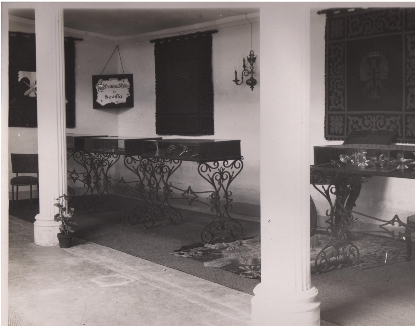
Fig. 3. Puesto de la Pirrotecna Militar de Sevilla en la XXIII Feria Muestrario Internacional. Dirección General de Industria y Material del Ejército. Valencia.1945. Archivo General de Andalucía. Fondo Fábrica de Artillería de Sevilla (F.A.S.) Signatura Planero 5.Cajón 5.3. A3MOD1E28B5-AP3P5CJ3.Foto 13.