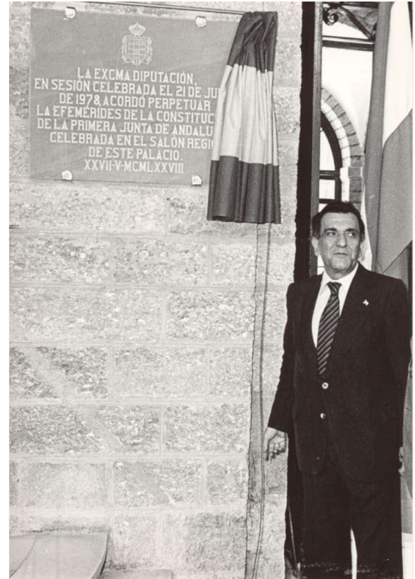
Fig. 3. Plácido Fernández Viagas, primer Presidente de la Junta de Andalucía, descubre, en la Diputación Provincial de Cádiz, una placa conmemorativa de la Primera Junta de Andalucía (27/05/1978).AGA.Colección Portavoz del Gobierno,Nº94)

En Granada se celebró la segunda sesión de trabajo de la ponencia encargada de la redacción del Estatuto de Autonomía. En esta reunión se se planteó sin ningún tipo de ambages la disyuntiva entre "región" o "nacionalidad", decantándose los ponentes por el término intermedio de "Comunidad Autónoma". Otros asuntos tratados fueron la división territorial, las sedes de las instituciones o la futura pertenencia de Gibraltar a la Comunidad Autónoma.