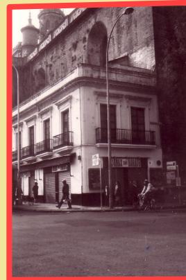
La fotografía corresponde a la fachada de una casa adosada a Iglesia de la Anunciación. Pertenece al Proyecto de obra de reforma en Plaza de la Encarnación nº 1. Año 1983 (Código de referencia: AHPSE / Comisión Provincial de Patrimonio Histórico / Signatura 19295/4)