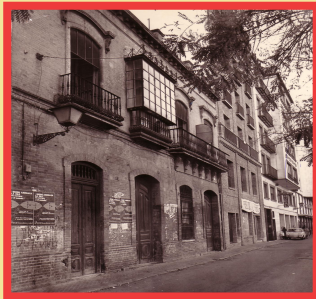
Fotografía de fachada de casa en Plaza de la Encarnación, nº 17. En Proyecto oficinas y local comercial en Plaza de la Encarnación, nº 17. Año 1978. (Código de referencia: AHPSE / Comisión Provincial de Patrimonio Histórico / Signatura 23494/342)

La Comisión Provincial de Patrimonio Histórico de Sevilla , con sus antecedentes en las Comisiones Provinciales de Monumentos, es un órgano consultivo de apoyo en materia de patrimonio histórico de la provincia; en el Archivo Histórico se conservan los expedientes de sesiones de esta Comisión. De estos expedientes hemos podido seleccionar cinco fotografías pertenecientes a proyectos de obras del entorno de la Plaza de la Encarnación, de los años 70-80, sobre los que la Comisión ha tenido que pronunciarse.