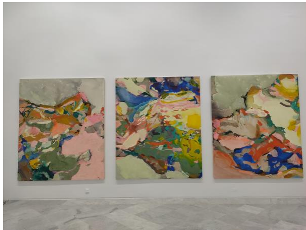
9 - Bajo el viento oceánico, Rachel Carson I, II y III, 2022

Las manecillas de dos relojes sin marco, números, ni adornos giran sincronizados uno hacia adelante y el otro hacia atrás de modo que uno avanza en el tiempo y el otro retrocede. Podría parecer que este dueto de relojes enfrentados como ante el espejo, nos condujera a un presente infinito o quizá a un instante cero. Un tiempo sitiado, confinado, inespecífico y desconocido. Un tiempo para la reflexión del presente y el futuro.