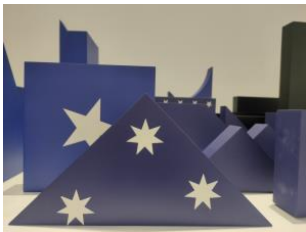
2 - El gran puzzle, 2019

En esta vídeo animación observaremos manchas de color que irán construyendo un mapa en el que en principio no reconoceremos los países pero poco a poco los límites y fronteras de los países nos serán familiares. Con una duración de 41 minutos en esta obra se pueden observar los cambios que en los mapas se han sucedido desde el año 500 antes de Cristo hasta el año 2007 a razón de un año por segundo. Estos cambios se deben a las sucesivas guerras, tratados, expansiones o invasiones de los territorios. Sin referencias a los datos históricos esta es una representación visual de los cambios en el mundo a consecuencia de la ambición de poder del ser humano.