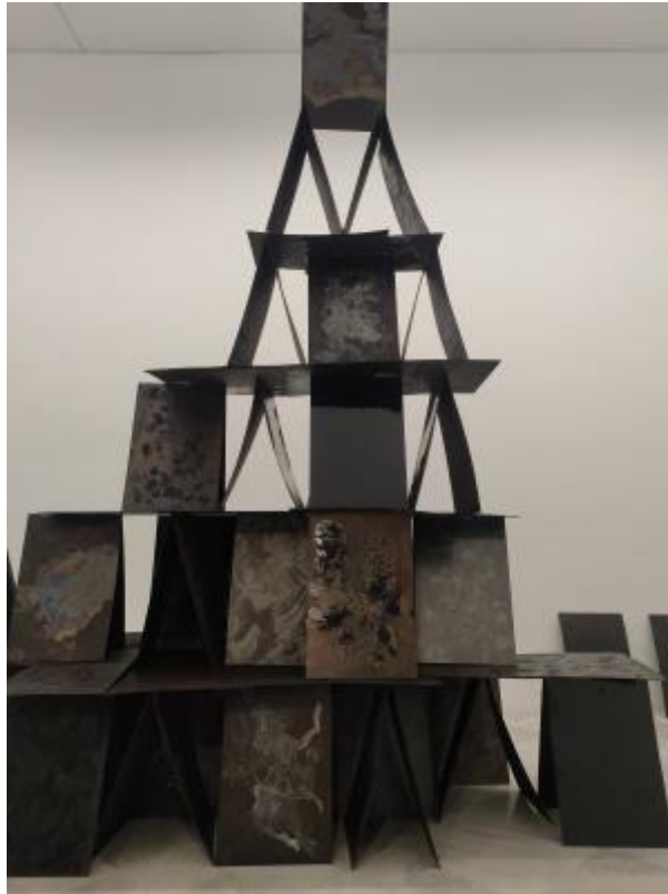
13 - Jetztzeit Behausung , 2021 La morada del tiempo-ahora

Una construcción en forma de castillo de naipes sirve como metáfora de la situación ambiental del mundo. Los naipes contruidos con todo tipo de combustibles fósiles y sus derivados petroquímicos se mantienen en un delicado equilibrio. Un castillo de naipes que representa "el progreso» y todas sus ambiciones pero a partir de ahí, quedará en las manos del destino o de un soplo que derrumbará tan efímera construcción metáfora del tiempo en que vivimos.