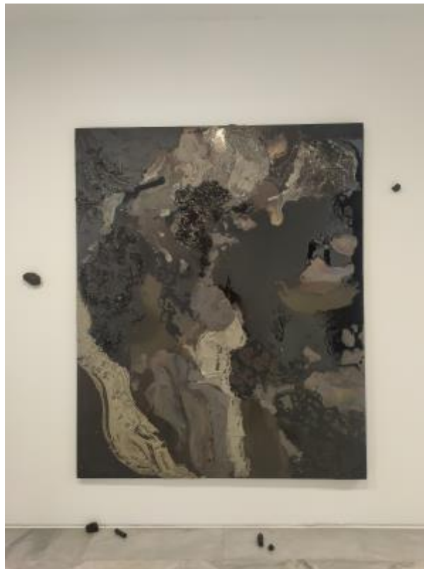
10 - Noche oscura, 2022 Tarde oscura, 2022 Resuena en la oscuridad, 2022 Serie Ancestros

En esta serie de trabajos el material con el que están realizados es clave para comprender el mensaje. Todos los tonos negros que componen estas obras provienen del uso de combustibles fósiles, de sus derivados o de plantas carbonizadas ; negro de humo, negro de marfil, negro de gas, pez negra, betún, parafina, hollín, negro de vid, negro de bujía, carbón activado, hulla, lignito, antracita, turba, fibra de carbono, grafito, grafeno, petróleo crudo, polímeros derivados del petróleo, queroseno y gasolina. Todos ellos seres que una vez estuvieron vivos que, en realidad son nuestros ancestros. Situados frente a ellos como en un espejo nos reflejamos, llevándonos a reflexionar acerca de la destrucción de ese pasado ancestral, de la contaminación del entorno, de las posibilidades de la vida en el presente y en el futuro.