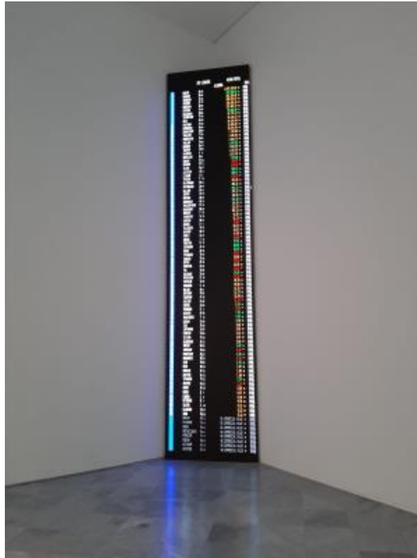
12 - Orden elemental, 2016

«El pueblo que falta, una colectividad futura aún por venir que posee una cohesión y funcionalidad genuinas» –es decir, ser el catalizador de un tipo de comunidad que aún no existe, con una fuerza sincera y un propósito colectivo orientados hacia una existencia sostenible.