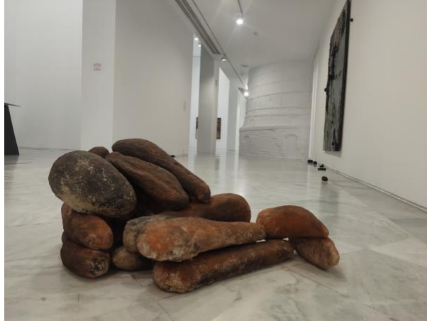
3 - Sag-giga, 2022

Dos materias primas como el barro y el carbón que encontraremos en sala han sido fundamentales para el desarrollo de las civilizaciones, desde la construcción de ciudades a la cacharrería para almacenar alimentos, desde la escritura a la creencia en diferentes religiones de que la primera persona sobre la tierra fue modelada en arcilla por los dioses. Esta obra es por tanto una metáfora del origen de la historia de las civilizaciones. No en vano su título alude a la forma en la que los sumerios, la primera sociedad agrícola y sedentaria, se llamaban a sí mismos y, por extensión, a toda la humanidad.