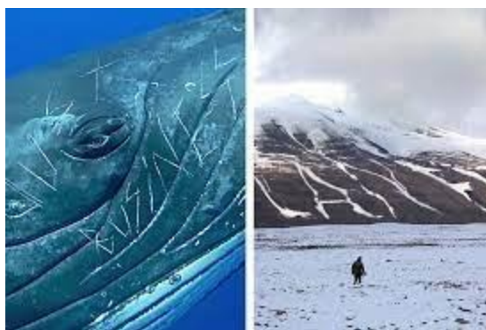
11 - El pueblo que falta, 2019

En esta serie de trabajos el material con el que están realizados es clave para comprender el mensaje. Todos los tonos negros que componen estas obras provienen del uso de combustibles fósiles, de sus derivados o de plantas carbonizadas ; negro de humo, negro de marfil, negro de gas, pez negra, betún, parafina, hollín, negro de vid, negro de bujía, carbón activado, hulla, lignito, antracita, turba, fibra de carbono, grafito, grafeno, petróleo crudo, polímeros derivados del petróleo, queroseno y gasolina. Todos ellos seres que una vez estuvieron vivos que, en realidad son nuestros ancestros. Situados frente a ellos como en un espejo nos reflejamos, llevándonos a reflexionar acerca de la destrucción de ese pasado ancestral, de la contaminación del entorno, de las posibilidades de la vida en el presente y en el futuro.