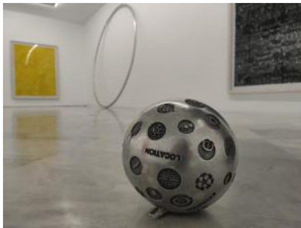
7 - Figuras, 2017

Estas pinturas monocromáticas son un ejemplo de cómo incluso los colores los clasificamos y ordenamos, les damos un valor con el que establecer códigos de comunicación, les asociamos emociones y sentimientos que hemos teorizado y estas teorías las usamos para crear obras de arte y diseños y a su vez para interpretarlas. Ver las obras de cerca nos permite reconocer en la monocromía diferentes marcas, logos y publicidad que reconocemos en la calle que forman parte de nuestras vidas y que definen en parte nuestro gusto y nuestra identidad, nuestra estética, costumbres alimenticias, etc.