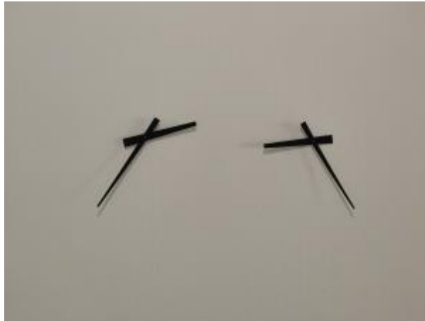
8 - Presente continuo, 2021

Las manecillas de dos relojes sin marco, números, ni adornos giran sincronizados uno hacia adelante y el otro hacia atrás de modo que uno avanza en el tiempo y el otro retrocede. Podría parecer que este dueto de relojes enfrentados como ante el espejo, nos condujera a un presente infinito o quizá a un instante cero. Un tiempo sitiado, confinado, inespecífico y desconocido. Un tiempo para la reflexión del presente y el futuro.