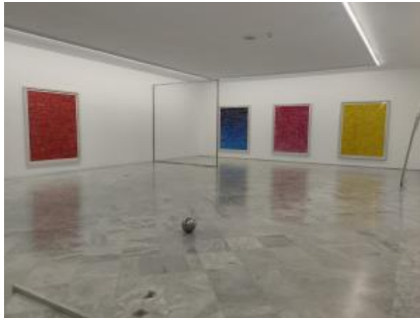
6 - Monocromos, 2016

Estas pinturas monocromáticas son un ejemplo de cómo incluso los colores los clasificamos y ordenamos, les damos un valor con el que establecer códigos de comunicación, les asociamos emociones y sentimientos que hemos teorizado y estas teorías las usamos para crear obras de arte y diseños y a su vez para interpretarlas. Ver las obras de cerca nos permite reconocer en la monocromía diferentes marcas, logos y publicidad que reconocemos en la calle que forman parte de nuestras vidas y que definen en parte nuestro gusto y nuestra identidad, nuestra estética, costumbres alimenticias, etc.