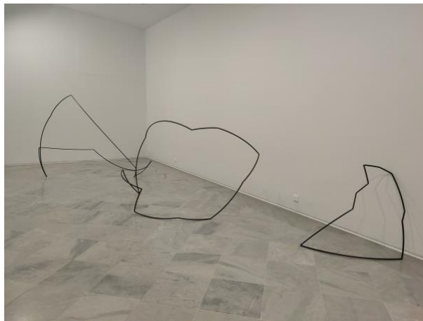
4 - Round around, 2022

Dos materias primas como el barro y el carbón que encontraremos en sala han sido fundamentales para el desarrollo de las civilizaciones, desde la construcción de ciudades a la cacharrería para almacenar alimentos, desde la escritura a la creencia en diferentes religiones de que la primera persona sobre la tierra fue modelada en arcilla por los dioses. Esta obra es por tanto una metáfora del origen de la historia de las civilizaciones. No en vano su título alude a la forma en la que los sumerios, la primera sociedad agrícola y sedentaria, se llamaban a sí mismos y, por extensión, a toda la humanidad.