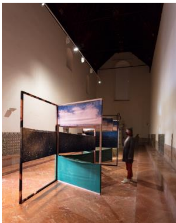
5 - BELÉN RODRÍGUEZ (Valladolid, España, 1981)