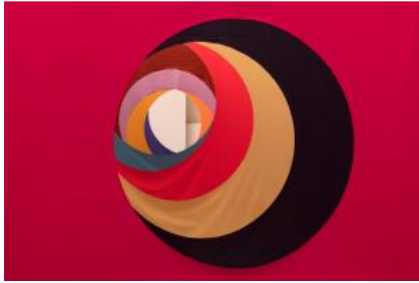
1 - ULLA VON BRANDENBURG (Karlsruhe, Alemania, 1974)