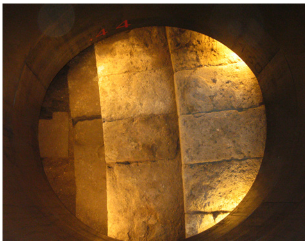
Gradins sous le Centre d'Accueil

Vers le milieu du II ème siècle de notre ère, l'édifice a été laissé à l'abandon et les matériaux nobles –les marbres et les bronzes– qui le décoraient ont été saccagés. Au milieu du V ème siècle de notre ère, on a commencé à constater le colmatage de la zone de l'orchestre et, par la suite, s'est produit le saccage des autres éléments de construction moins nobles et somptueux, principalement des pierres de taille.