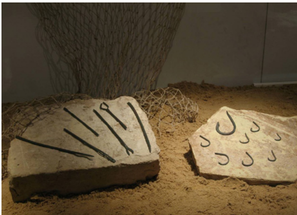
Outils exposés sur le site

Le patio est délimité, au nord, par une pièce de 14 x 19 m, orientée est-ouest, dans laquelle sont réparties, de manière plus ou moins régulière, de grands bassins. On peut distinguer, dans le pan de voûte, deux groupes, séparés par un large couloir central. Le premier serait composé de deux grands bassins, entourés de quatre autres moins importants, autant au nord qu'au sud. Le second groupe semble être formé d'un bassin aux dimensions plus importantes, situé dans la zone est et entouré de trois bassins au nord et deux à l'ouest. Tout cet espace occupé par des bassins a été, à l'époque, couvert par une toiture inclinée vers le patio, qui favorisait la collecte de l'eau afin de remplir la citerne. Sur le côté ouest du patio se trouvait une autre dépendance, de 6 x 9,5 m et perpendiculaire à la précédente, qui abritait huit autres bassins répartis en deux rangées de quatre. Ils présentent, par rapport au premier groupe, une régularité inférieure en ce qui concerne leur conception, leur tracé et leur construction et, de plus, elles ont été pratiquement détruites.