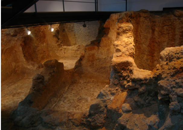
Détail des bassins

treillis d'un puits, fait du même type de roche, d'où était tirée l'eau collectée dans la citerne.