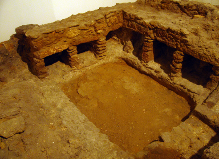
Vue de l'un des ensembles funéraires

en pierres de taille irrégulières calcaires, liées par du mortier de chaux et se trouve partiellement détruit par l'expropriation à laquelle ils ont été soumis à l'ancien temps. Des parts importantes de leurs composants essentiels sont néanmoins identifiables. Sur l'un de leurs principaux côtés se trouve le puits d'accès à l'intérieur de la chambre funéraire dans laquelle on trouve des niches funèbres de 0,35 x 0,45 m destinés à recevoir les urnes funéraires. Ces niches sont réparties de la manière suivante : une à côté du puits d'accès, trois en face et deux sur les côtés inférieurs de la chambre. L'ensemble était intégralement enduit de blanc et aucun reste de décoration picturale n'a été observé. Les murs, de moindre envergure, montrent le début d'une petite voûte en berceau qui servait de toiture.