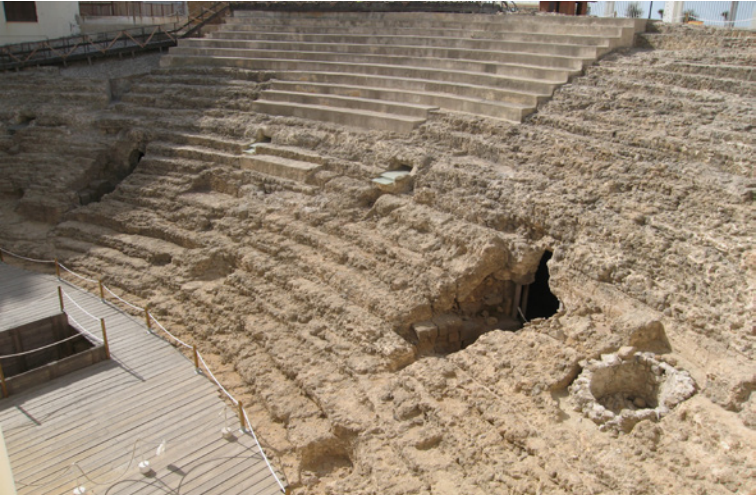
Vue générale des gradins

Sur la façade interne de la galerie ont été localisés quatre couloirs, situés à 20 m de distance, qui permettaient de se déplacer entre la galerie et les gradins. Entre deux vomitoires se situent deux lucarnes qui permettent à la lumière naturelle d'entrer dans la galerie, lesquels sont placés sur la rangée supérieure du mur de pierre.