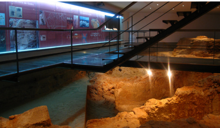
Vue générale des installations de l'Usine

Outre les canalisations mentionnées, d'autres structures étaient également disposées sur le sol du patio : un bassin de forme semi-sphérique revêtu de mortier de chaux et doté d'un godet central afin de permettre son nettoyage ; une structure de pierres de taille rectangulaires calcaires, qui encadrent le