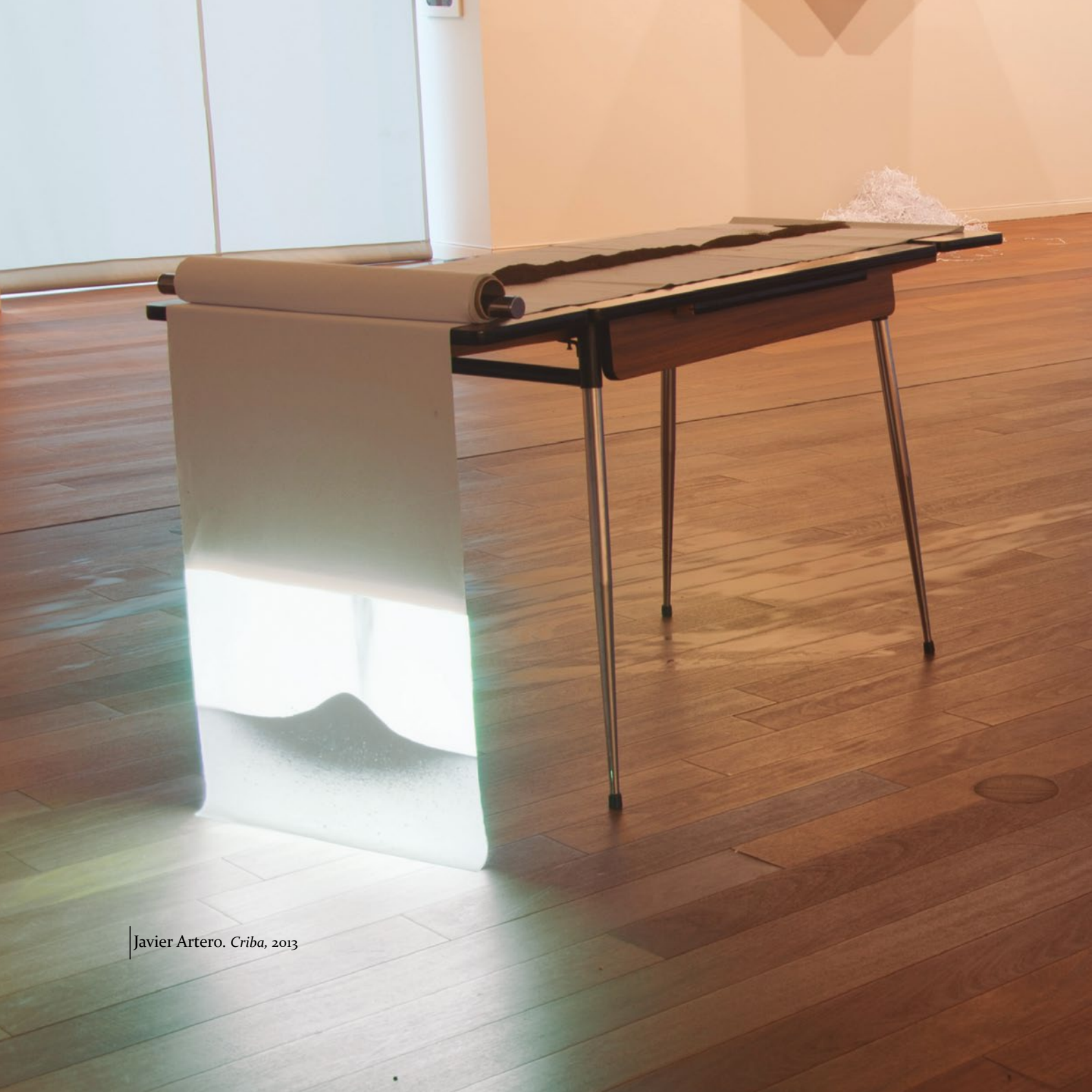
Javier Artero. Criba , 2013