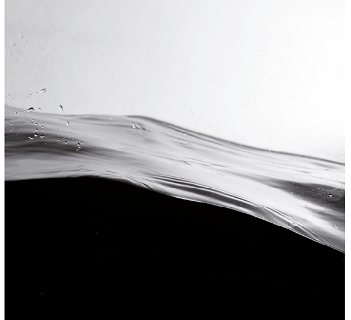
| Alba Moreno. Nódulo , 2013 (detalles)