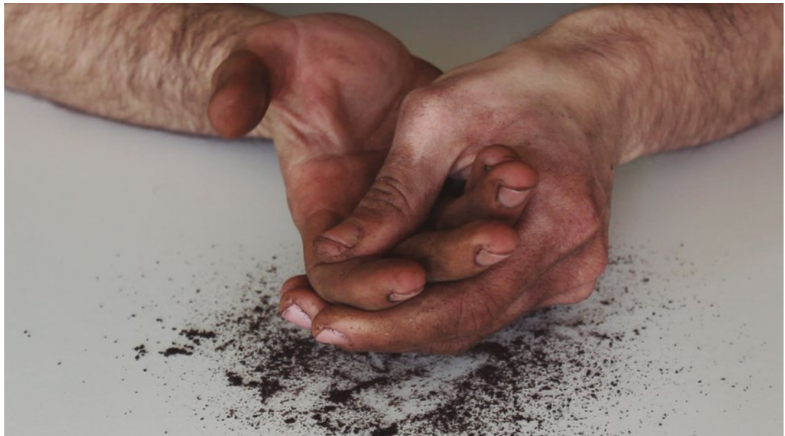
| Javier Artero. Bis al schluchtz , 2013