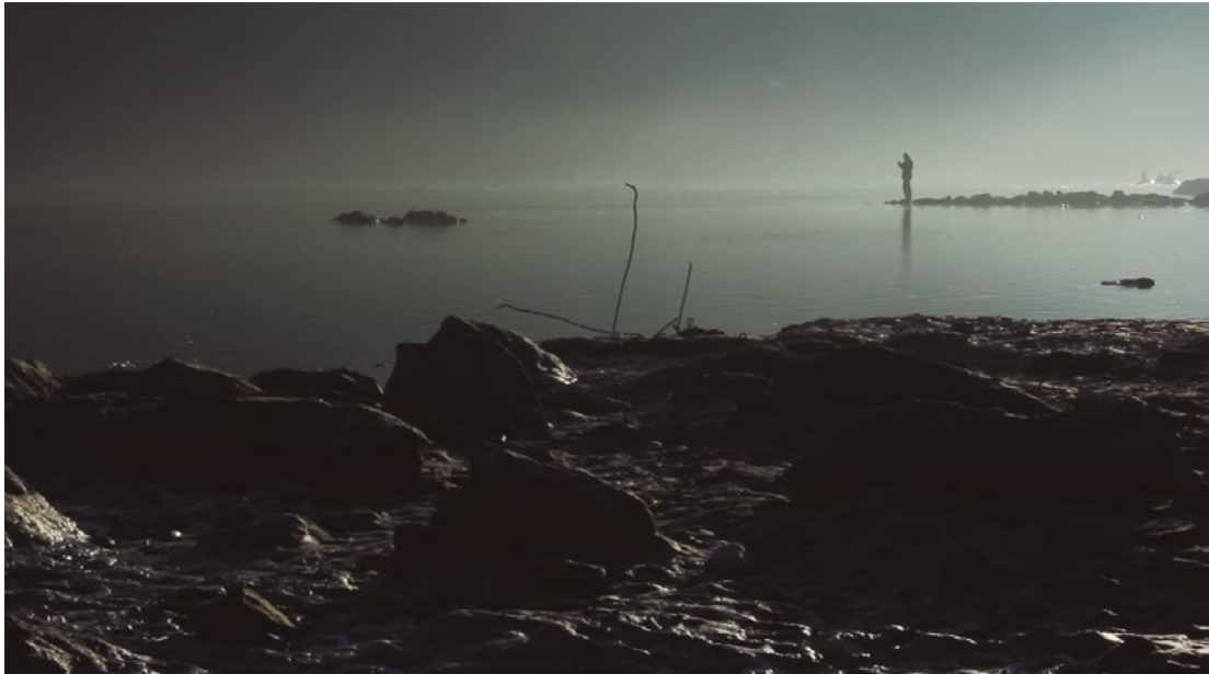
| Javier Artero. El caminante sobre el río de niebla , 2013