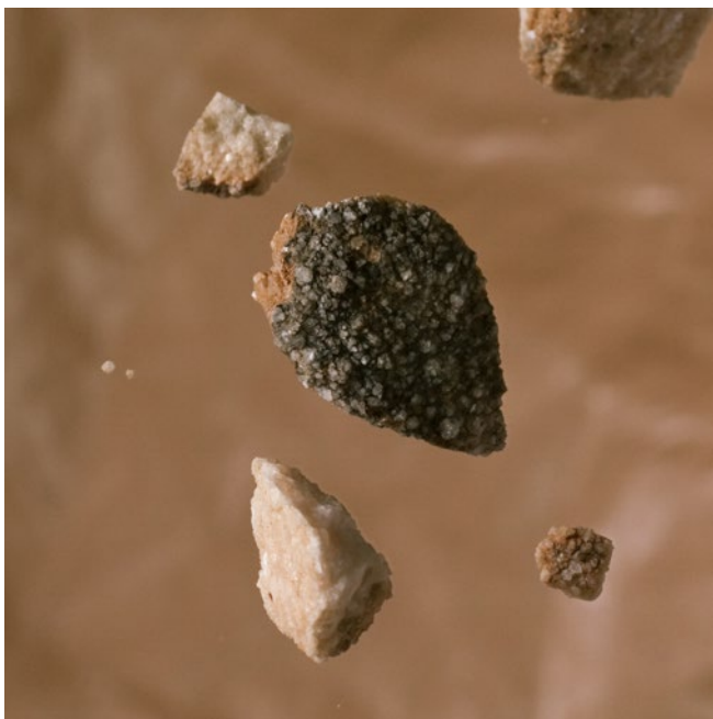
Eva Grau. La templanza como destrucción del ego , 2012