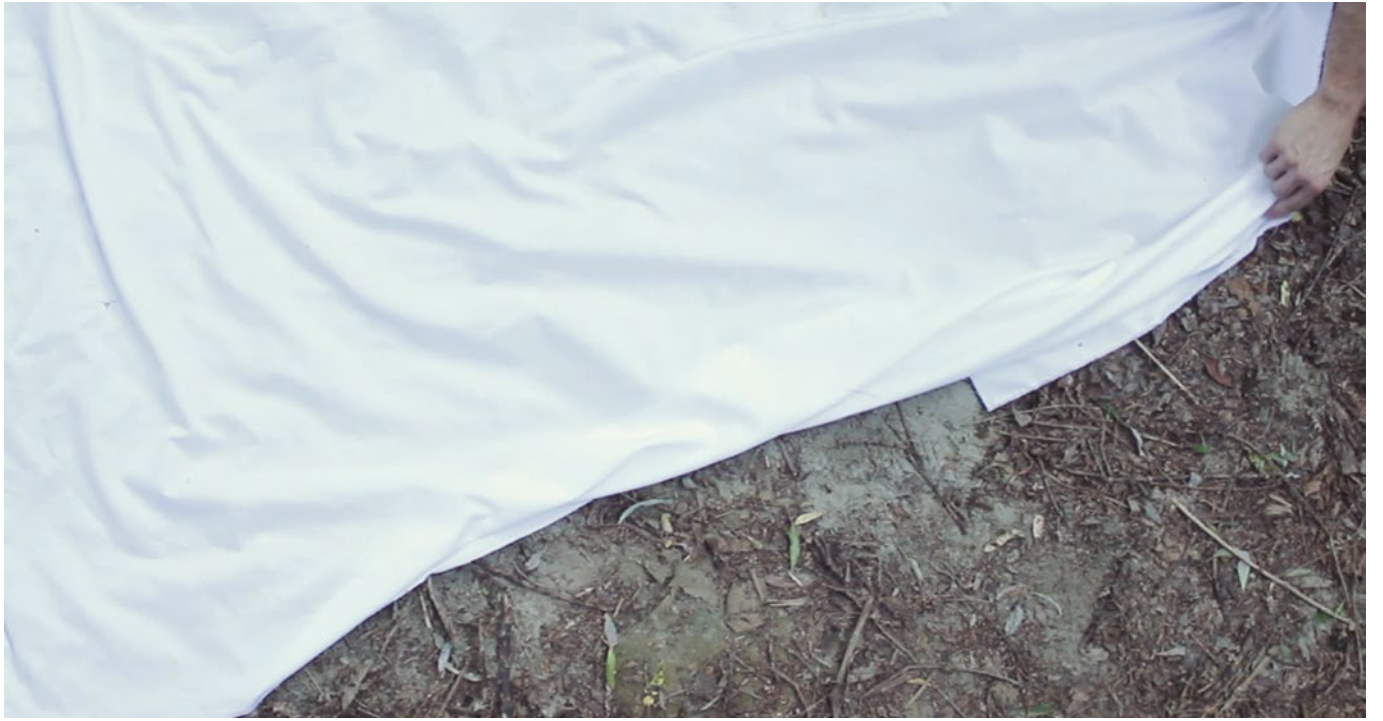
| Javier Artero. Sin título , 2013