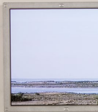
| Javier Artero, Eva Grau y Alba Moreno. Tres estados , 2013