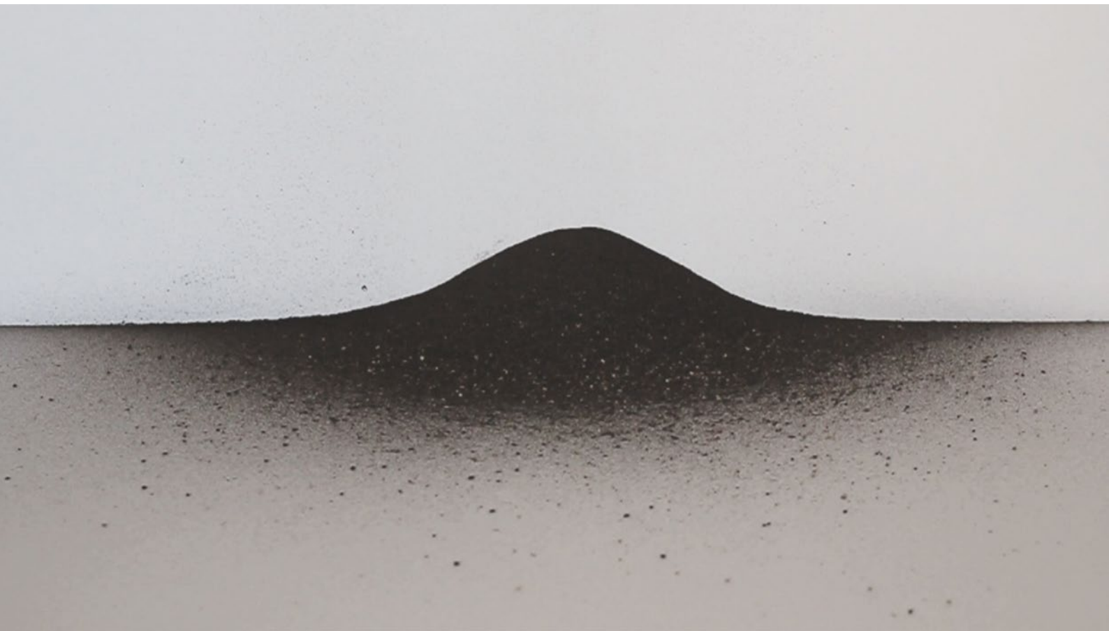
| Javier Artero. Criba , 2013 (detalles)