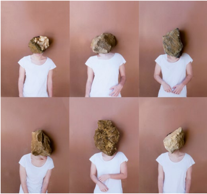
Eva Grau. Estudio de tiempo I. Las trincheras de lo abrupto , 2012