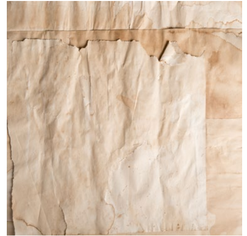
| Alba Moreno. Composición de pieles , 2012 (de izquierda a derecha: Piel1 , Piel2 y Piel3 )