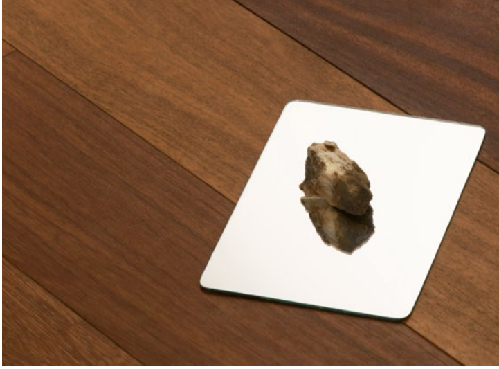
Eva Grau. Autorretrato con linde de la serie La redención de los hijos de Caín , 2013