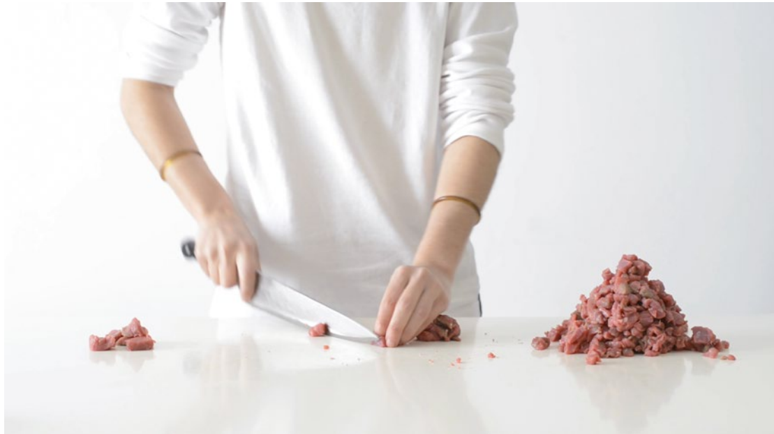
|Eva Grau y Alba Moreno. Naturalezas , 2013