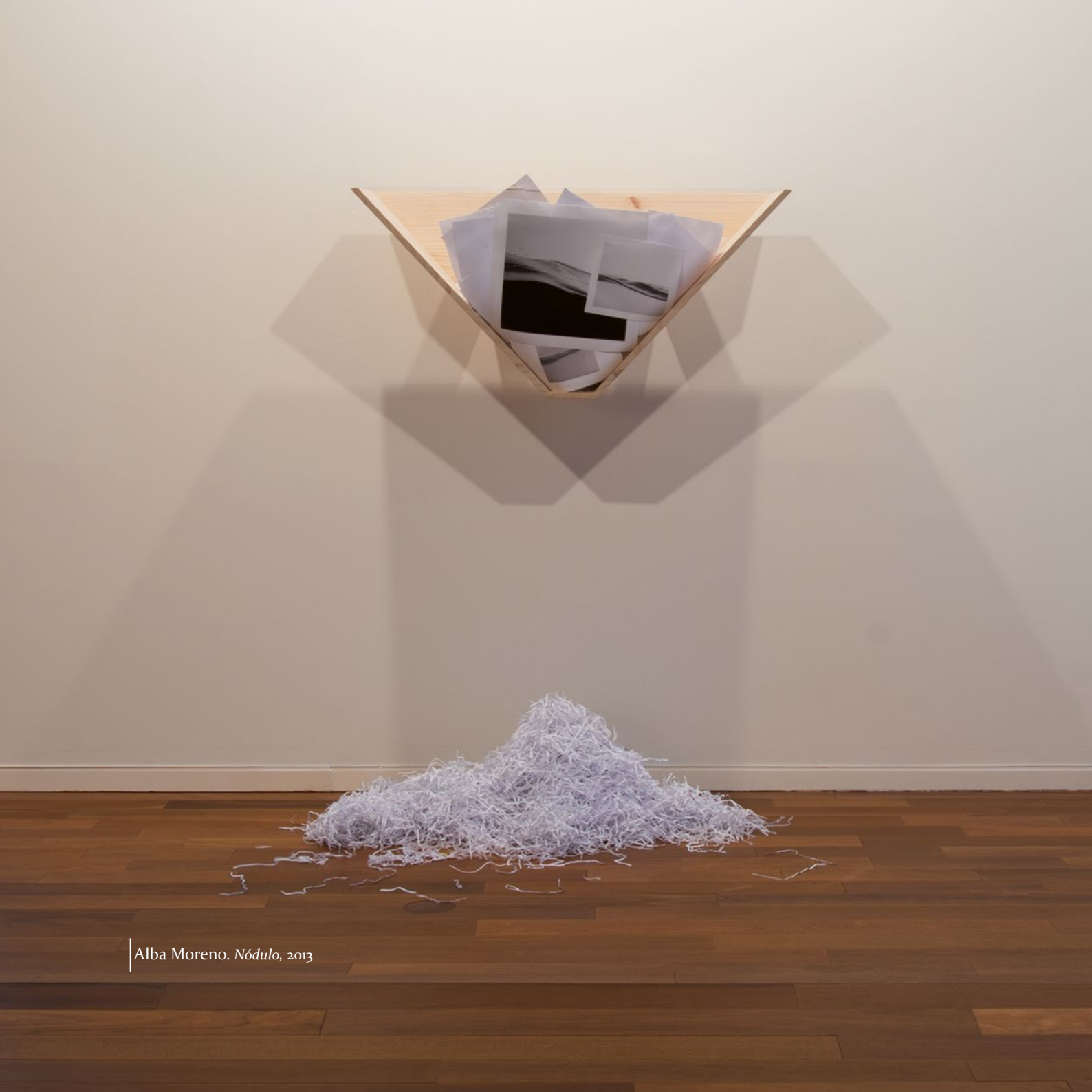
Alba Moreno. Nódulo , 2013