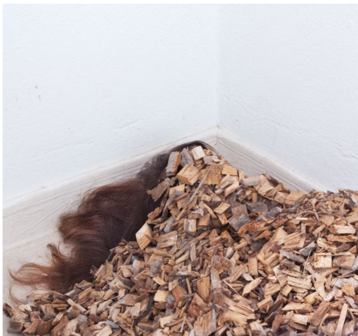
Eva Grau. El pésame no exime del cargo , 2012