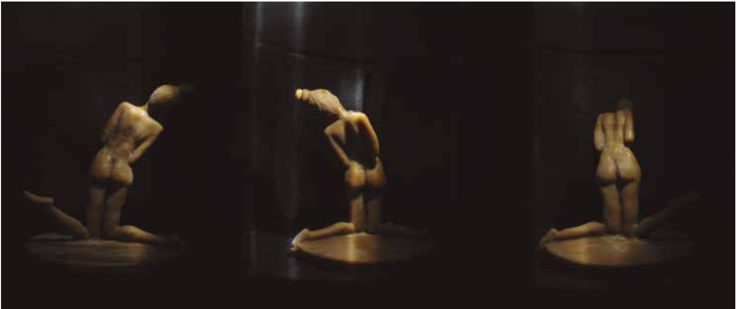
Prueba de fuego V. Vistas de la escultura a través del zootropo.