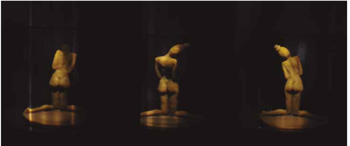
Prueba de fuego VII. Vistas de la escultura a través del zootropo.