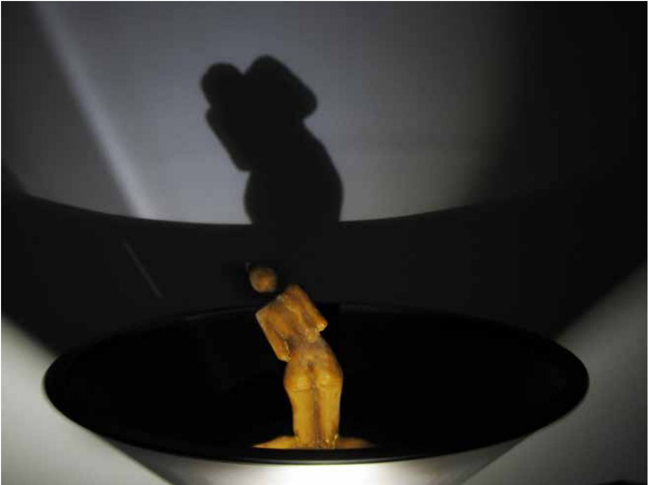
Prueba de fuego VI. Vista de la escultura en el estroboscopio