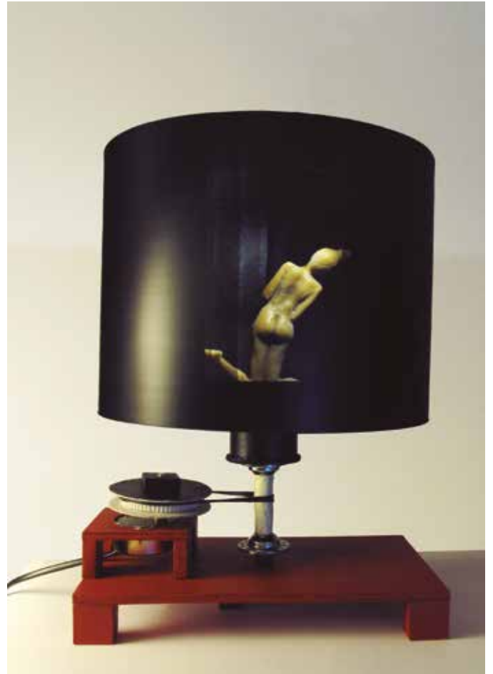
Prueba de fuego V. Zootropo. 36 x 26,5 x 27 cm. Imágenes de la obra quieta y en funcionamiento