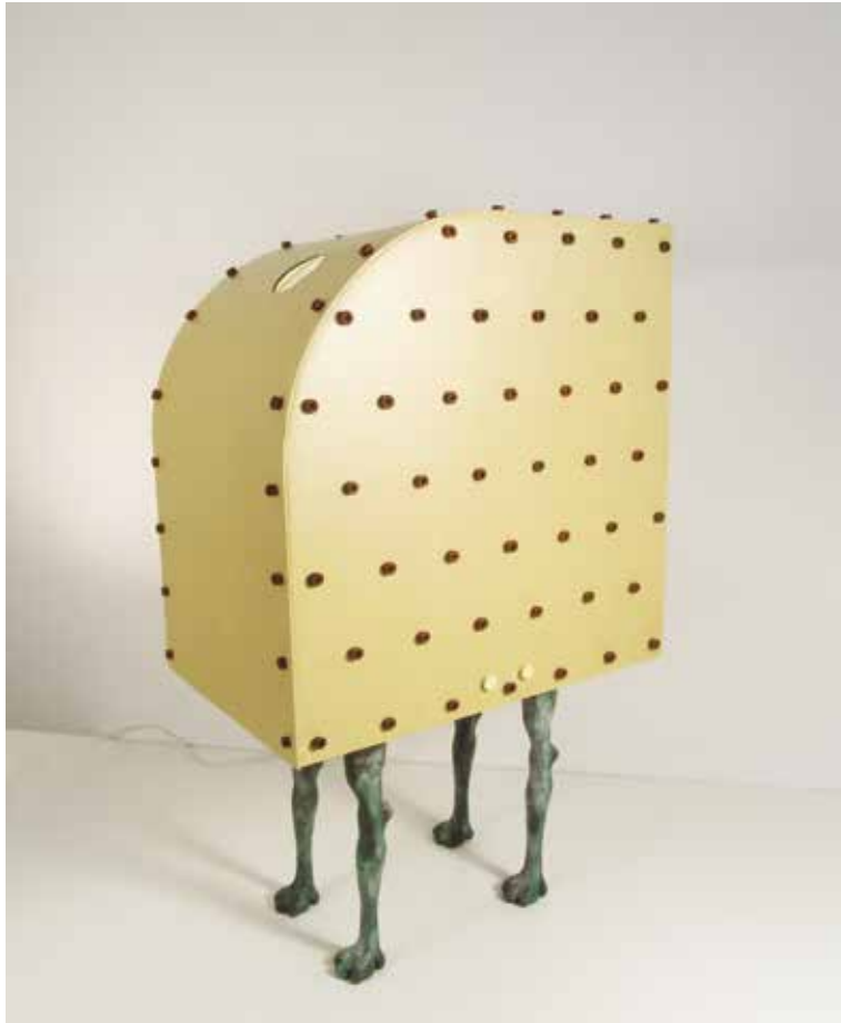
Prueba de fuego I. Mutoscopio. 80 x 40 x 55 cm. 2012