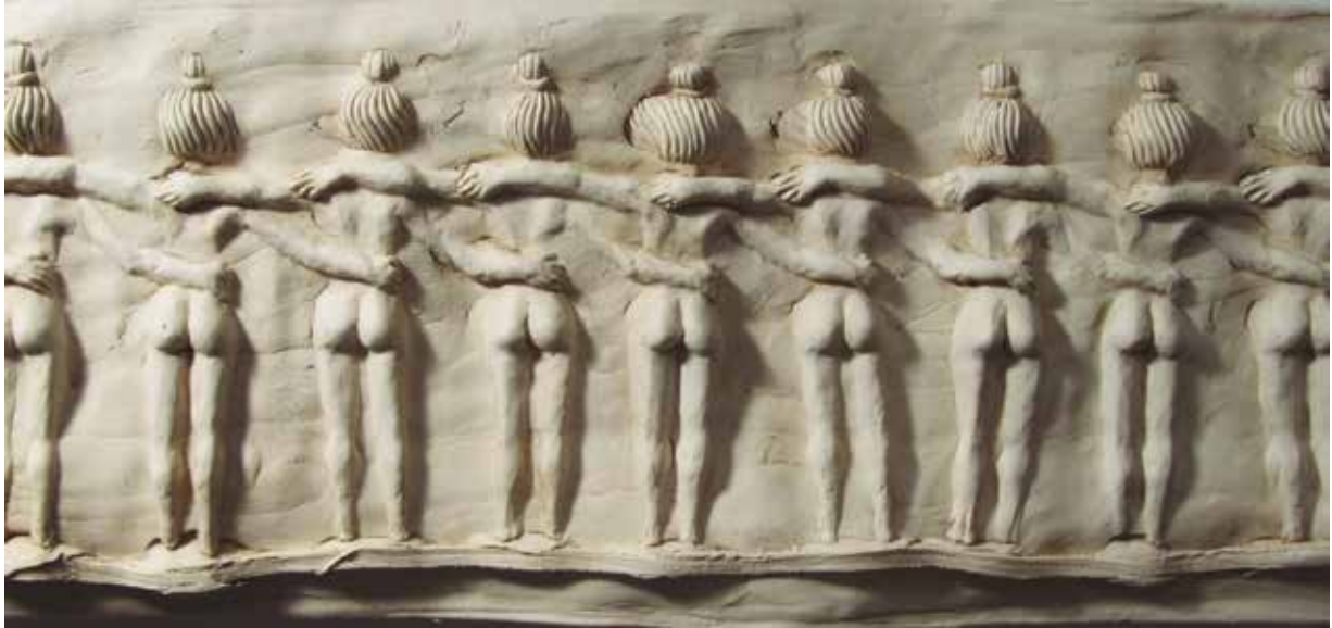
Prueba de fuego IX . Friso de escayola. 20 x 580 x 5 cm. 2013 (Fragmentos en página actual y siguientes)