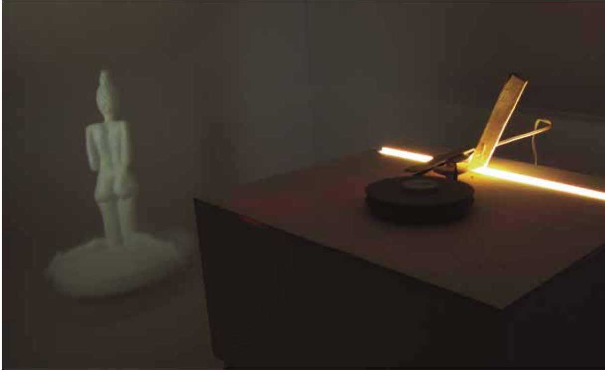
Prueba de fuego III. Proyector para escultura opaca. 28 x 48 x 41 cm. 2013