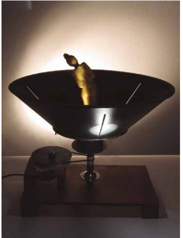
Prueba de fuego VI. Estroboscopio. 32 x 30,5 x 27 cm. 2013. Imágenes de la obra quieta y en funcionamiento