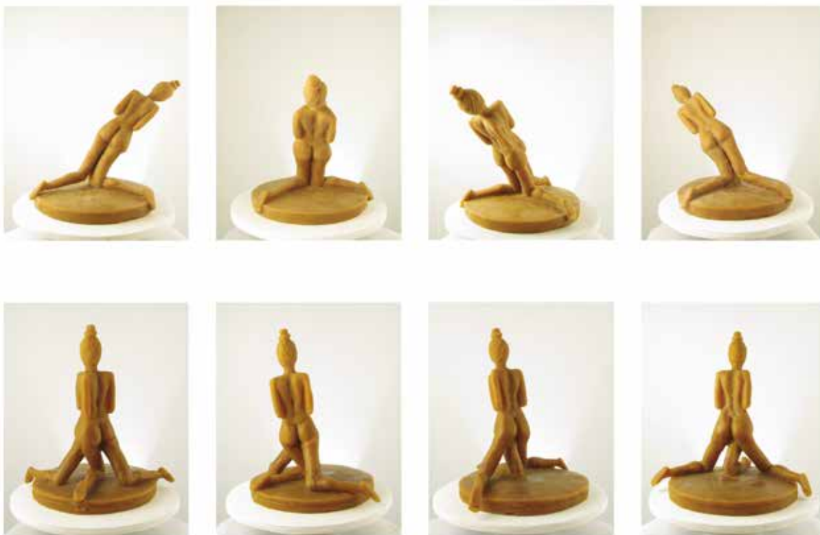
Prueba de fuego IV. Vistas de cada una de las 20 piezas que componen la serie