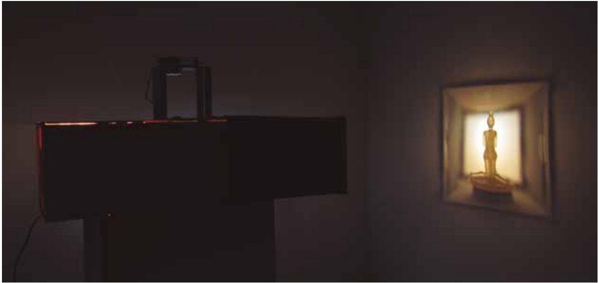
Prueba de fuego II. Proyector para escultura transparente. 41 x 23 x 80 cm. 2013