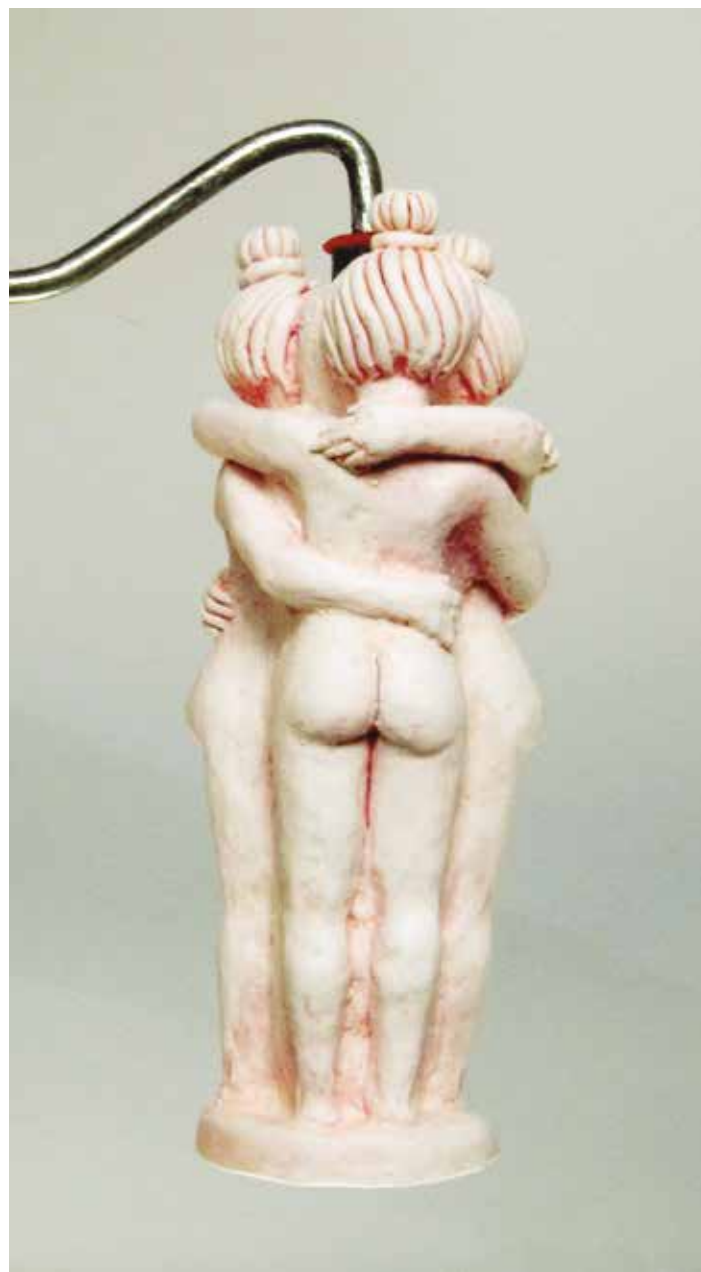
Prueba de fuego VIII. Rodillo de silicona. 23,5 x 19 x 16 cm. 2013