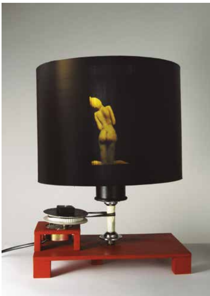
Prueba de fuego VII. Zootropo. 36 x 26,5 x27 cm. 2013. Imágenes de la obra quieta y en funcionamiento