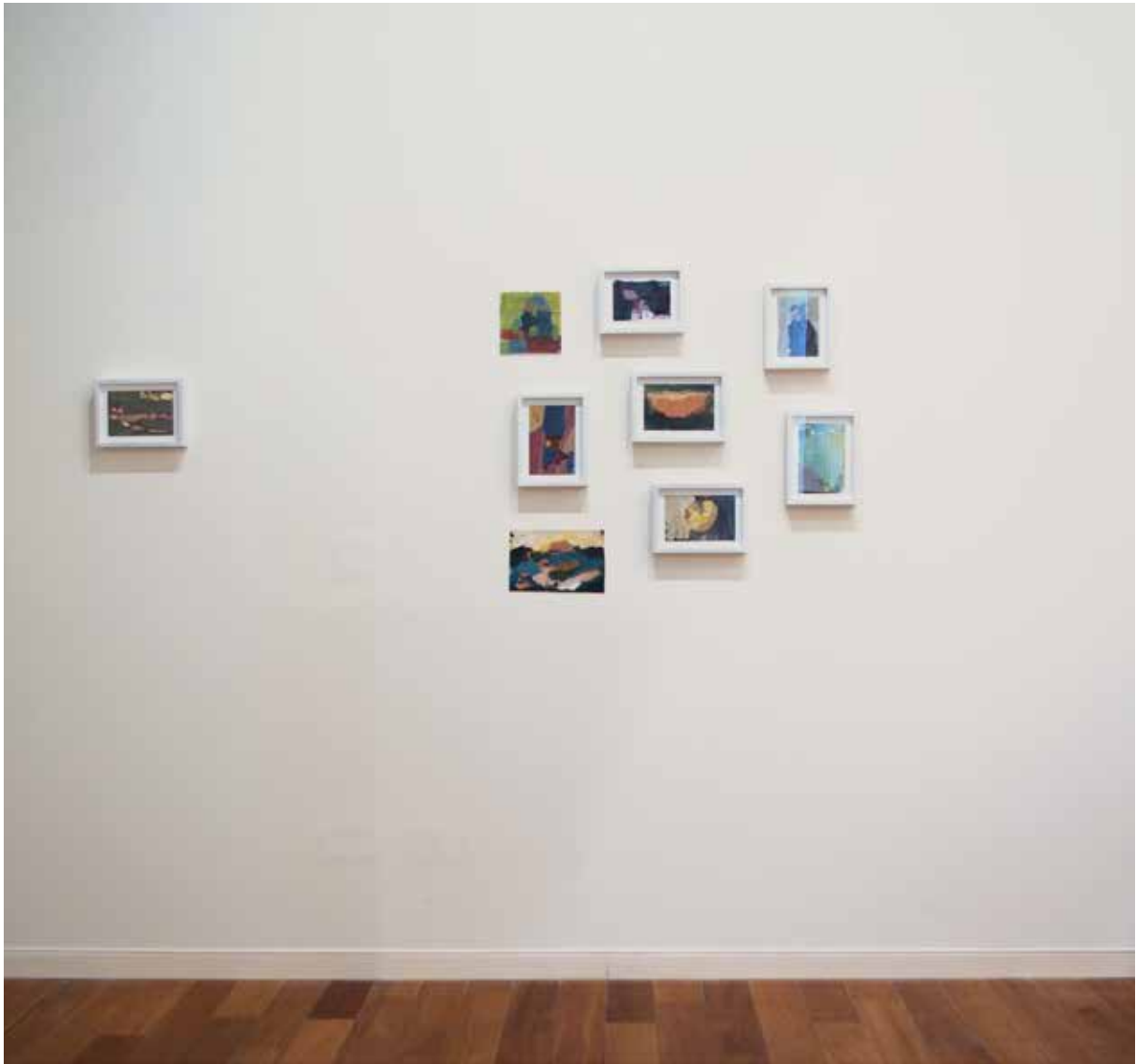
| Tristeza, ira y dolor-Chispazos al recuerdo. Técnica mixta, 2013