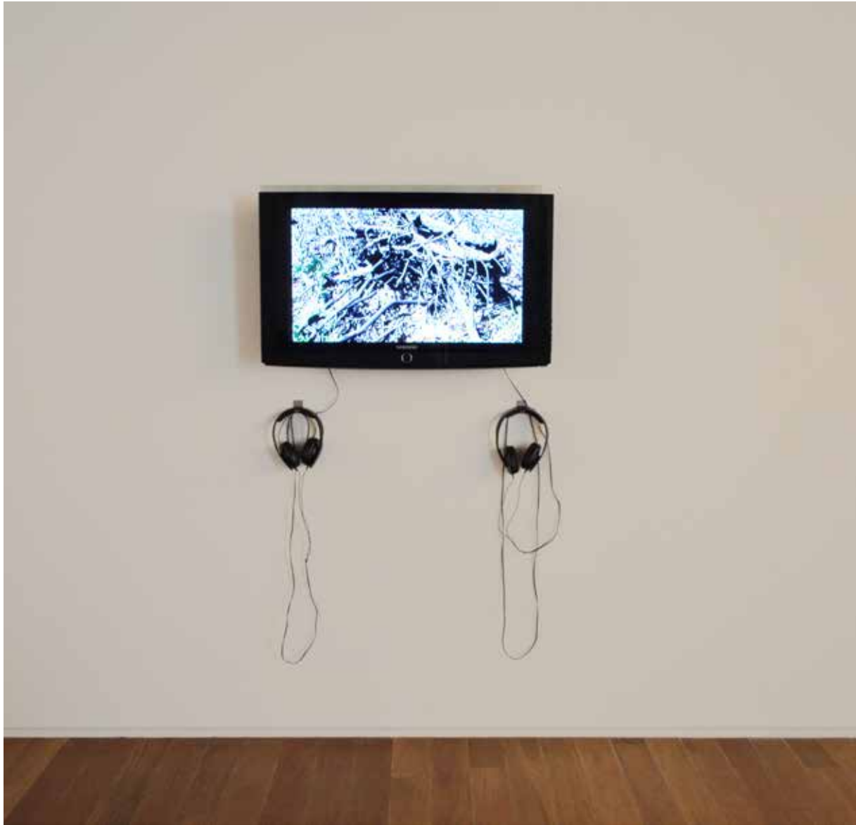
| Vuelta a la escena del Crimen . Vídeo digital, 11:06 minutos, 2013