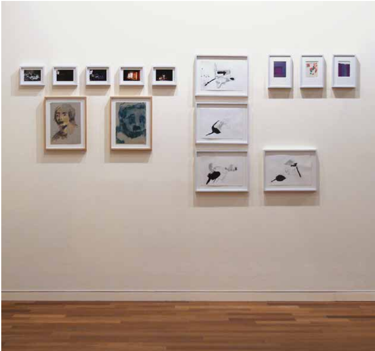
| Tristeza, ira y dolor-Chispazos al recuerdo . Técnica mixta, 2013