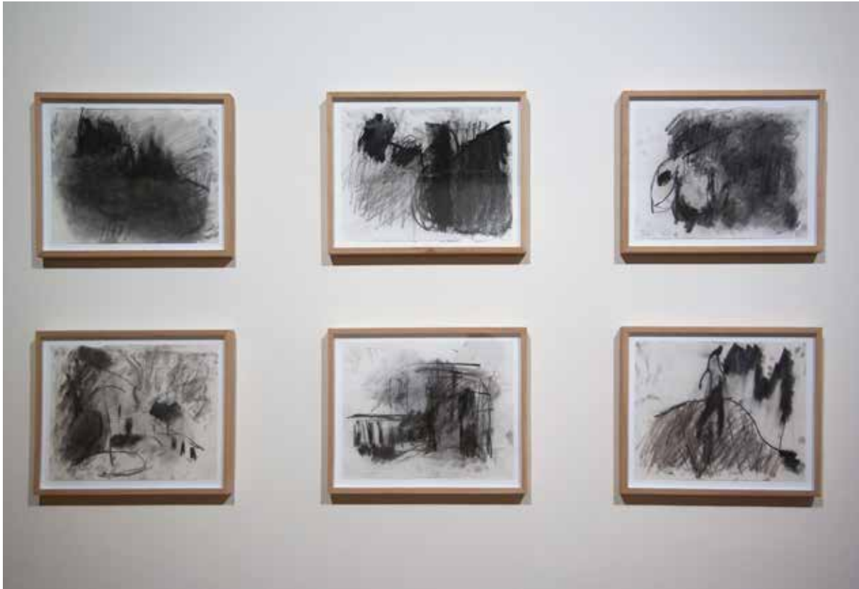
| Speaking out. Carboncillo sobre papel, 2013. Detalle