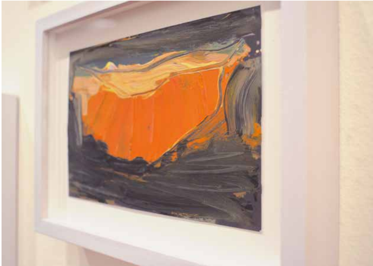
| Tristeza, ira y dolor-Chispazos al recuerdo, 2013. Detalle