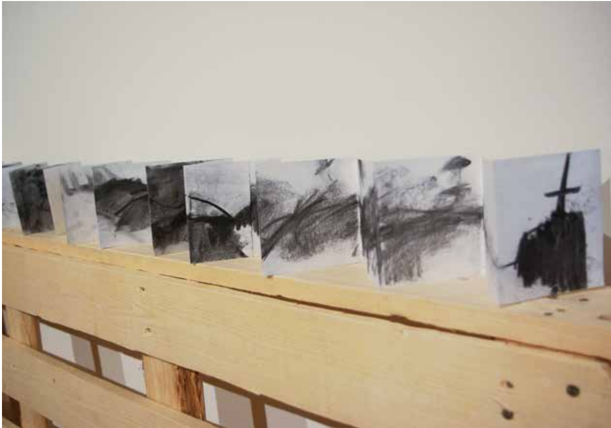
| Speaking out. Carboncillo sobre papel, 2013. Detalle