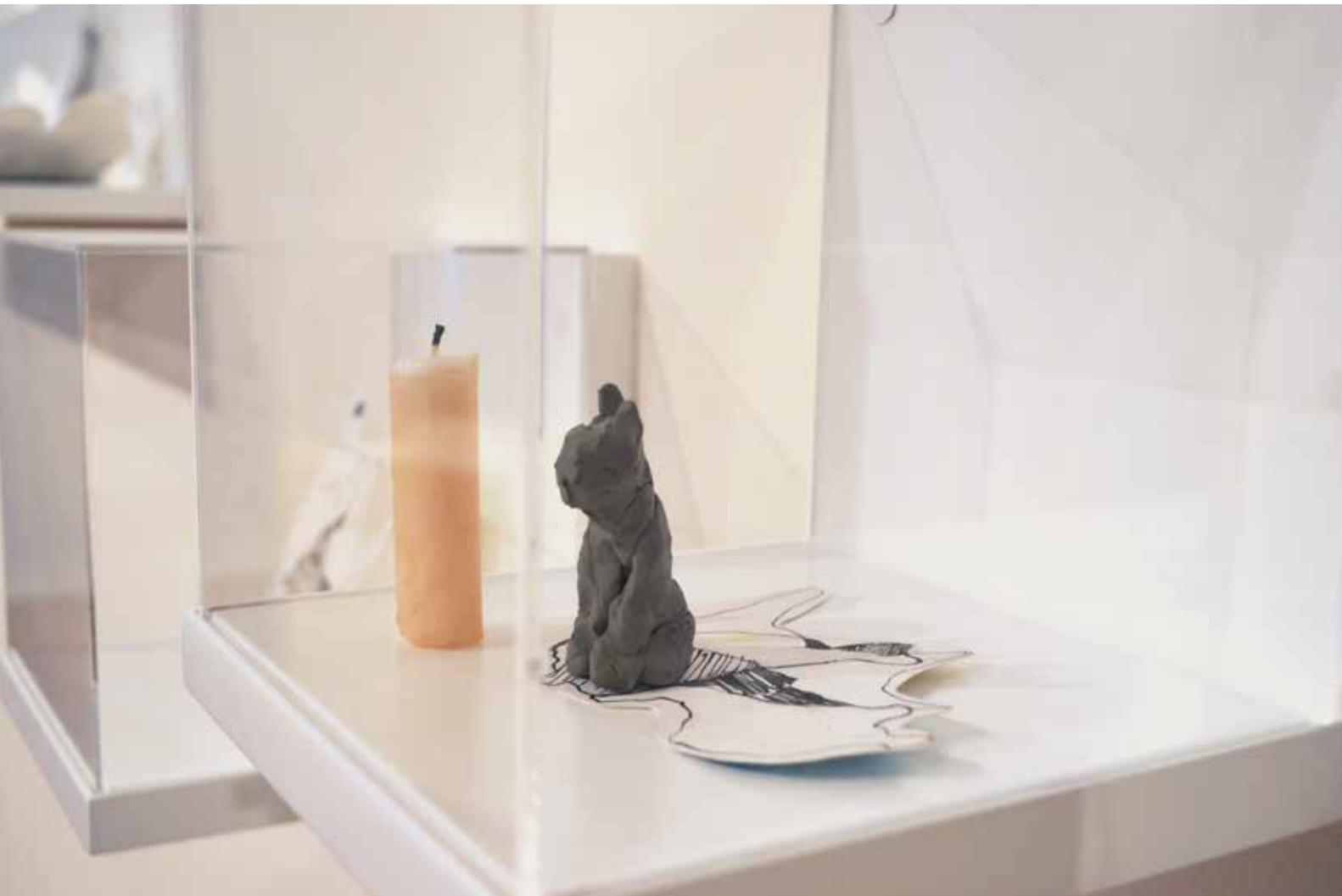
| Mnemónica . Técnica mixta, 2013. Detalle