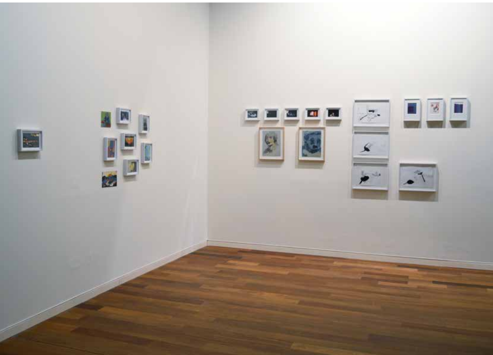
| Tristeza, ira y dolor-Chispazos al recuerdo. Técnica mixta, 2013