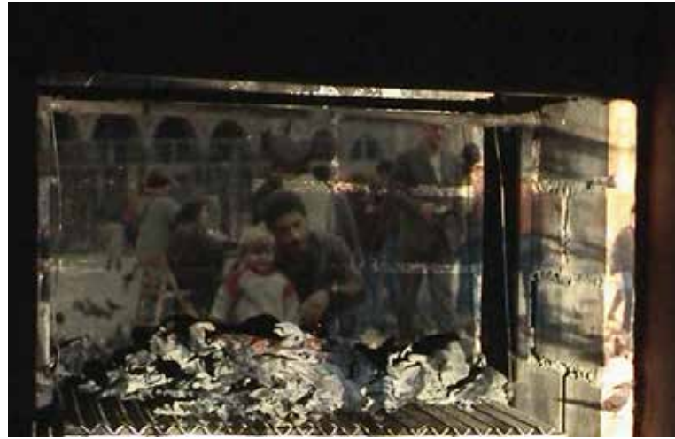
| Burning pictures. Vídeo digital, 4:34 minutos, 2013