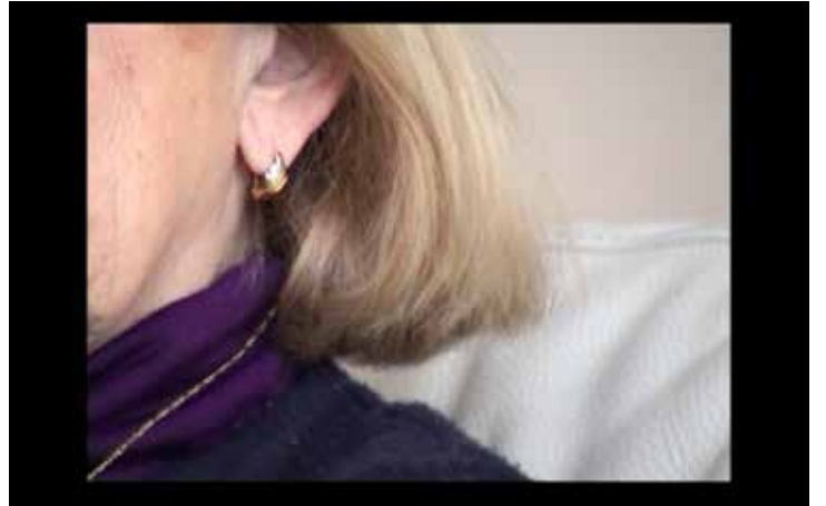
| Vuelta a la escena del Crimen . Vídeo digital, 11:06 minutos, 2013. Fotogramas