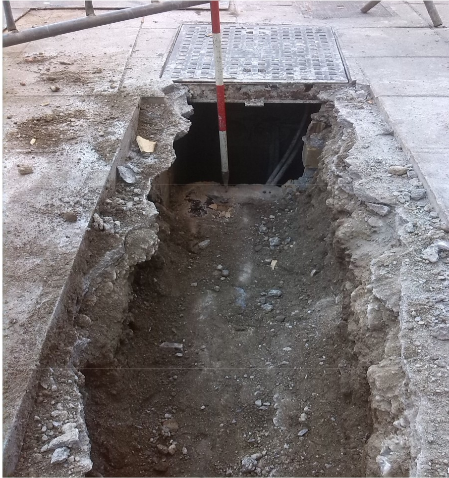
Lam. 4. Detalle de la antigua red eléctrica en un tramo de la zanja.

Las canalizaciones han sido protegidas en todo su perímetro con arena seleccionada, 0,20 m. sobre la generatriz del tubo, y posteriormente se rellenó la zanja con zahorra. La base de la capa de rodadura será siempre de hormigón H-150 con un espesor de 0,20 m. bajo calzadas y 15 cm. bajo aceras