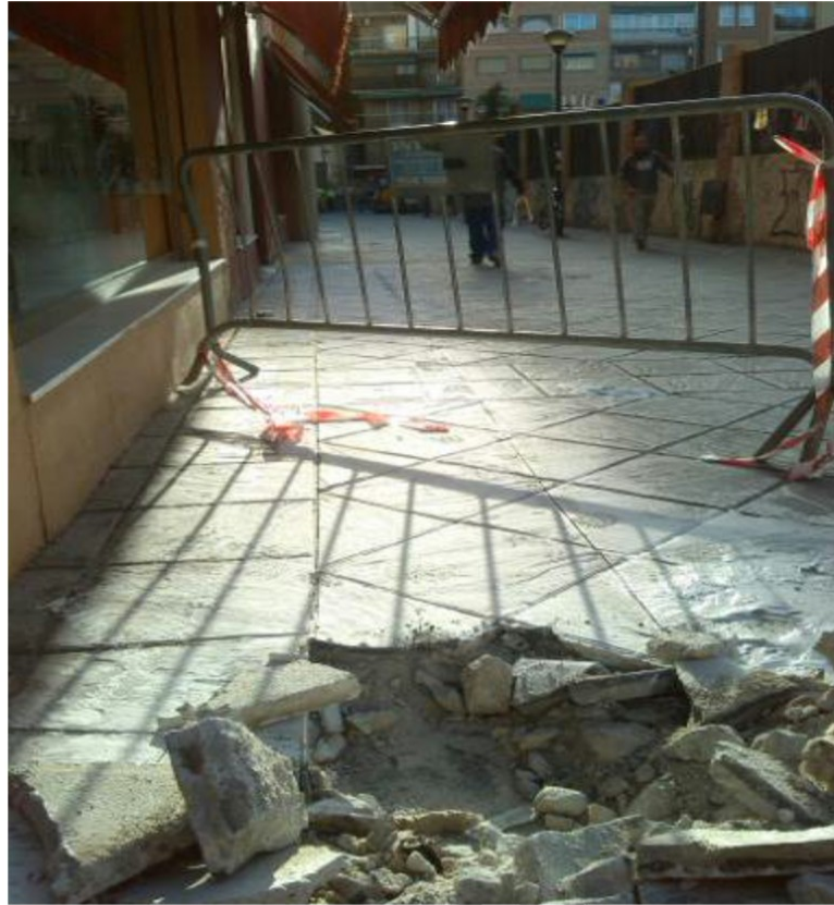
Lam. 3. . Vista de la calle peatonal donde apareció la bóveda.