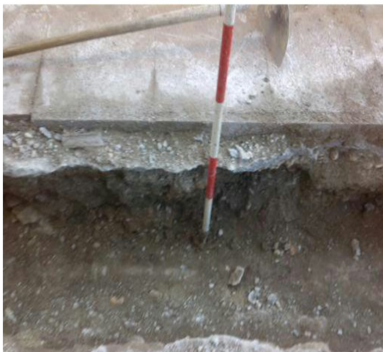
Lam. 5. Vista de la fase 1 contemporánea.

Esta fase, en la zanja abierta, vendría representada por el actual pavimento de la acera, de losas de cemento E-001, con una preparación de mortero de cemento, arena (UEC-0001) de 0,20 m. potencia. Todo este grupo estructural se asienta sobre una tierra limosa (UEN-0001), no se encuentran restos cerámicos ni material de construcción (Lam. 5).