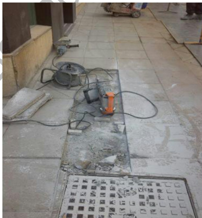
Lam. 1. Vista de los trabajos de apertura y trazado de la zanja de 10 m.

Los tres tramos de zanjas que han sido abiertas, han tenido una longitud total de unos 50m. aproximadamente. El primer tramo de 10 m. (Lam1), el segundo de 6 m. (Lam. 2). El tercero de 30 m. en la calle peatonal, (Granada), se ha dejado de hacer por tema de seguridad, después de detectar al levantar las losas una bóveda del garaje que esta justamente de bajo de tal calle (Lam3). La apertura se ha realizado con martillo compresor y máquina retro- excavadora, igualmente se utilizaron medios manuales..