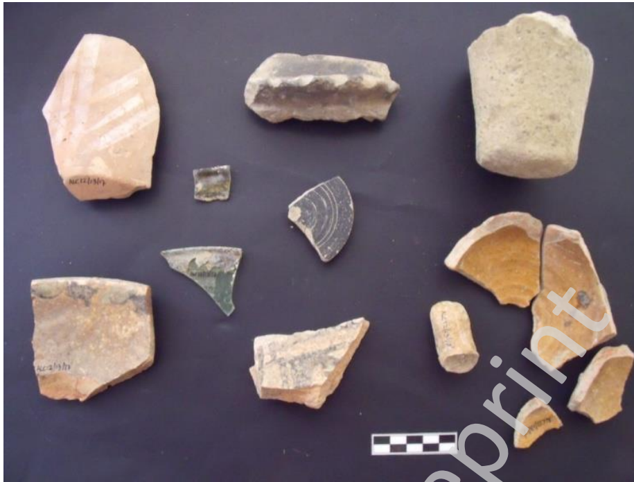
Lám II: Material UE 17