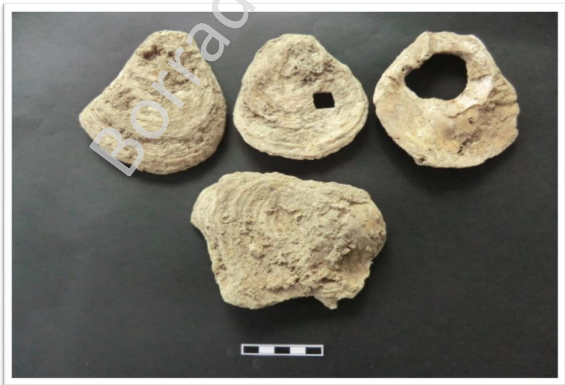
Lám III: Valvas de ostras halladas en UE 13