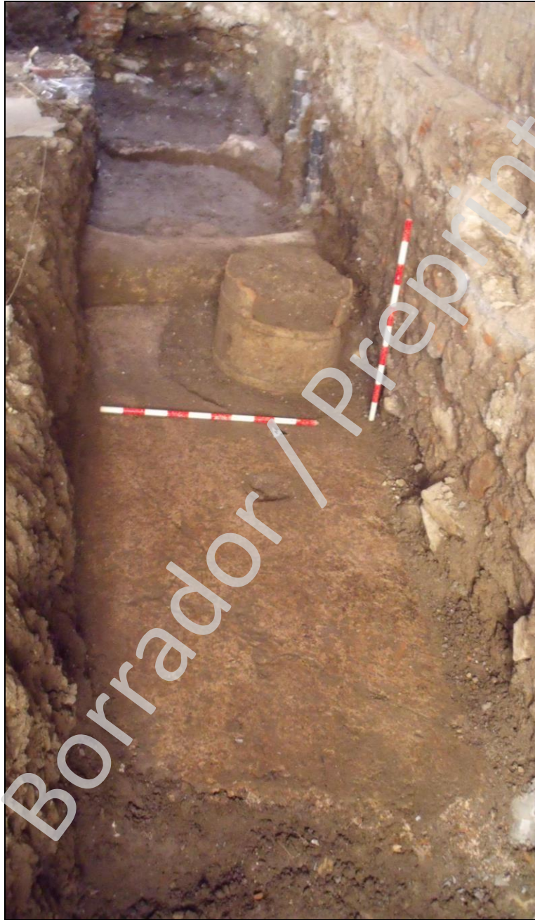
Lám. I: Fotografía del corte donde se observa la estructura de opus signinum y el pavimento y la intromisión del pozo con su brocal.