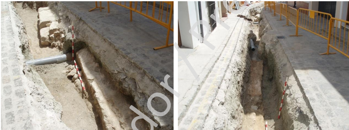
Lámina 5 y 6. Estructura de sillares UE 004 y muro UE 005 en calle Río.

A 1'30 metros de distancia hacia el oeste, y retranqueada casi un metro, aparece la línea de un muro labrado en la propia roca, de coloración rojiza (UE 005). Tiene una longitud de 16 metros, una anchura media de 0'60 metros y una profundidad en el punto donde se ha bajado más de 0'50 metros. Su línea no es regular, por lo que parece que se va adaptando a las curvas de nivel del terreno. A mediación del mismo falta un pequeño tramo por la afección de un registro actual.