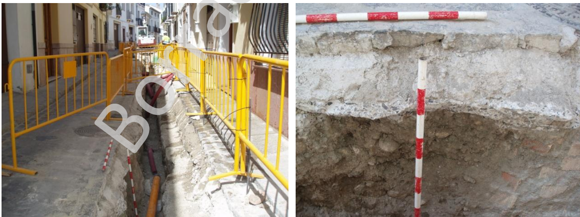
Lámina 1 y 2. Zanja en calle Río.

La única calle con resultados arqueológicos positivos ha sido la calle Río , donde se trabaja a finales de junio de 2015, muy cerca de la Alcazaba. Se abre una zanja a lo largo de toda la calle partiendo de la plaza del Carmen. Su longitud es de unos 200 metros, su anchura de 1'50 metros y su profundidad de 1 metro. La traza abarca toda la mitad norte de la calzada. Durante la excavación mecánica de la zanja se localizó a la altura del número 44 un sillar de piedra caliza en posición secundaria que nos puso en alerta sobre la importancia arqueológica de este sector de la obra. El sillar se sacó y se depositó en la nave de los servicios operativos del ayuntamiento de Antequera a instancias del arqueólogo municipal. Inmediatamente después aparecen más sillares, éstos en posición primaria, que conforman un muro localizado en el perfil sur de la zanja a la altura del número 42. A partir del número 33 de la calle va apareciendo un muro realizado en la propia roca hasta el número 29, siempre siguiendo la línea de la zanja. A partir de este número dejan de aparecer vestigios arqueológicos. La estratigrafía general de la calle muestra un nivel de adoquines (UE 001) de 0'10 metros de espesor, un nivel de hormigón de 0'20 metros (UE 002) y un estrato de tierra marrón producto del relleno para nivelar la calle (UE 003) de 0'70 metros de potencia.