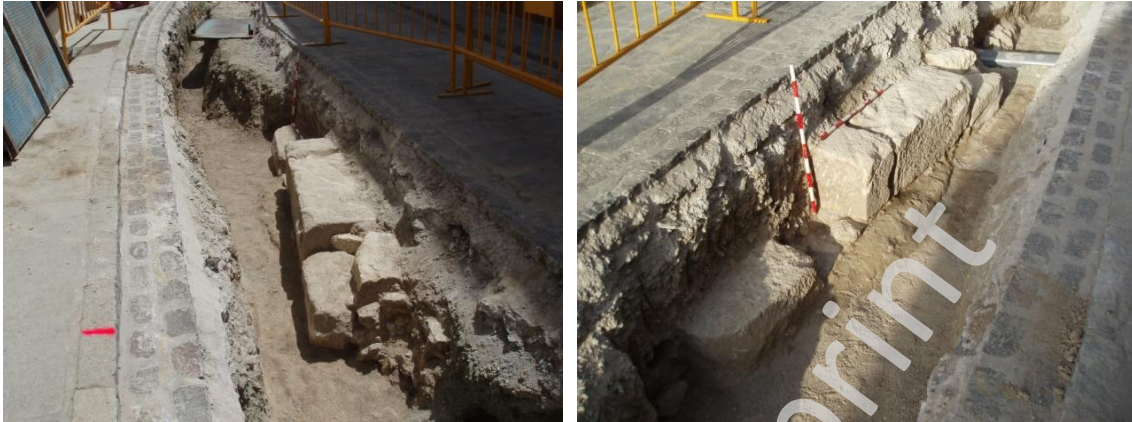
Lámina 3 y 4. Estructura de sillares UE 004 en calle Río.

observar que la zona central se asienta sobre la roca del terreno, por lo que se trata de la primera hilada. En el extremo opuesto encontramos dos hiladas con un pequeño sillar irregular sobre la primera hilada.