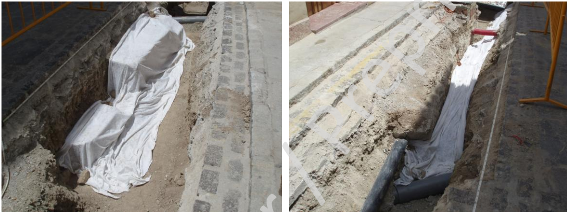
Lámina 10 y 11. Proceso de cubrición de los restos con tela geotextil.

A propuesta de las autoridades competentes, los restos hallados, una vez correctamente documentados, se han protegido in situ mediante cubrición con una tela geotextil, una capa de grava de al menos 10 centímetros encima, una capa de albero y una capa de hormigón, ajustándonos también a las necesidades de cubrición de la propia obra.