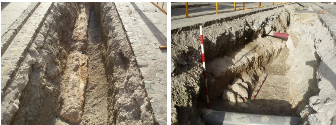
Lámina 7 y 8. Muro UE 005 en calle Río.

A 1'30 metros de distancia hacia el oeste, y retranqueada casi un metro, aparece la línea de un muro labrado en la propia roca, de coloración rojiza (UE 005). Tiene una longitud de 16 metros, una anchura media de 0'60 metros y una profundidad en el punto donde se ha bajado más de 0'50 metros. Su línea no es regular, por lo que parece que se va adaptando a las curvas de nivel del terreno. A mediación del mismo falta un pequeño tramo por la afección de un registro actual.