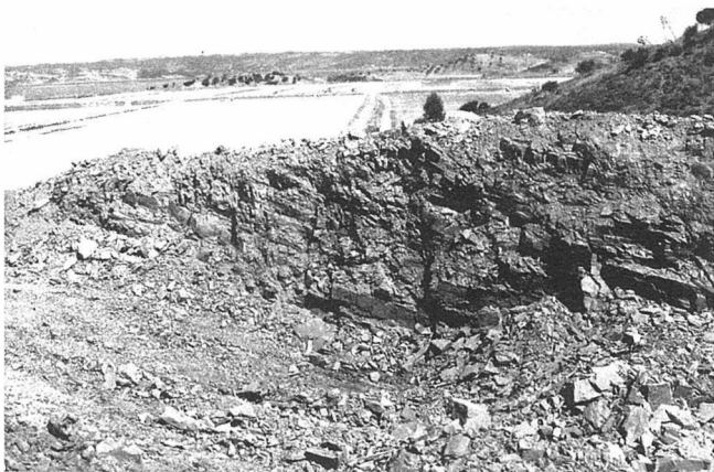
FOTO 2. Vegetación natural de la zona.