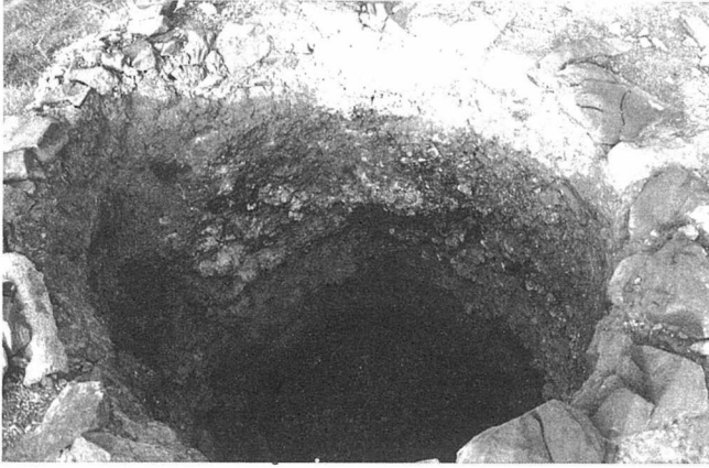
FOTO 3. Boca de un horno para obtener cal.