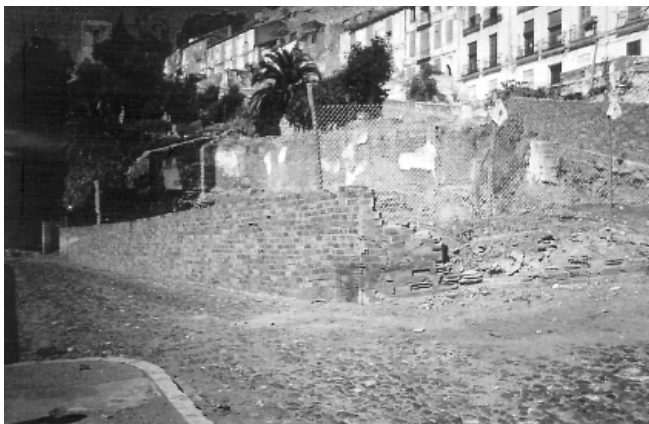
LÁM. 1. Vista de la ubicación del solar en la subida de La Coracha.

El individuo según se aprecia por los restos dentales, es adolescente con una edad aproximada se 12 a 15 años. Tanto la dirección de la cabeza al este (para sujetar la cabeza?) y las piernas al oeste, no nos aporta un dato concluyente sobre el tipo de rito.