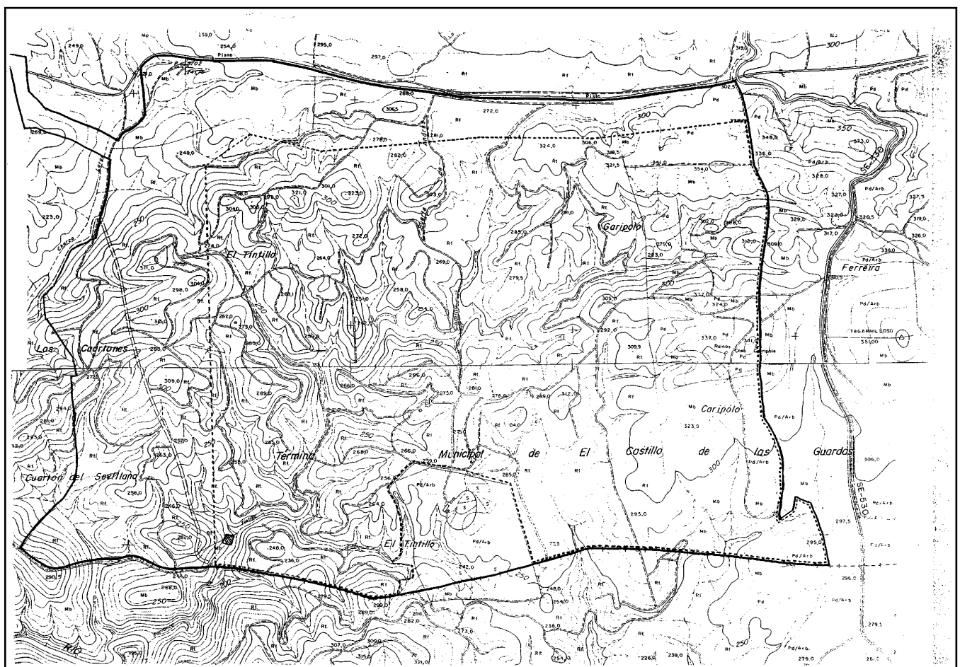
FIG. 2. Plano de localización del yacimiento dentro de la propiedad (polígono con líneas paralelas oblicuas), el área de prospección (línea de guiones) y la delimitación de la finca (línea continua).

La Galería Norte, denominada así por estar ubicada más al Norte, ofrece una planta sencilla de un corredor subterráneo horizontal, orientado en sentido Este-Oeste, de unos 8 m. de profundidad y una entrada de 1,80 m. de altura, en la cual no apareció restos arqueológicos en superficie. Por el contrario, a su alrededor, se hallaron un gran número de socavones de poca profundidad, de diversos tamaños y a distintas alturas, técnica muy característica de épocas pasadas, basada en pequeños puntos de extracción de mineral.