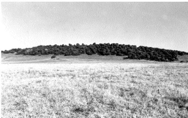
Lám. I: Vista general del Cerro de la Lapa.

Ha sido realizada según las coordenadas U.T.M. de localización, en cartografía 1:10.000, tomando en cada yacimiento varios puntos que se corresponden con los vértices del polígono trazado y denominando cada punto con las iniciales A, B, C, D,... comenzando por el punto más cercano a Occidente y siguiendo su denominación en sentido inverso a las agujas del reloj.