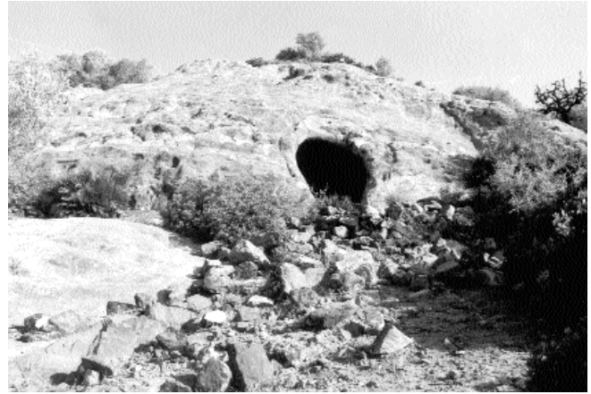
Lám. III: Yacimiento de la Cueva de la Lapa.

En las proximidades de dicho yacimiento se tiene previsto la instalación del aerogenerador nº 30, que afecta, al menos parcialmente, a los restos encontrados. (Lám. II).