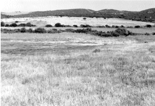
Lám. II: Vista del yacimiento de la Dehesa Jandilla.