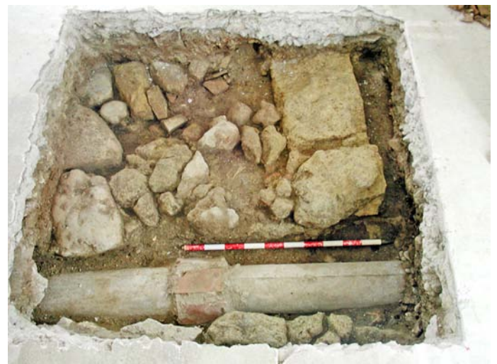
Lámina II. Nivel Contemporáneo: Ue.1, Ue.2 y Ue.3. Nivel Interfases Arrasamiento Ue.8