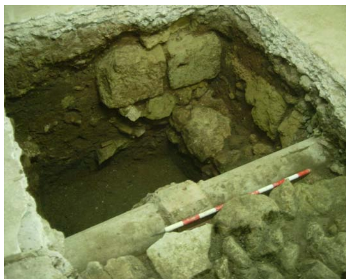
Lámina XIV. Detalle de la Ue.3 y Ue.7 en la zona ampliada visto desde el Norte