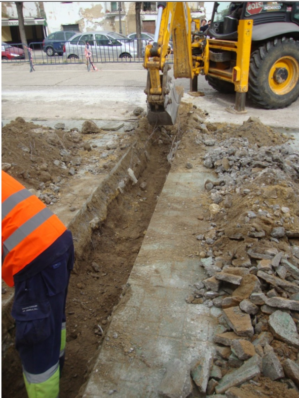
Detalle de excavación.