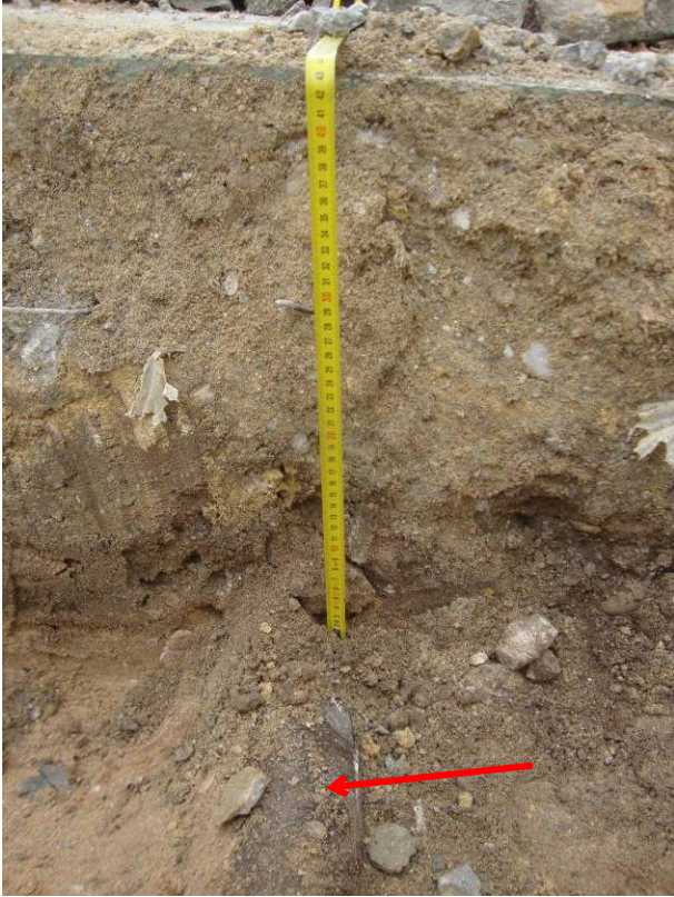
Estratigrafía: hormigón, relleno y tubería.