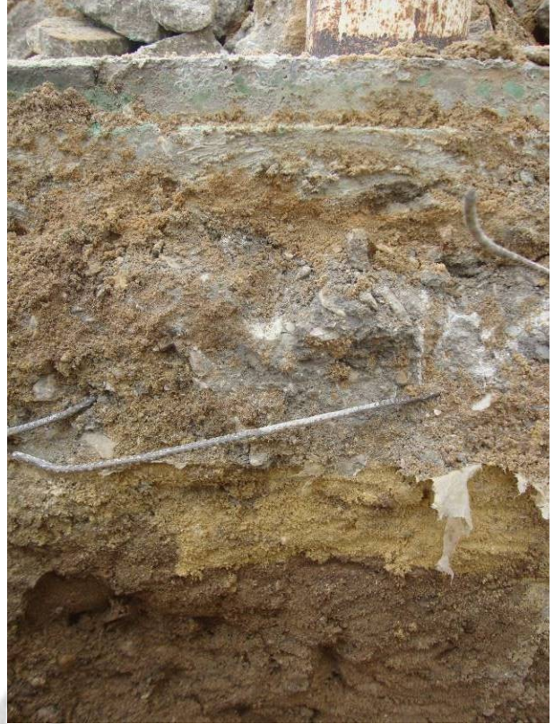
Estratigrafía: hormigón armado, subbase y relleno.