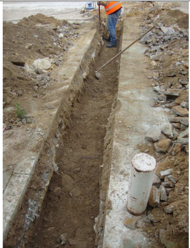
Detalle de excavación.