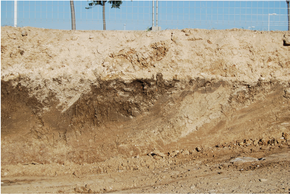
Lámina 3: Unidades Estratigráficas 4 y 5.