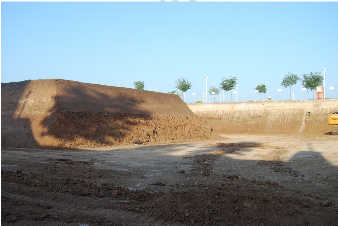
Lámina 4: Vista final de los trabajos de rebaje del terreno.