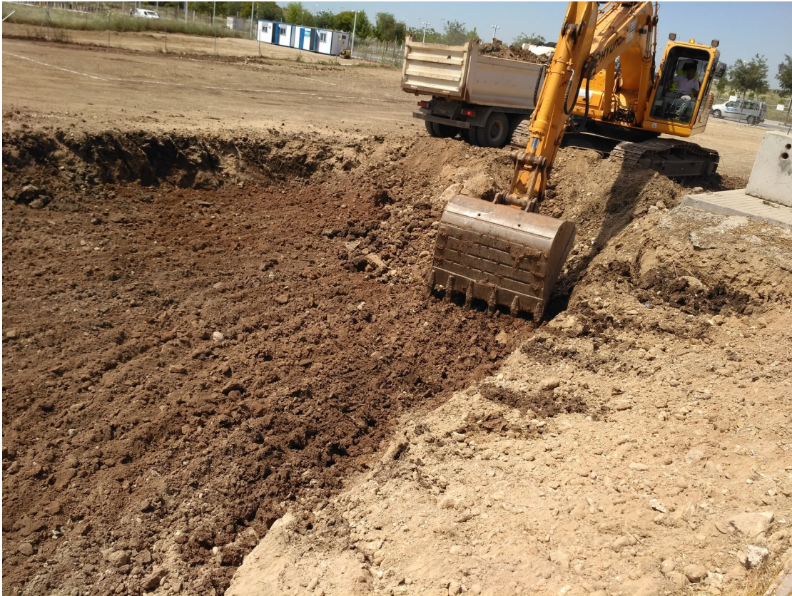
Lámina 1 : Rebaje inicial del terreno.