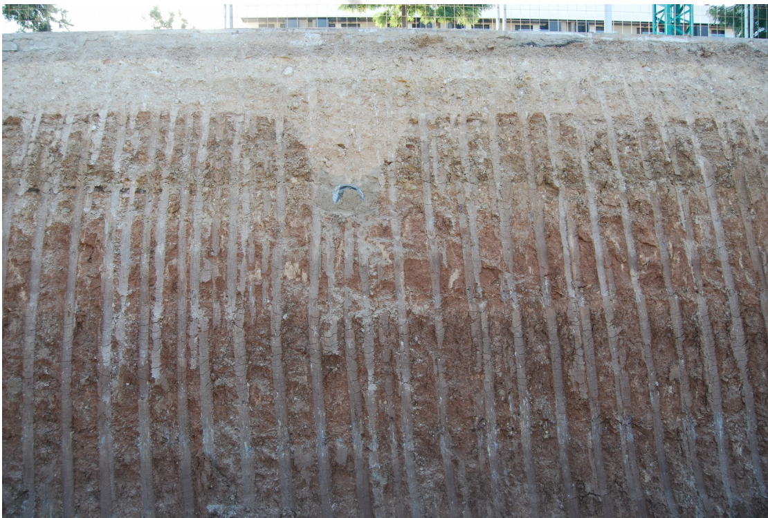
Lámina 2: Rebaje de las Unidades Estratigráficas UU.EE. 5 y 6