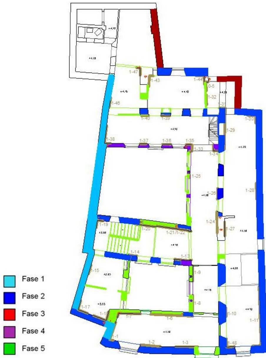
Fig. 3.- Situación de los sondeos parametales realizados y fases documentadas en la planta primera de la casa.

Es posible que durante esta fase y para adaptar la casa a las nuevas necesidades, se produzca el cegamiento de alguno de los vanos existentes, así pensamos que se tapiarían algunos de los existentes en la fachada Este del primer patio, es decir, la portada serliana de la planta baja que será totalmente transformada de forma que en la planta baja se sigue manteniendo un acceso a la crujía lateral bajo el arco central de la misma.