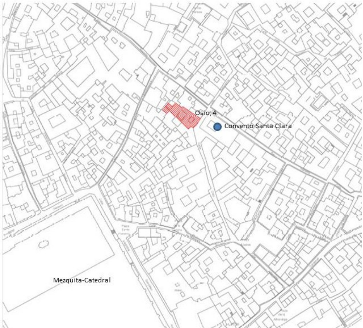
Fig. 1. Ubicación del inmueble

actual, tienen lugar entre los siglos XVI y XVII para sufrir otra gran remodelación a principios del siglo XX.