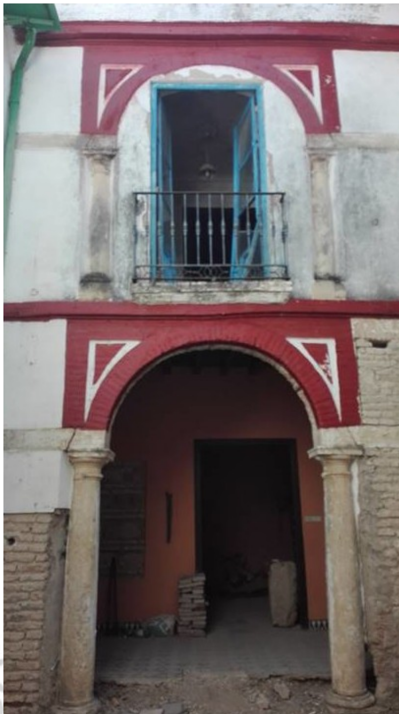
Lám. II.- Portada serliana situada en el lado Este del primer patio de la casa. Los vanos adintelados laterales fueron cegados tras una reforma realizada a mediados del siglo XVII.

El cambio que se produce en la configuración de la casa en este momento conlleva la construcción del forjado de la primera planta. En el caso de las crujías que rodean el segundo patio al Norte y Este esta construcción se plasma en el caso de la crujía oriental en la construcción de una arquería formada por tres arcos rebajados que apean sobre columnas de fuste liso coronadas con capiteles de orden toscano generándose así una fachada de dos