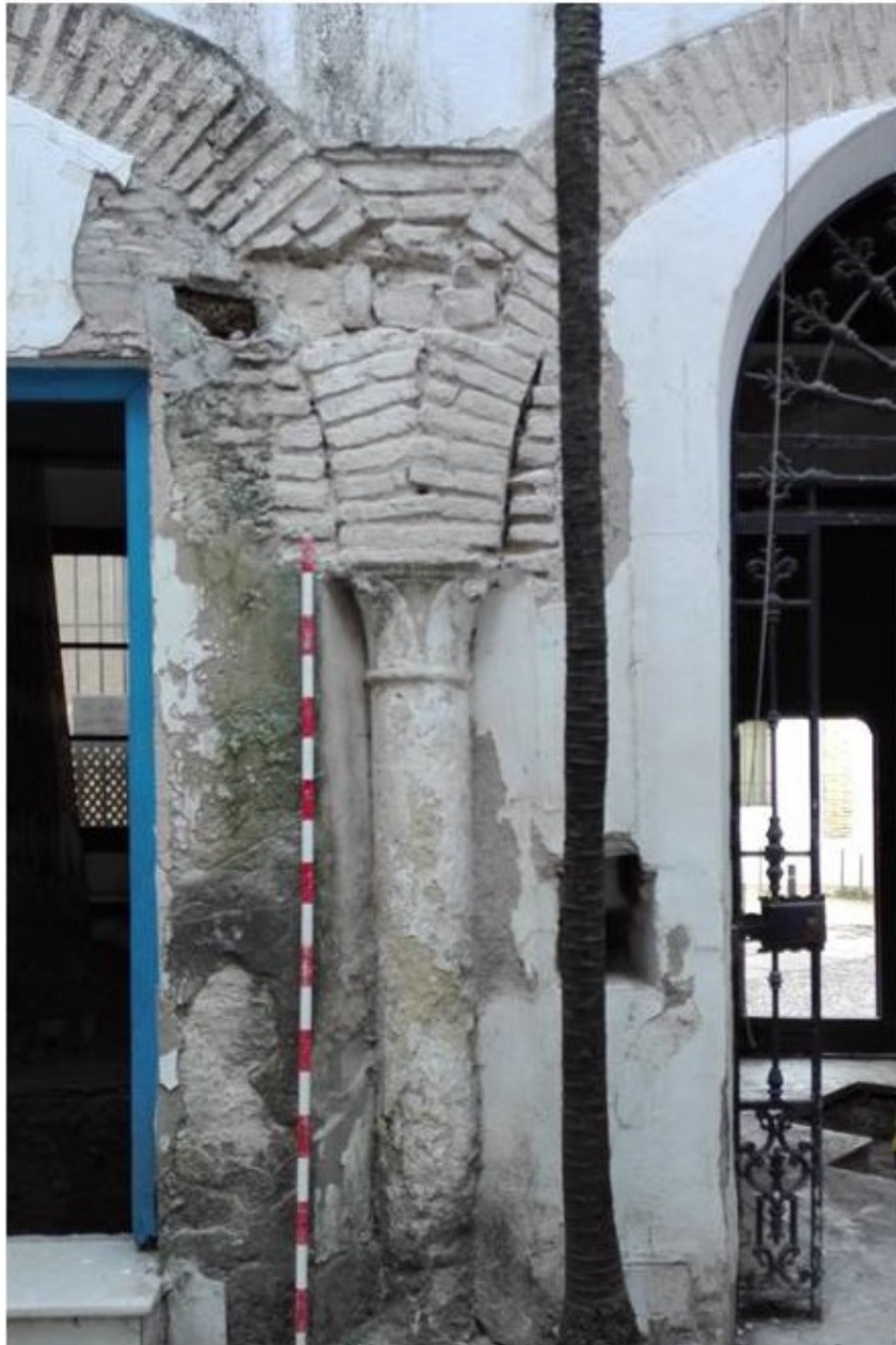
Lám. I.- Pórtico Sureste del primer patio de la vivienda con arcos descansando sobre una columna rematada por un capitel de castañuelas.

Estos capiteles a veces constituyen una pieza exenta labrada por sus cuatro caras mientras que en los límites de la arquería (y por tanto los límites de este patio), se sitúan capiteles de pilastras con más o menos volumen, labrados sobre un bloque paralelepípedo de calcarenita. Constituye un ejemplo de ello, el situado en el sondeo realizado en el zaguán de acceso a la casa, sondeo 0-6 que en este caso, aparece enlucido y repintado. En el caso del documentado en el sondeo 0-17 prácticamente constituye un alto relieve.