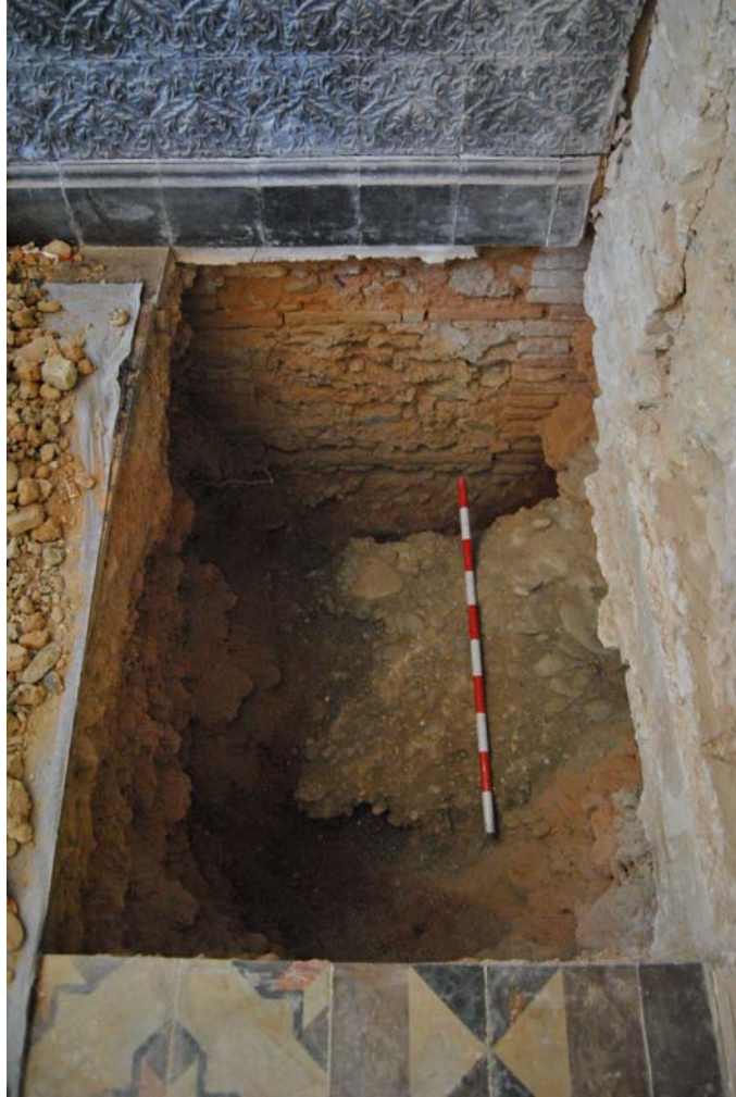
Lam. 1 Calicata 3