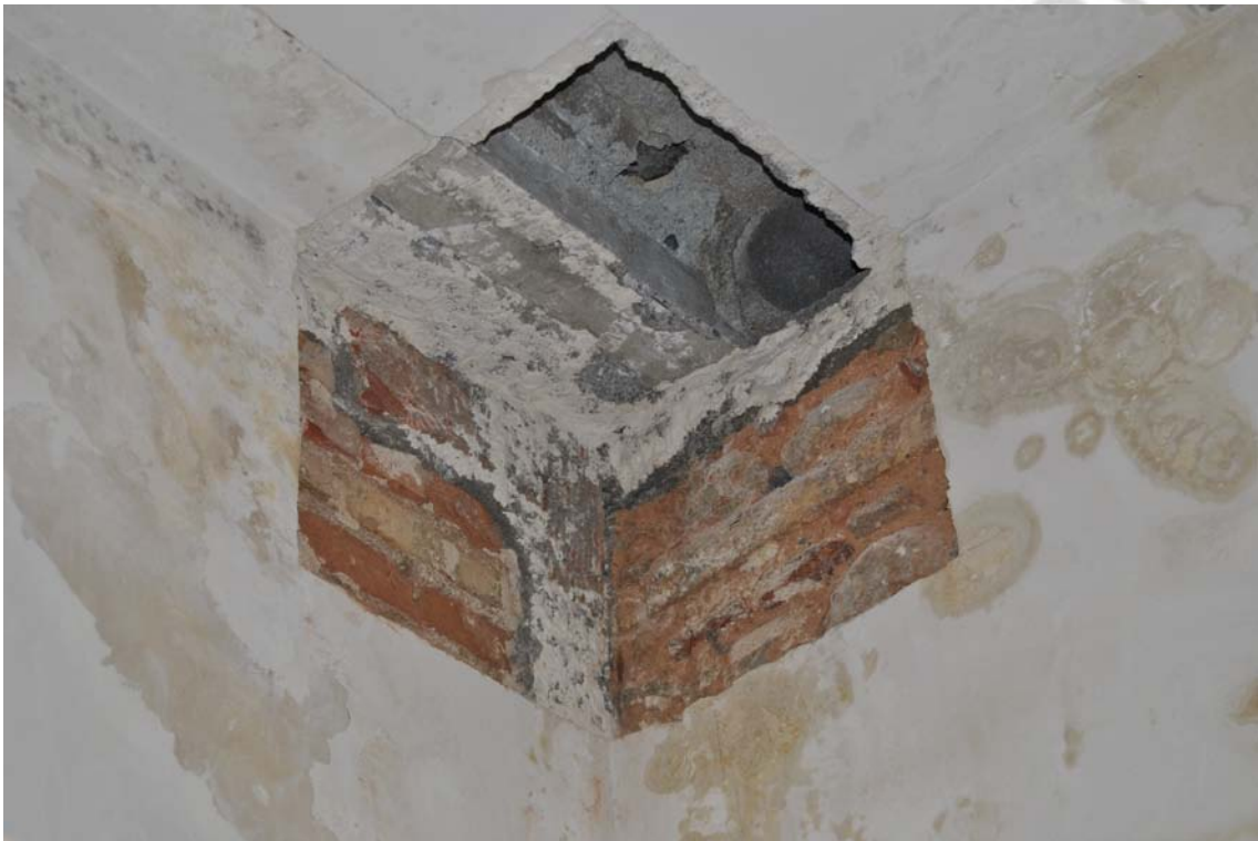
Lam. 4 Catas murales y en el forjado de la Sala 6.