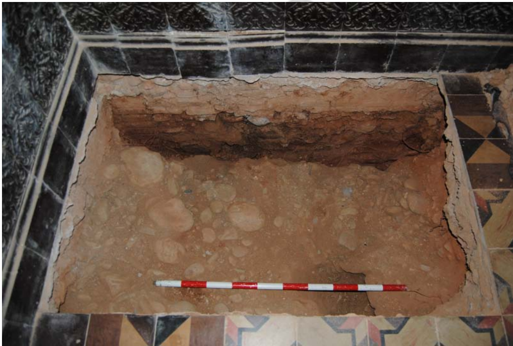
Lam. 2 Calicata 4