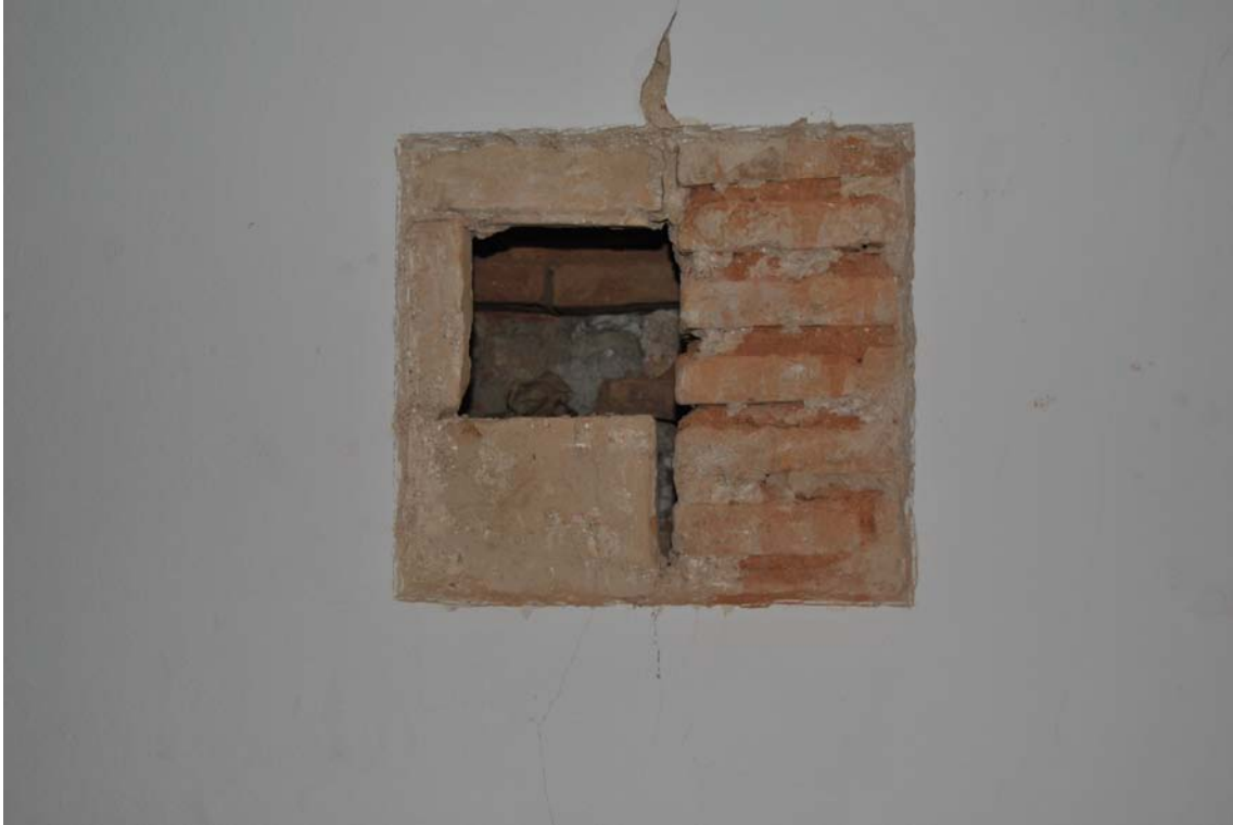
Lam. 3 Cata mural en la Sala 18