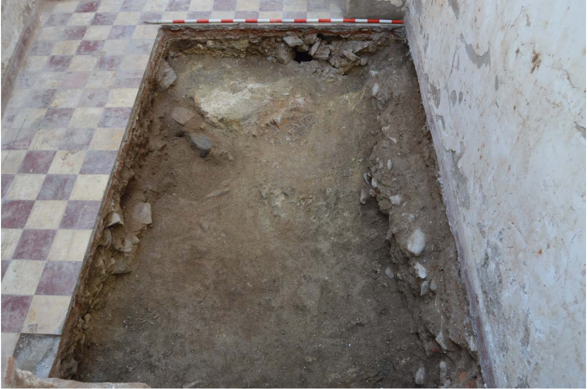
LAM 1.- VISTA GENERAL PLANTA