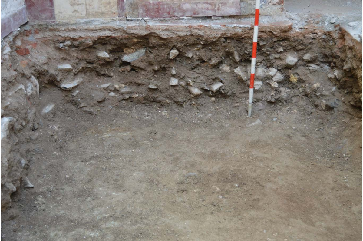
LAM 2.- VISTA GENERAL SECCIÓN SUR