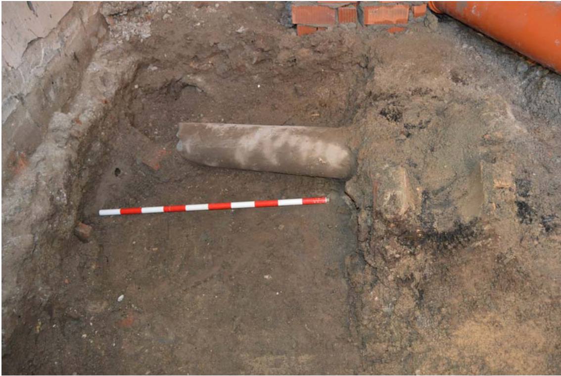
LAM 1.- DARROS DE CEMENTO