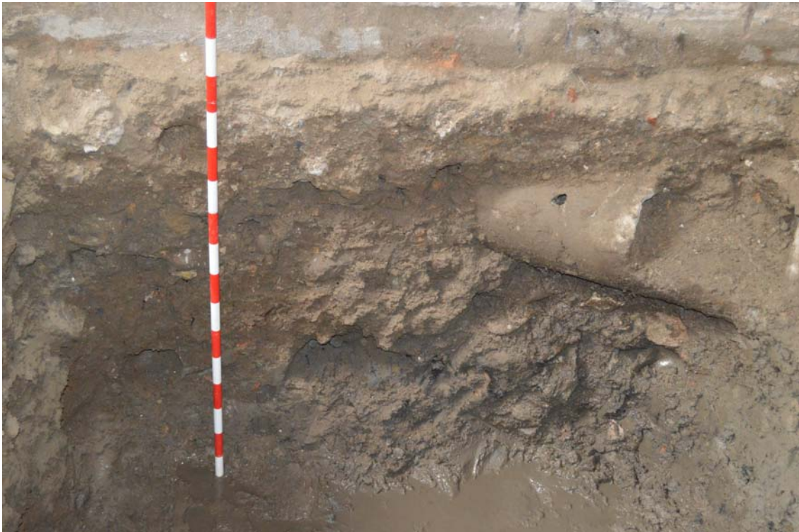
LAM 2.- PERFIL OESTE