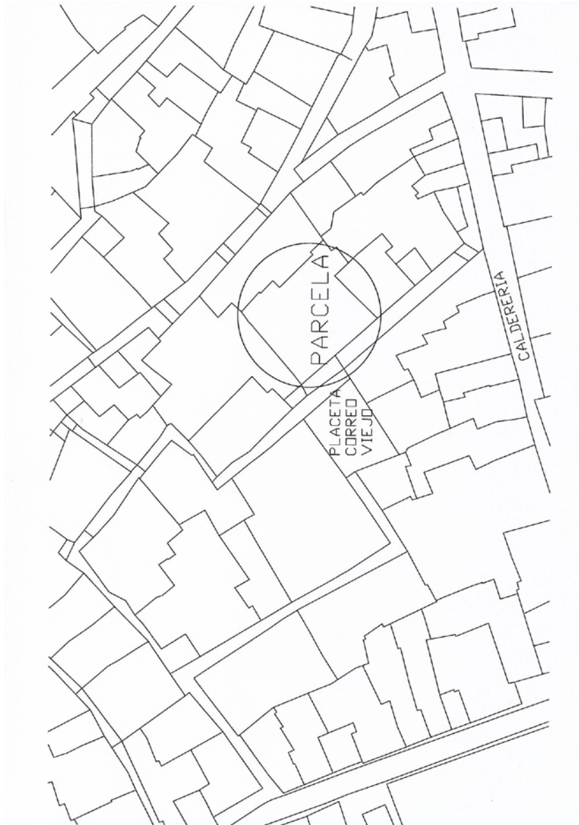
FIG 1.- PLANO DE SITUACIÓN