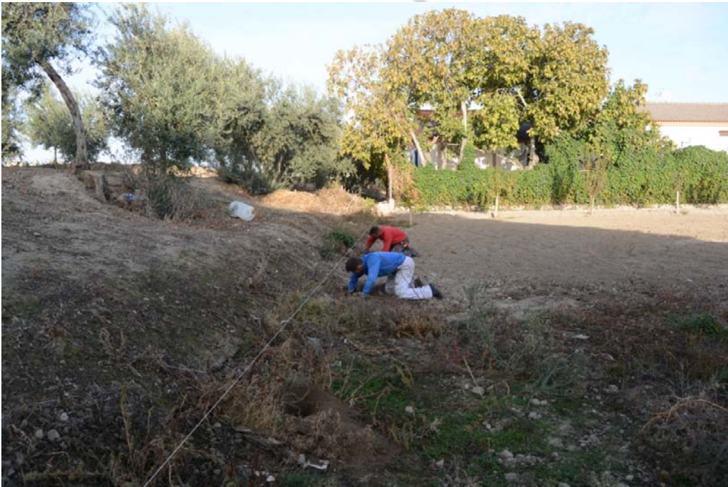
Lámina II: Realización de los hoyos para la ubicación de los postes en la linde sur.