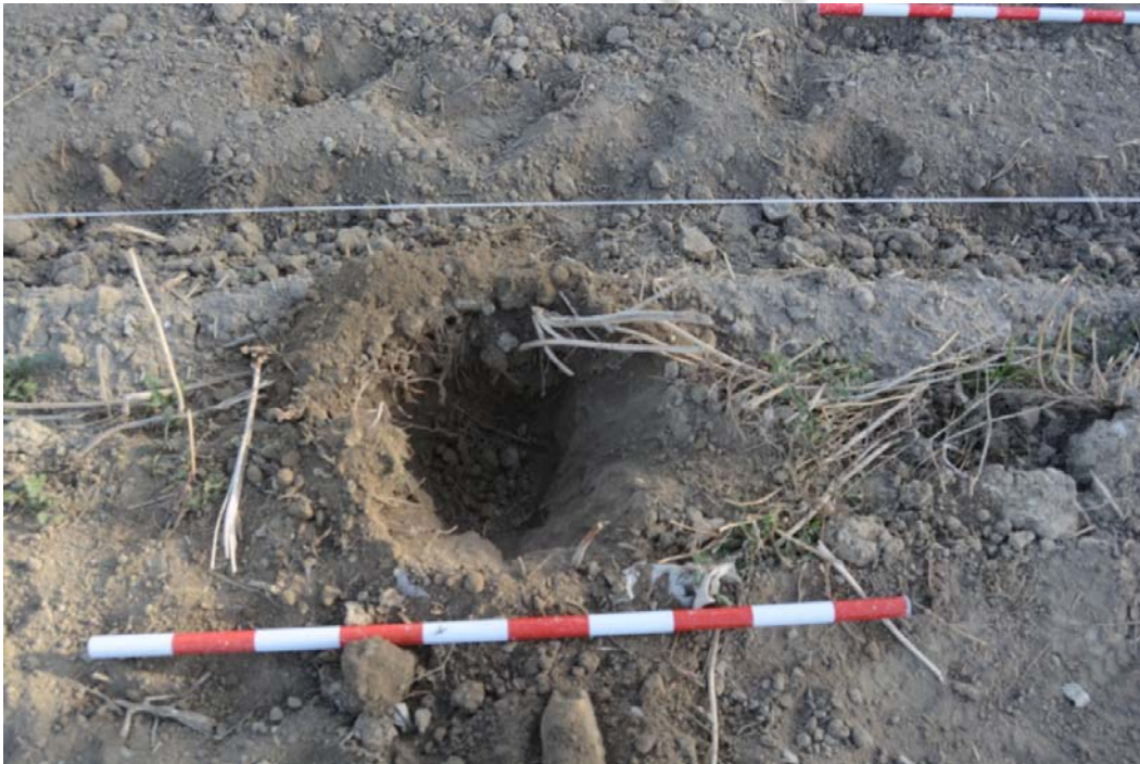
Lámina IV: Aspecto de un hoyo tras su realización, donde se observa una única UE de tierra vegetal.