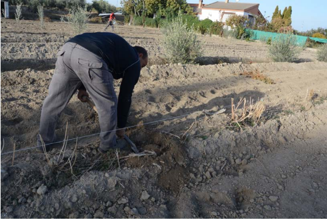
Lámina I: Realización de los hoyos para la ubicación de los postes en la linde norte.