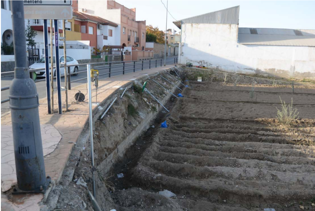
Lámina III: Realización de los hoyos sobre el acerado para la ubicación de los postes en la linde este.