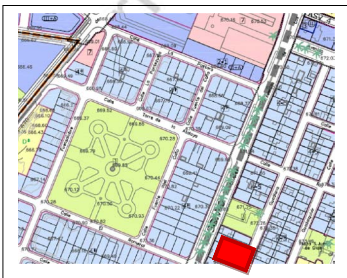
Fig 1: Ubicación del solar. Plano de detalle. Catastro 2017

El solar objeto de excavación arqueológica se encuentra situado en la Calle Fuente del Caño, s/n, Parcela 111 del Sector IV de Martos (Jaén).