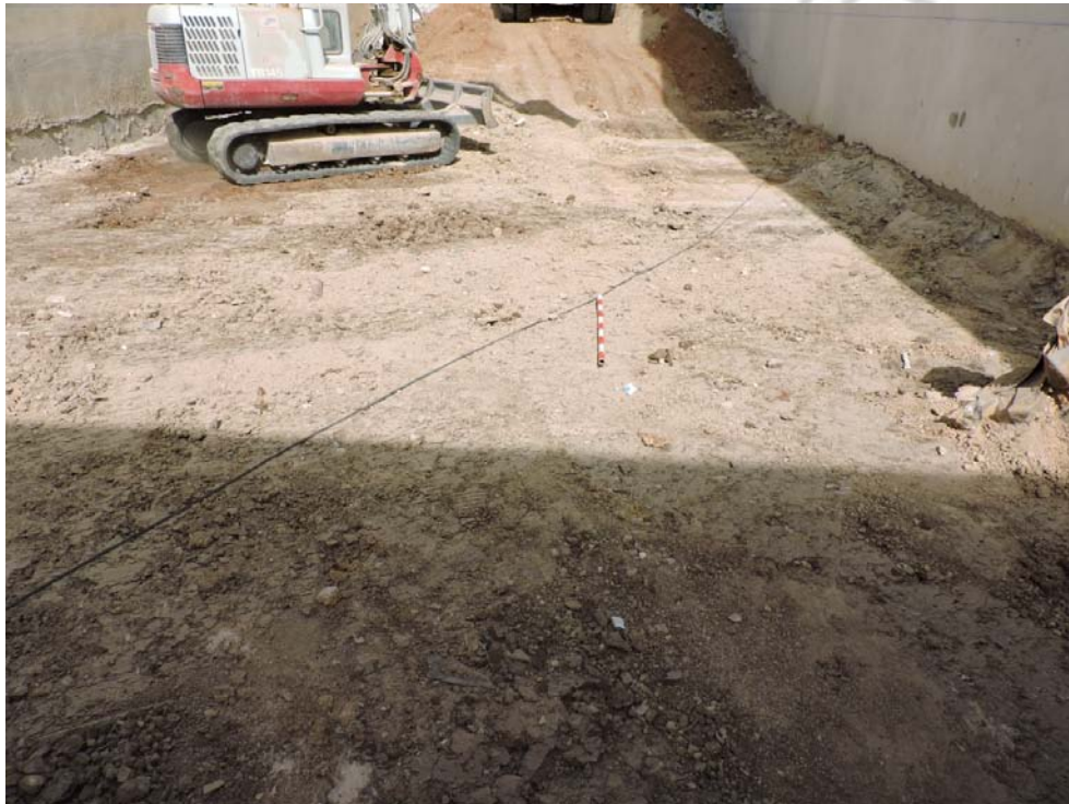
Lám 3: Solar limpio de maleza (vista de unidad sedimentaria 2)