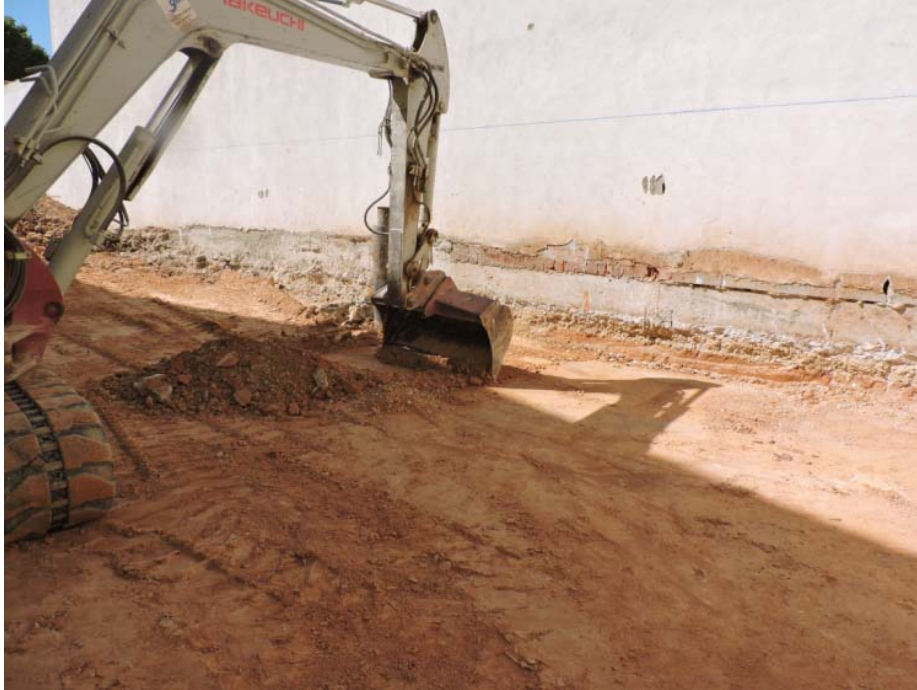
Lám 7: Limpieza del sustrato geológico

Continuamos las labores de excavación de la tierra de cultivo que cubre al sustrato geológico de naturaleza arcillosa. Esta vez dejando limpio el sustrato geológico para examinar la existencia o no de alguna estructura excavada en él.