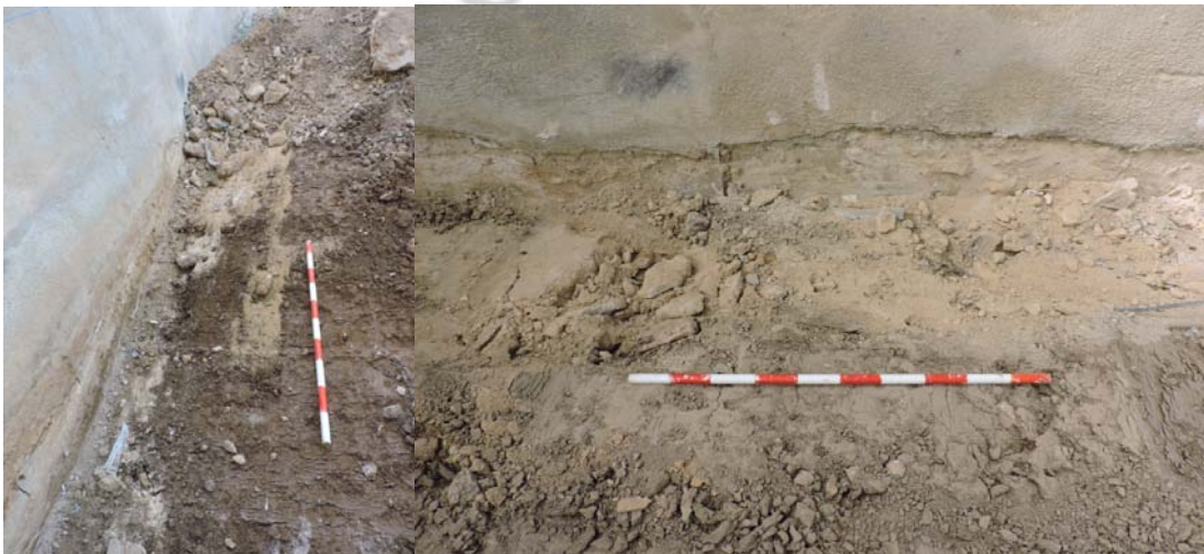
Lám 5 y Lám 6: Zanja de cimentación del edificio situado al norte del solar y al sur

La unidad sedimentaria 2, estrato de tierra de cultivo, posee apenas 20-30 cm. Este estrato estaba muy alterado con restos de construcción contemporáneo como hormigón, ladrillos y desechos como plásticos. Se encontraba cortada por las zanjas de cimentación de los edificios colindantes (unidad constructiva 1, unidad constructiva 2 y unidad constructiva 3)