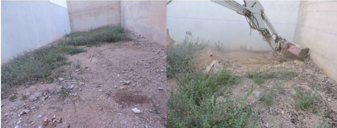
Lám 1 y 2: Vista previa e inicio de las labores de limpieza