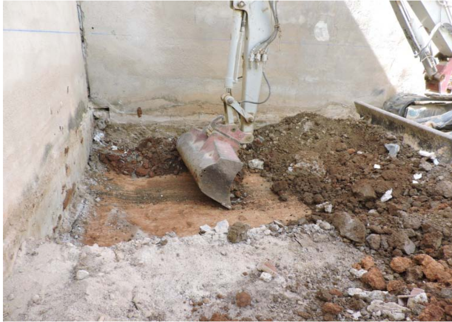
Lám 4: Desmante de la unidad sedimentaria 2 (tierra de cultivo) y vista del sustrato geológico

La unidad sedimentaria 2, estrato de tierra de cultivo, posee apenas 20-30 cm. Este estrato estaba muy alterado con restos de construcción contemporáneo como hormigón, ladrillos y desechos como plásticos. Se encontraba cortada por las zanjas de cimentación de los edificios colindantes (unidad constructiva 1, unidad constructiva 2 y unidad constructiva 3)