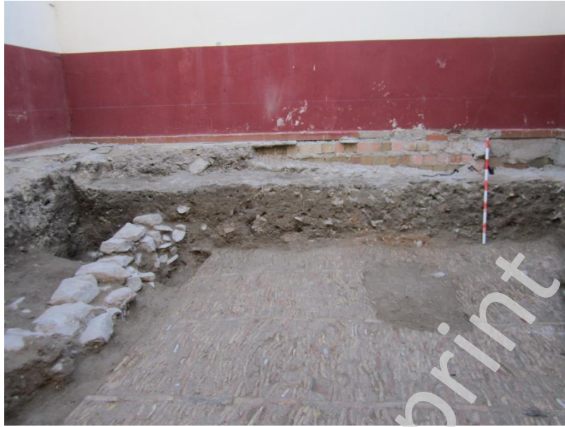
Lam.3 Perfil Este