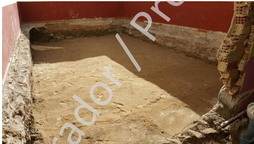
Lam.4 Cubrición de restos con malla geotextil y arena