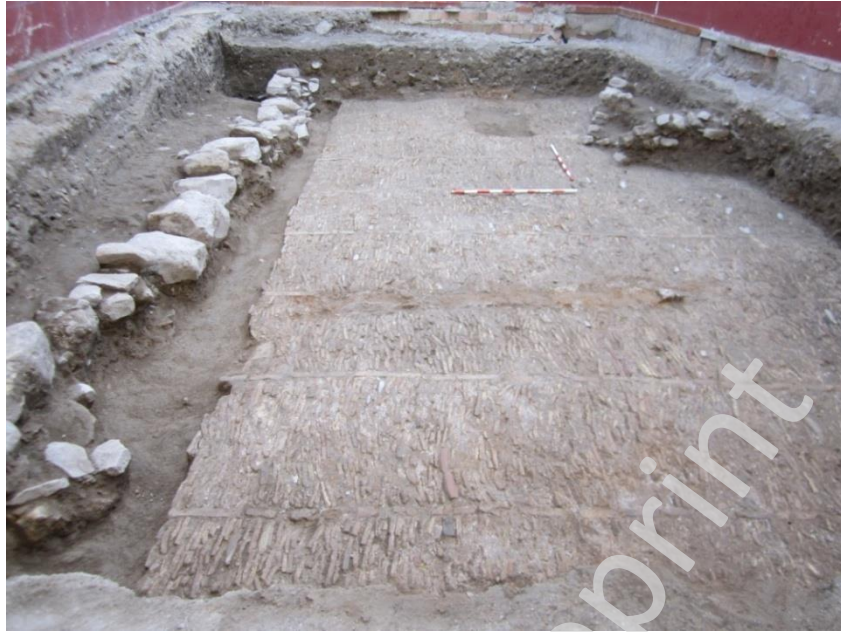
Lam.1 Detalle de pavimento (Uec10)