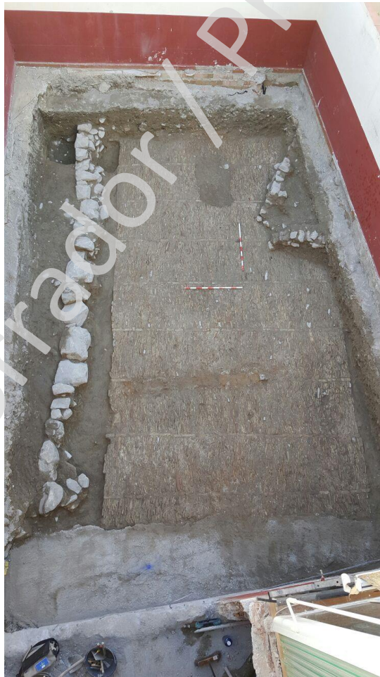
Lam.2 Fotografía planta final