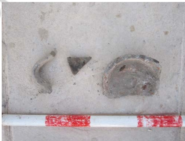
Lam. 3: Material Uec4