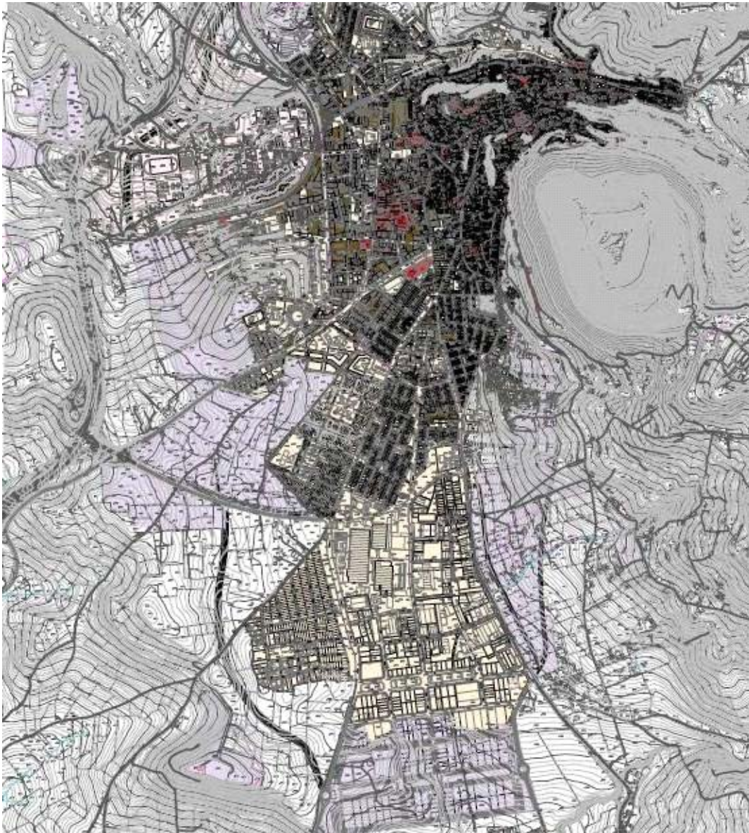
Fig. 1: Ubicación del parcelario en el entramado urbano del municipio de Martos. Plano PGOU (plano O.U-8.1).