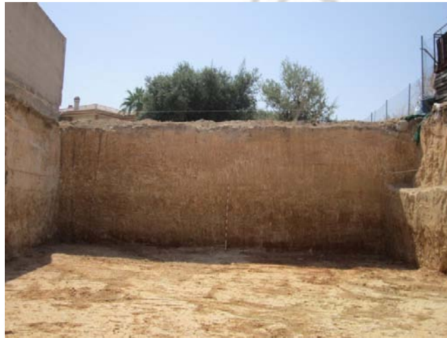
Lam. 2: Perfil SW