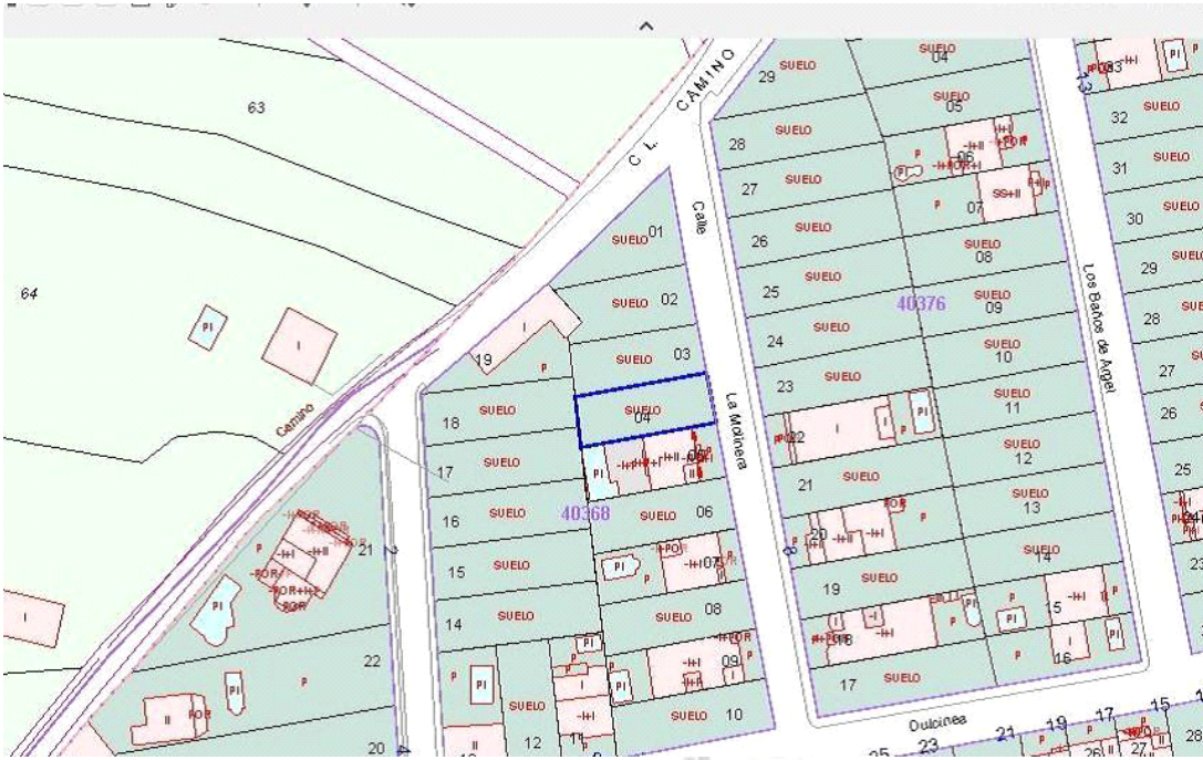
Fig-2: Ubicación del solar. Plano de detalle Catastro 2018.