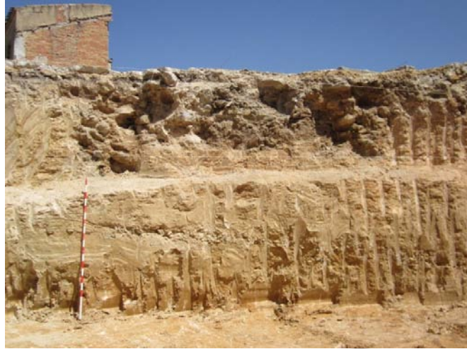
Lam. 1: Detalle de Unidad 5