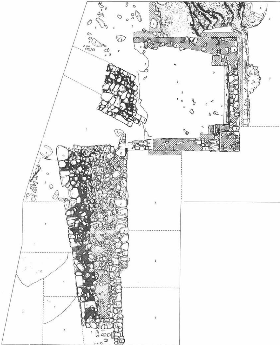
FIG. 3. Planta del nuevo recinto.