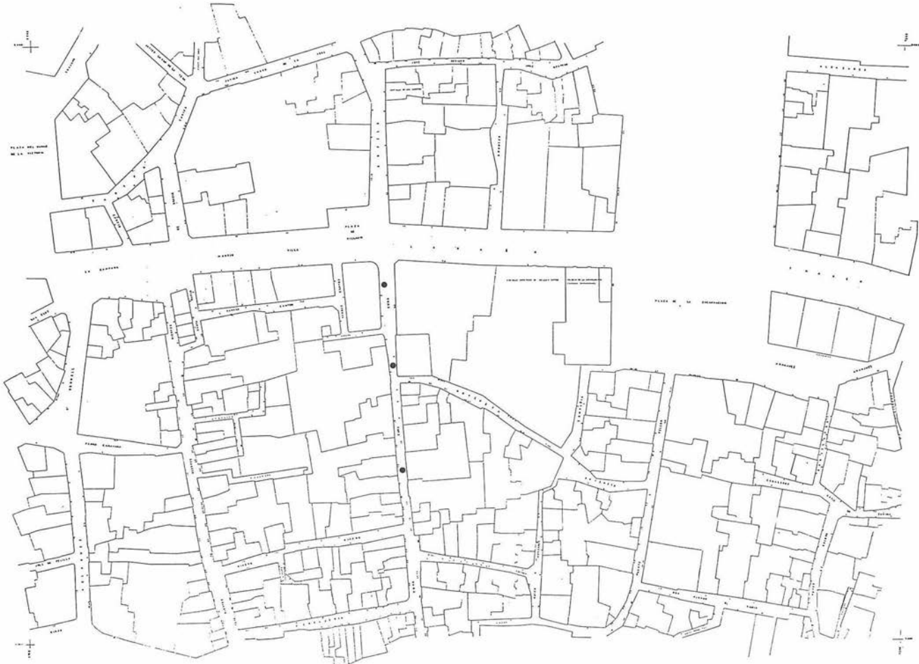
FIG. 5. Actuación en calle Cuna.