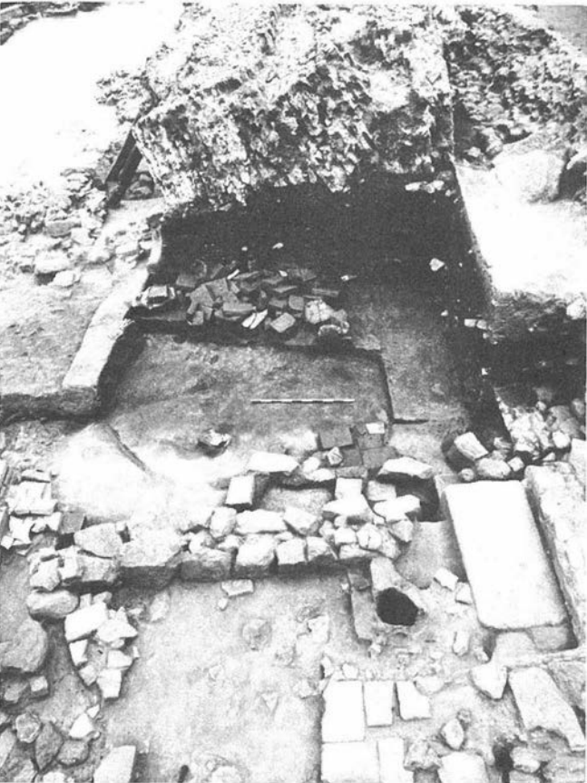
FOTO 1. Minigua. Corte 285. Foro. Vista del muro caído (R 67-85-17).