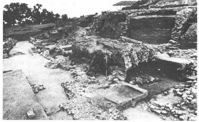
FOTO 2. Minigua. Cortes 287 y 342. Vista de la calle y del muro caído (R 76-85-3).

nuestras observaciones, el nivel de la tierra en el momento de la construcción del foro. En una fase posterior, este nivel fue rebajado hasta la roca al construir un estrecho muro de argamasa delante del muro de cemento. Más tarde, en el siglo IV d.C., hicieron pequeñas casas delante del muro de contención del foro utilizándolo como muro de fondo. Los cimientos de estas humildes construcciones descansan directamente encima de la roca y con-