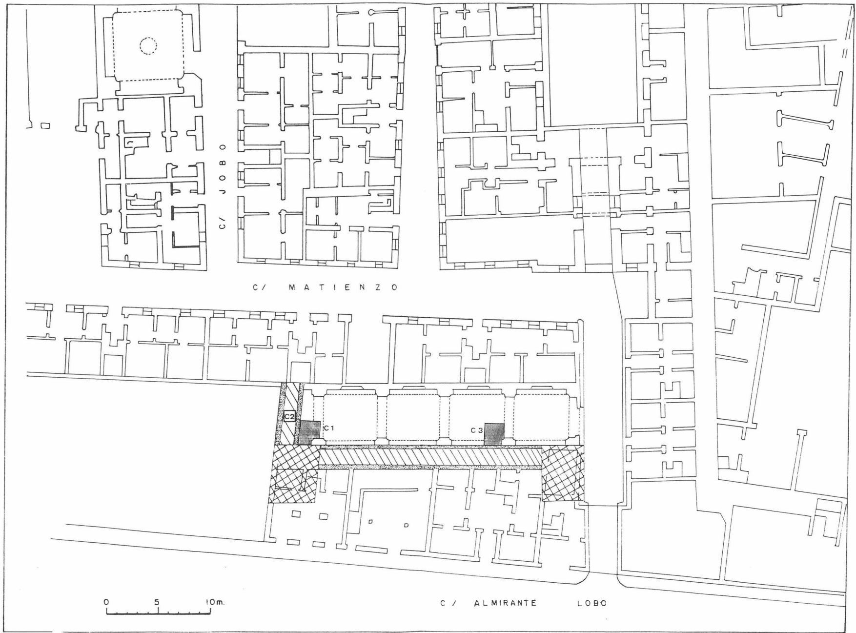
Fig. 2. Casa de la Moneda/86. Plano general. 1ª fase (Cortes 1 a 3). 2ª fase (Cortes 4 a 11).