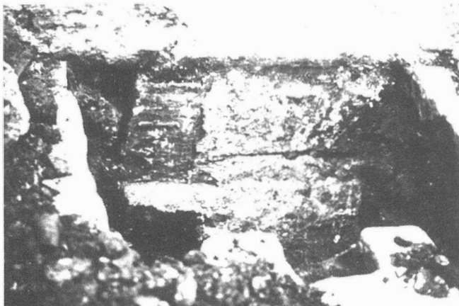
Lám. II. Vista general de uno de los cortes realizados.

Con las intervenciones realizadas se ha obtenido un volumen de datos referidos tanto a la muralla como al recinto de la Casa de la Moneda que consideramos óptimo en función del tiempo de actuación.