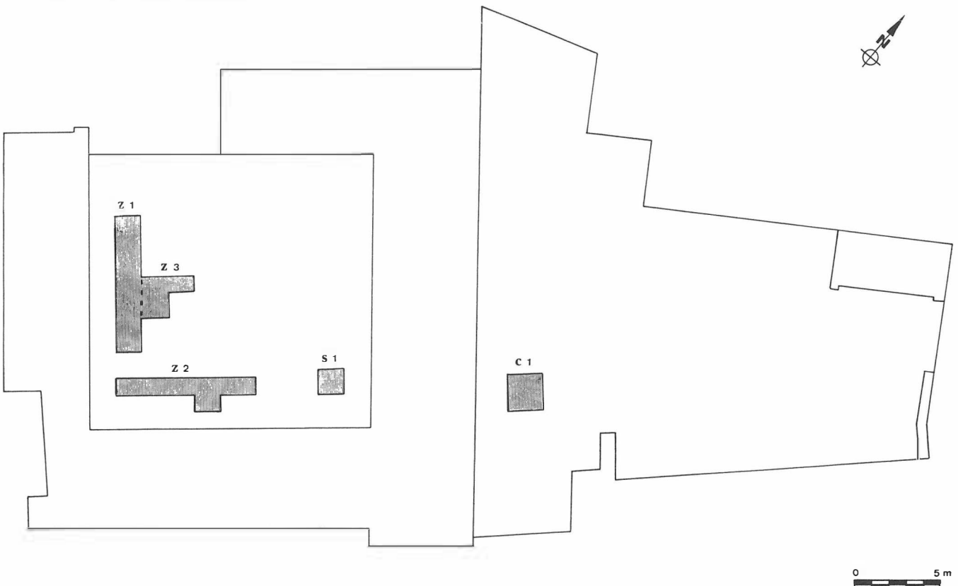
Fig. 2. Plano del solar con indicación de los cortes.

Debemos también señalar el mantenimiento de la misma alineación de las construcciones desde época árabe hasta la actualidad.