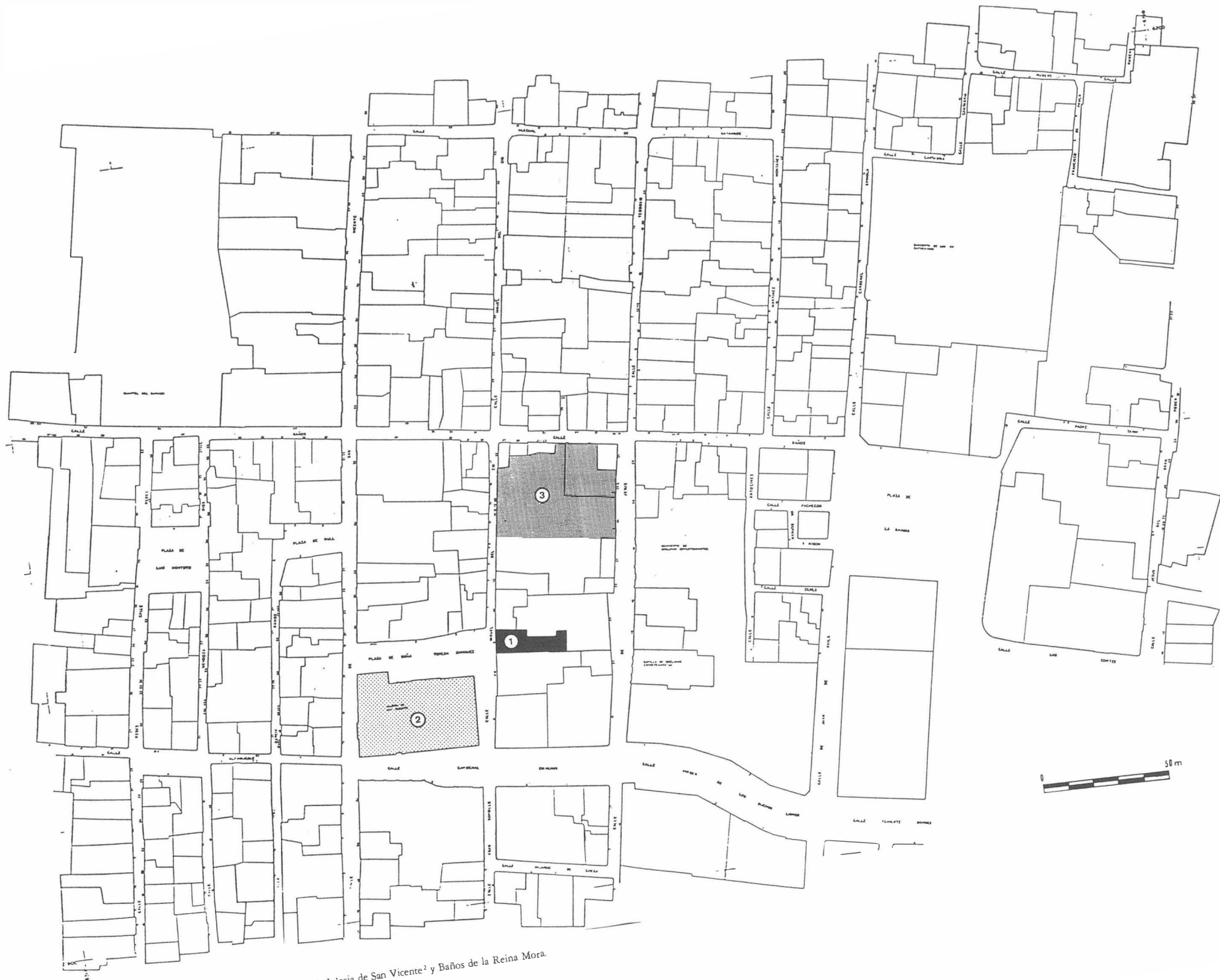
273 Fig. 2. Plano del sector con indicación del solar excavado 1 . Iglesia de San Vicente 2 y Baños de la Reina Mora.