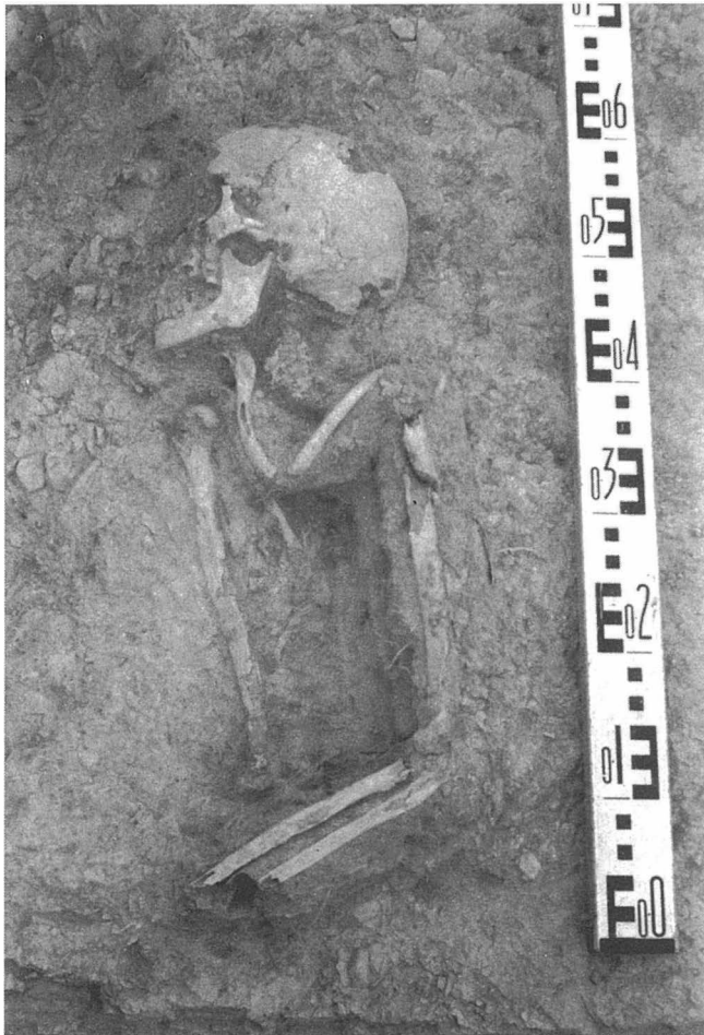
FOTO. 2. Enterramiento Corte II.