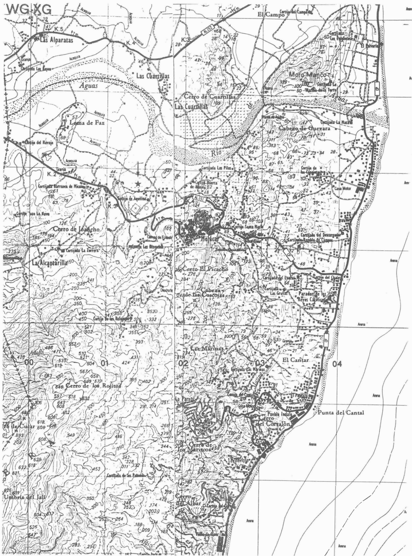
FIG. 1. Situación de la excavación.