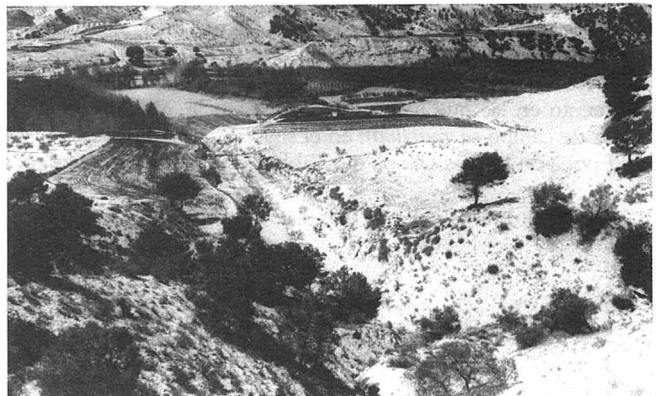
FOTO 4. Perfil con restos arqueológicos del Cortijo de Flora (GR.CZ.13).