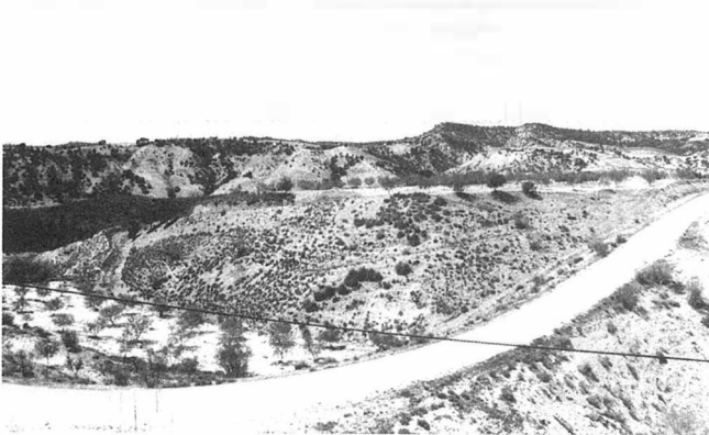
FOTO 2. Vista general de la Peña del Sagrado Corazón (GR.CS.2) y Castril desde el Sur.