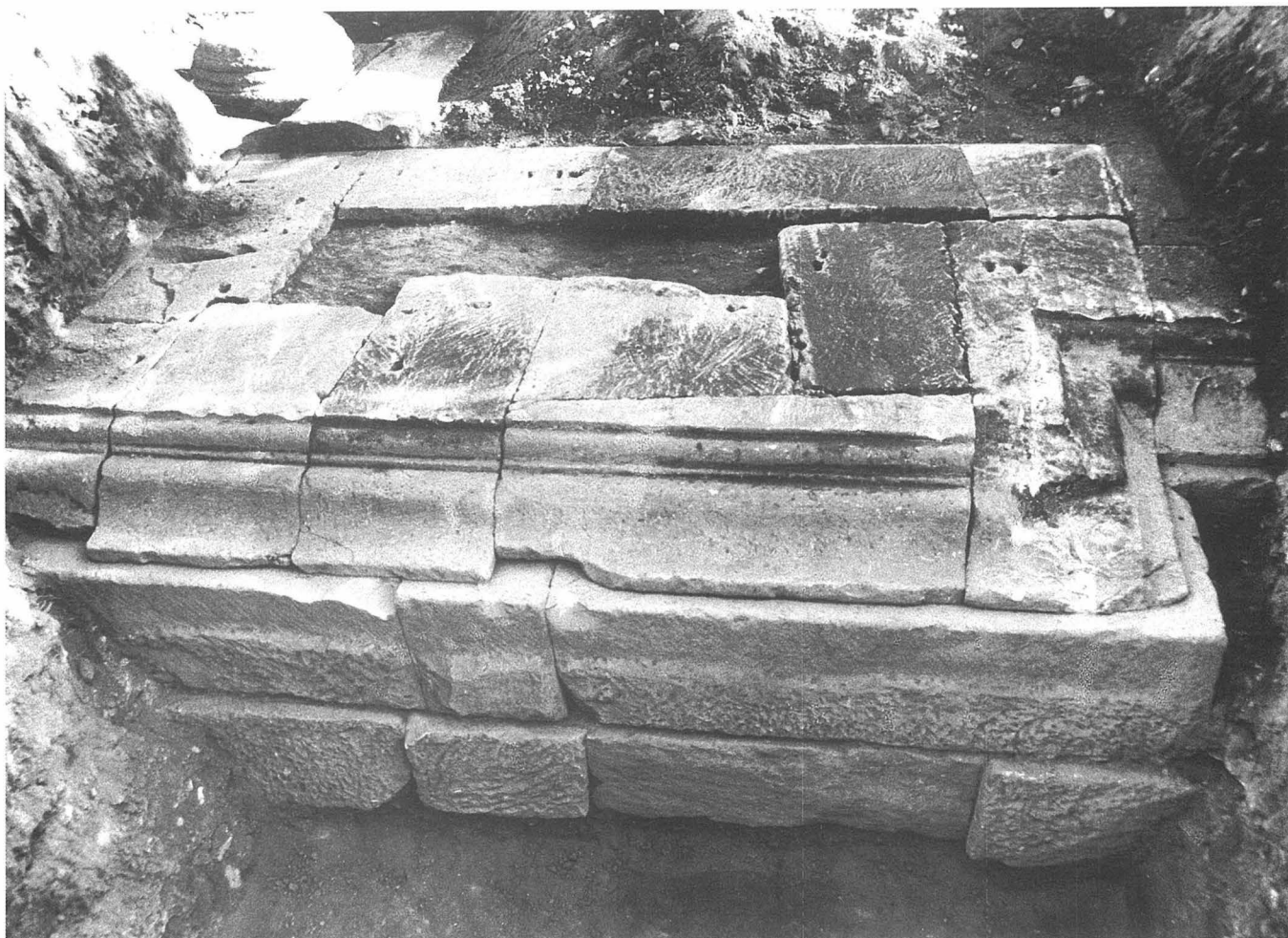
FIG. 2. Construcción de sillares situada al borde Oeste de la plaza. Vista desde el Norte (campana 1990).