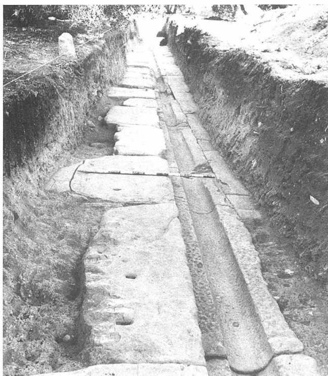
FIG. 3. Límite Norte de la plaza. Vista desde el Oeste (campana 1990).

de una longitud de 26 m., con la intención de proseguir el trazado del canal de desagüe; el cual discurría a lo largo de todo el corte cortándose a los 25,50 m., limitado por el enlosado por un lado y, por otro, por sillares más elevados (Fig. 3).